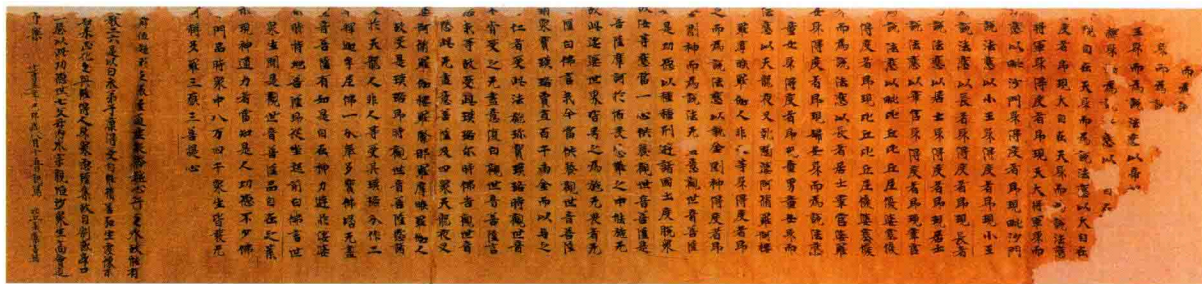
《妙法莲华经·观世音菩萨普门品》抄本残卷