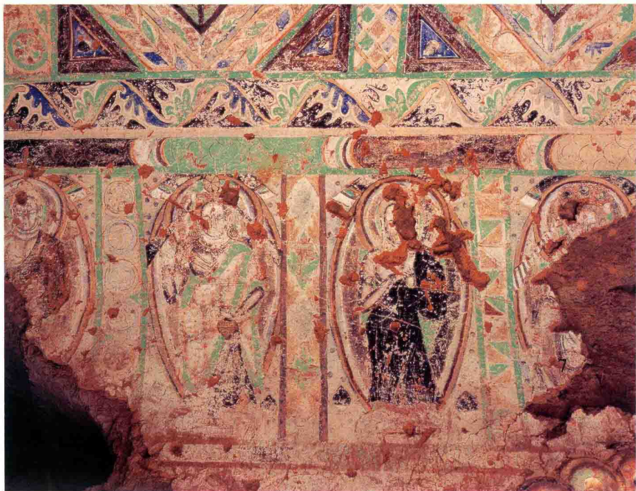
佛与菩萨及平棋图案

方形纵券顶主室周围开凿小禅室，第42号窟主室顶部和侧壁上下分层左右分格绘制禅观图。这些禅观图大同小异：第1号窟残存有《快目王施眼》等本生、因缘故事画，两个窟内正壁绘制完全相同图案化了的《净土化生》。苦行禅修，往生净土，反映了高昌禅学的宗旨，立意鲜明。比丘禅观图，为禅僧树立仿效的榜样，宣扬禅学，在其他地区也不多见，其壁画作用不可低估。第42号窟东壁北端小禅室内所绘禅观图，两个比丘分坐树下相对观望站立中间的一身裸体女子，表现的是禅学中的“不净观”。禅窟与礼拜窟、僧房等不同类型和用途的洞窟有机地组合在一起，这种布局常见于龟兹地区，在内地石窟中甚为少见，它是高昌佛教早期盛行禅学的反