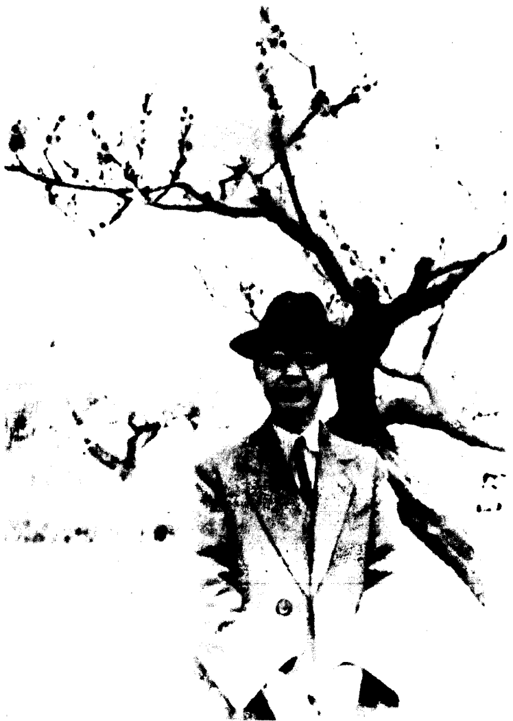
作者一九三五年在青岛