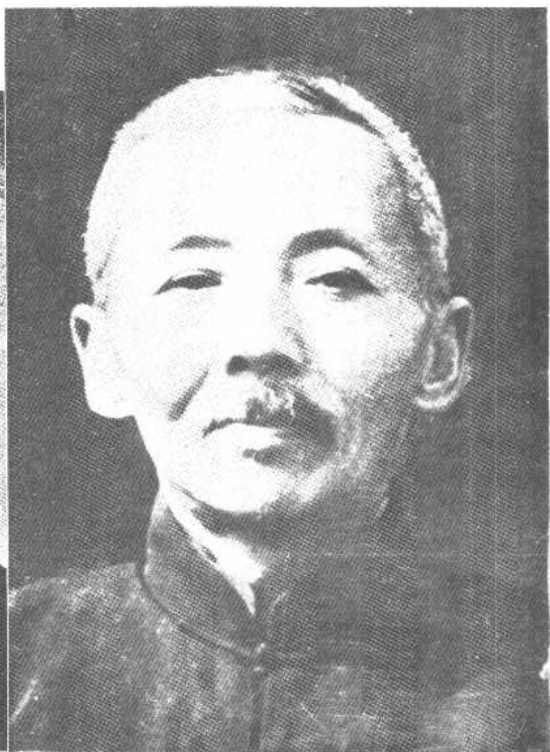
↑ 主張文章報國的 張季鸞先生