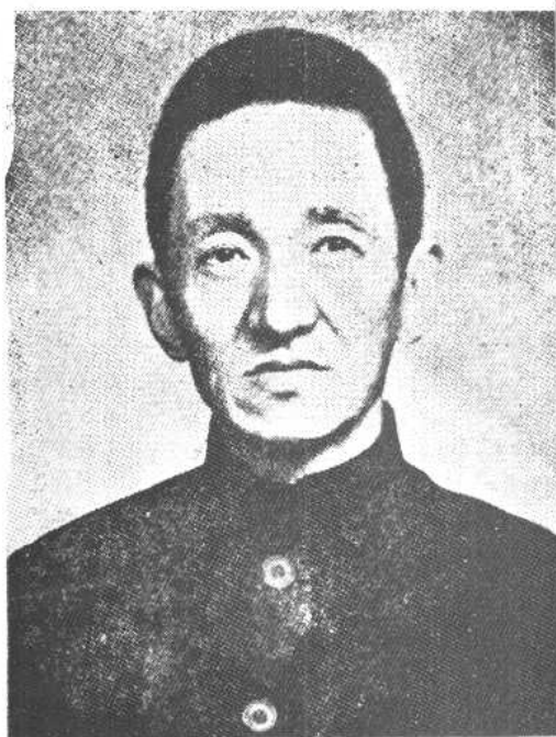
↑ 北伐前後輿論界權威 陳布雷先生