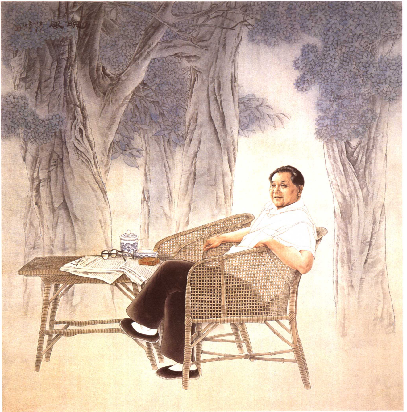
© 刘大为·晚风 1991年 绢本 180cm × 176cm