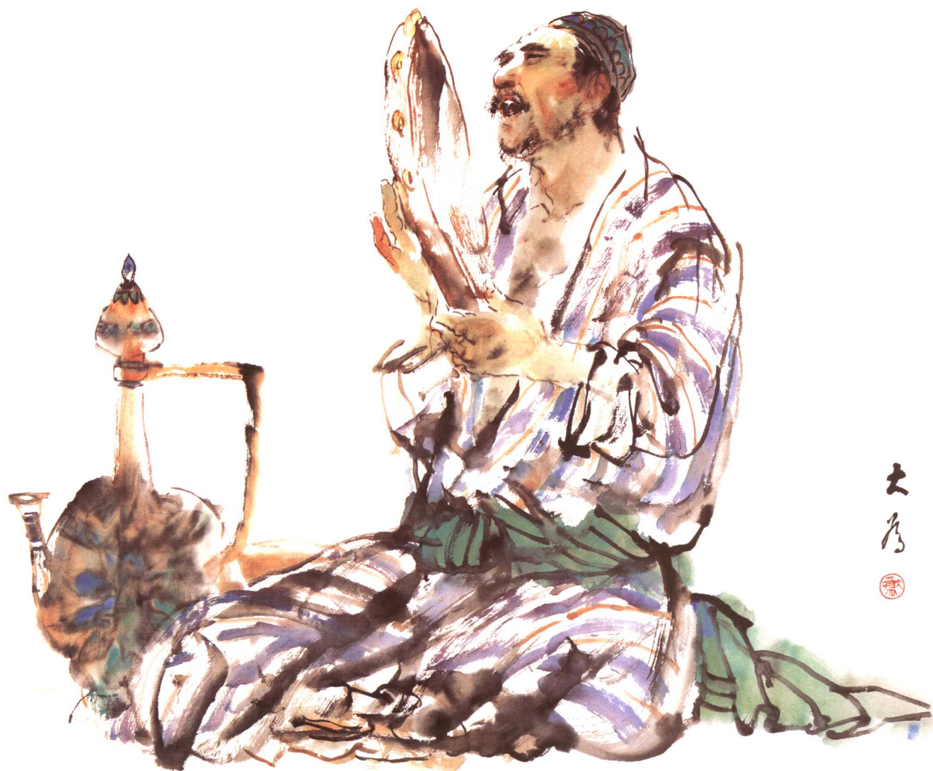
© 刘大为·天山鼓手 2000年 纸本 68cm × 68cm