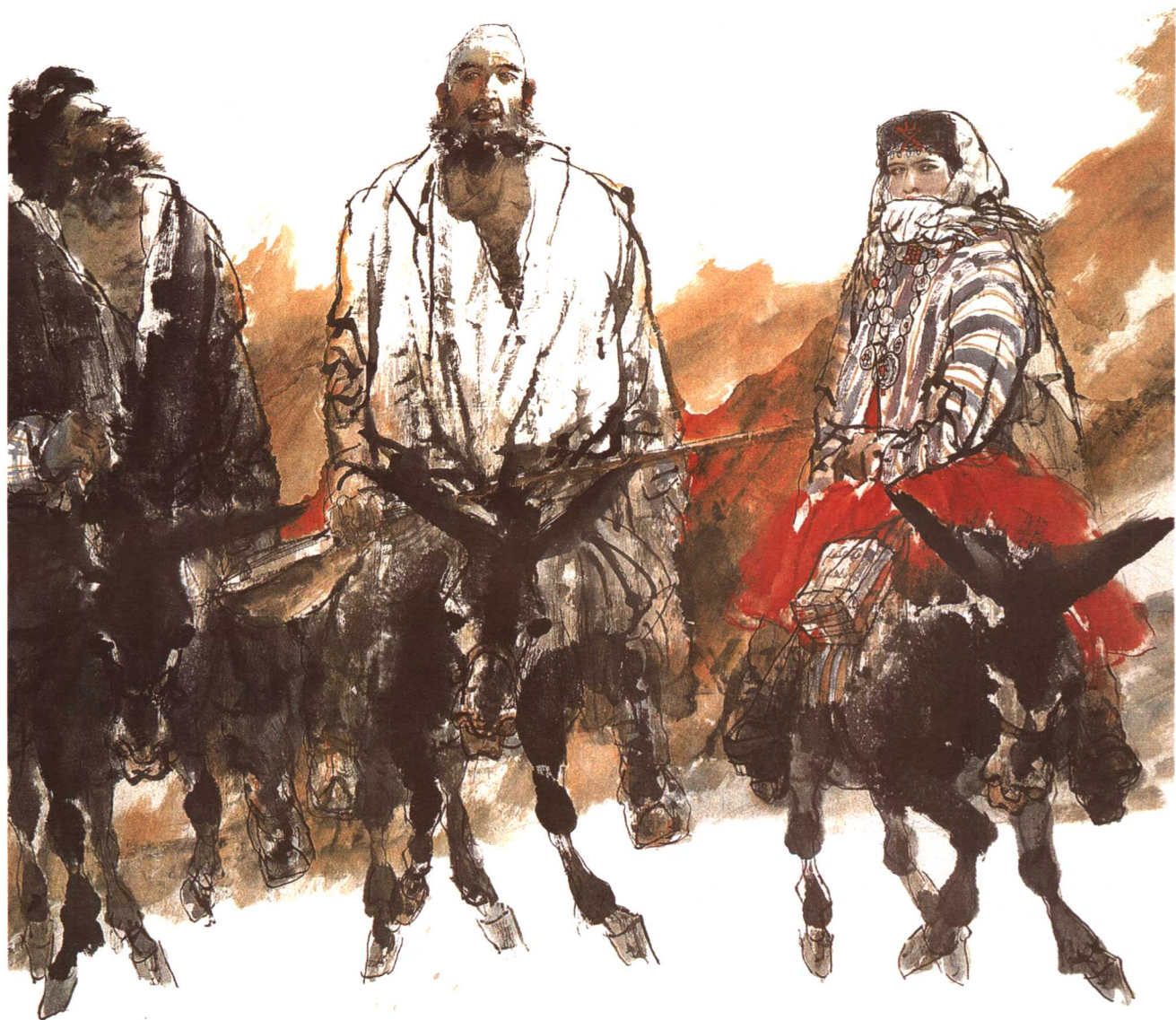
© 刘大为·巴扎归来 1999年 纸本 180cm × 150cm