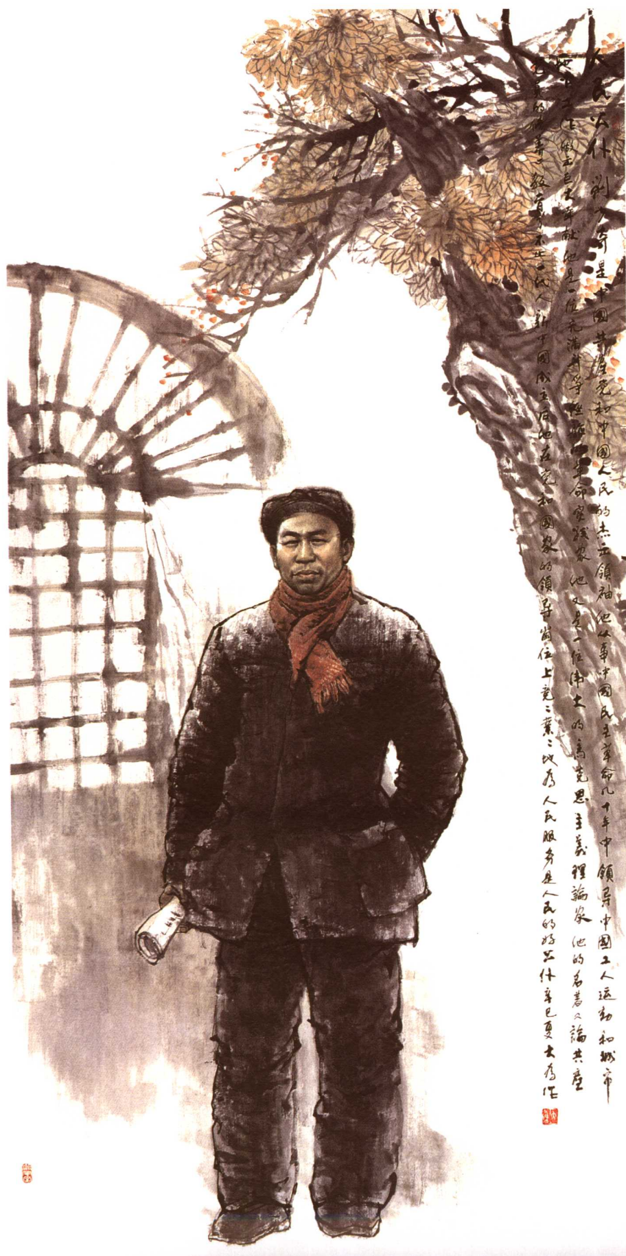
◎ 刘大为·人民公仆 2001年 纸本 200cm × 100cm