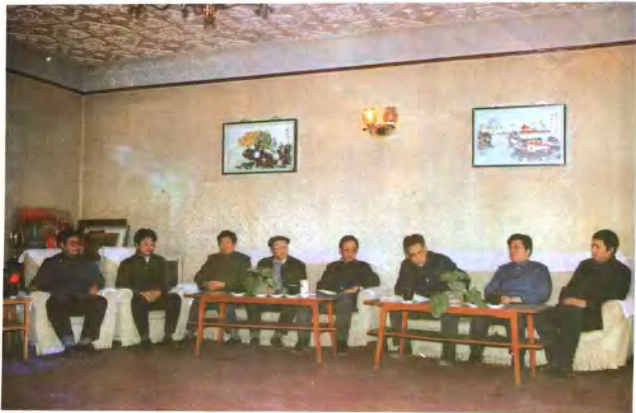
领导班子研究经营决策问题