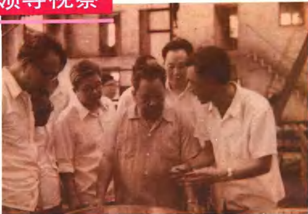
中共河南省委书记杨析综（右三）来厂视察