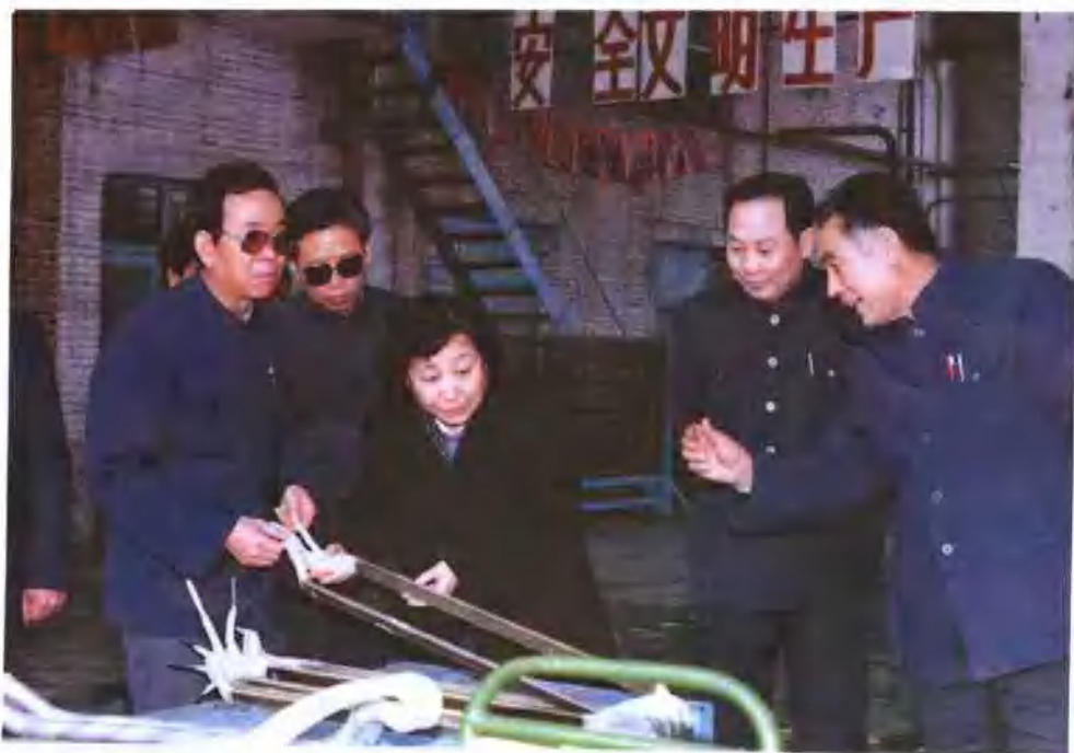
中共河南省委副书记赵地（右三）来厂视察