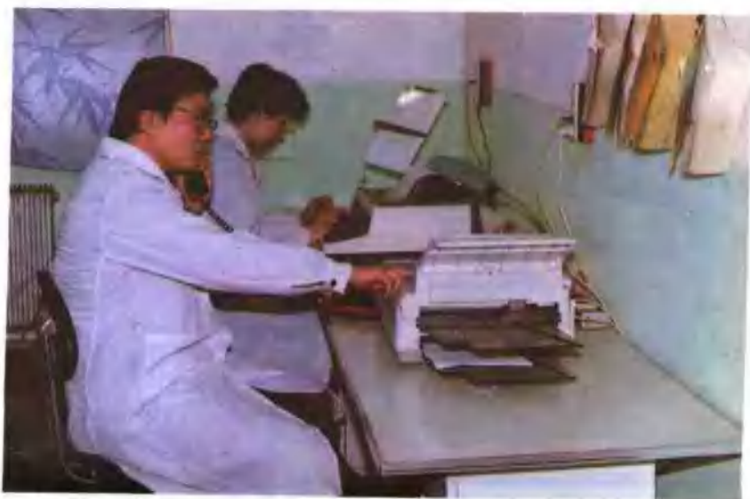
电传、传真、直拨 电话通讯室