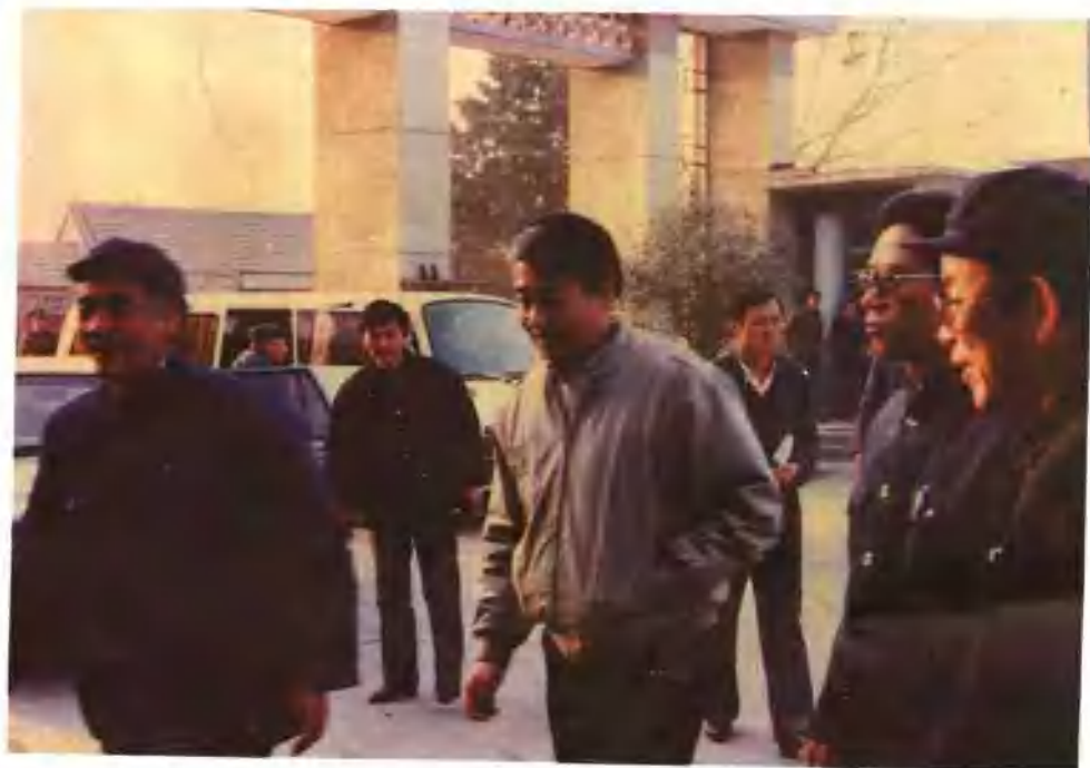
河南省副省长刘源（左三）来厂视察