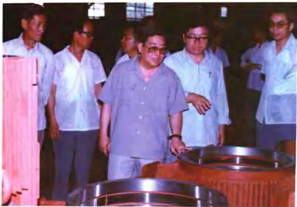
中共河南省委常委、副省长秦科才（左三）来厂视察。