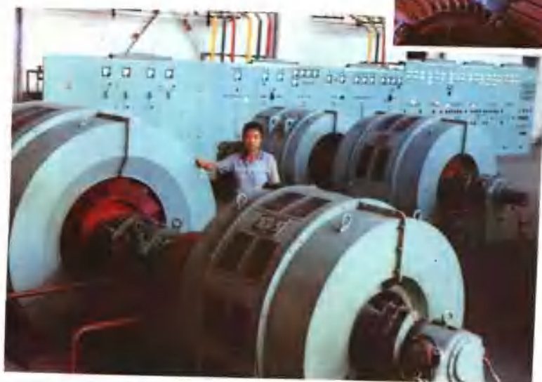
目前我国最大的2500kw 防爆电机试验站