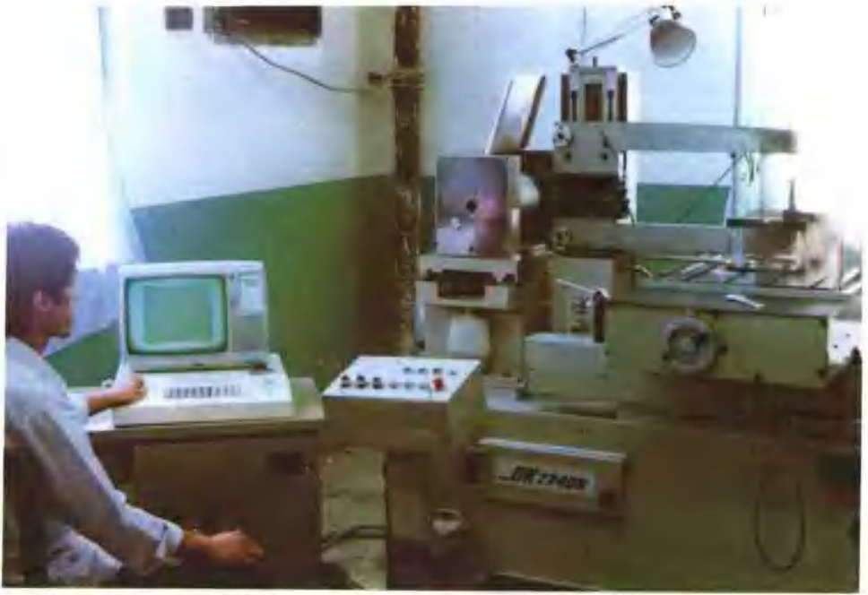
工具车间数控线切割机床