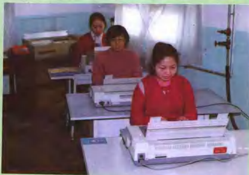
现代化的文印设施