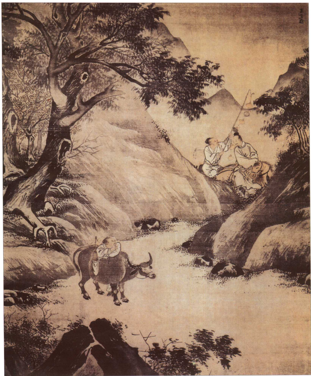
高士访隐图（明·王世昌）

群雄争霸的乱世中，散居于四野的隐士，是爱才擅任者的无价之宝。图中高士驾乘枣红马，衣着神态文质彬彬，似有治世之志；侍者风尘仆仆，