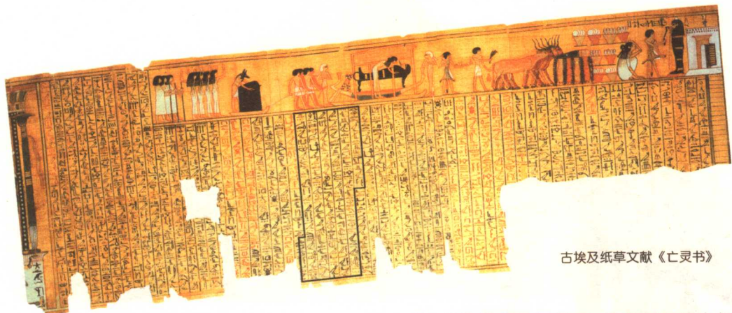
古埃及纸草文献《亡灵书》

之间没有任何粘接物,而是把一块石头直接放在另一块石头上,拼合得天衣无缝,甚至连最薄的刀片也插不进去。砌工之精确,内部结构之复杂,实在令人惊叹不已。同时,由于金字塔造型独特,凌厉的风势不得不沿着塔的斜面或棱角上升,塔的受风面由下而上越来越小,在塔顶,塔的受风面趋近于零,这种以柔克刚的独特造型,把风的破坏力降到最小程度。这就使金字塔虽然历经数千年的风吹雨打,却依然屹立在埃及大地上。