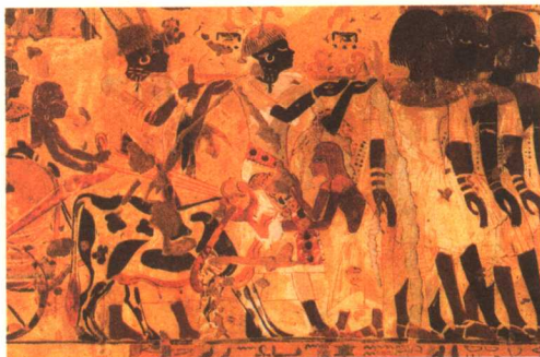
骑牛车的努比亚公主

一位努比亚公主乘坐由两头牛拉的战车,她的随从捧着金指环、豹皮以及其他礼物,将其敬献给古埃及第十八王朝法老图坦卡门。