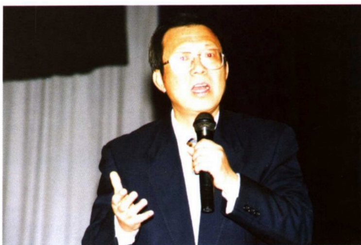
“挑战人生”主题讲演 (在新东方语言学校)