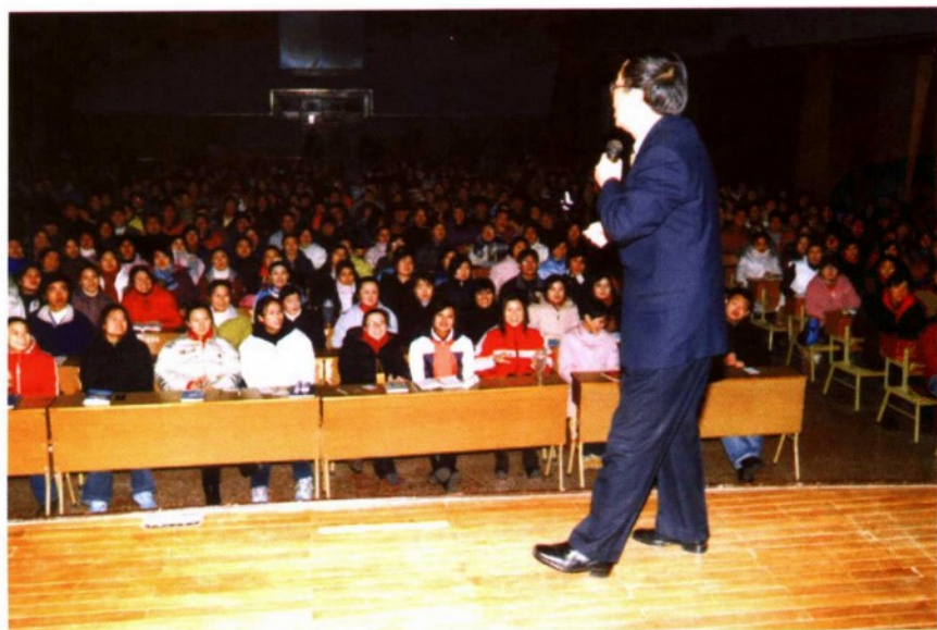
述者动情 听者动容