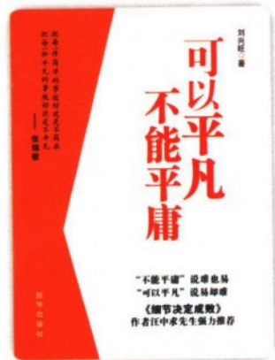
作者：刘兴旺 定价：22.50元