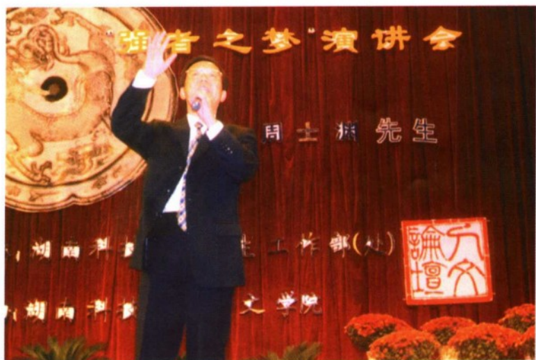
“强者之梦”朗诵演讲 (在湖南科技大学体育馆)