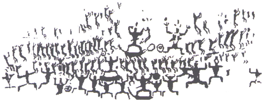
广西花山岩画临摹图