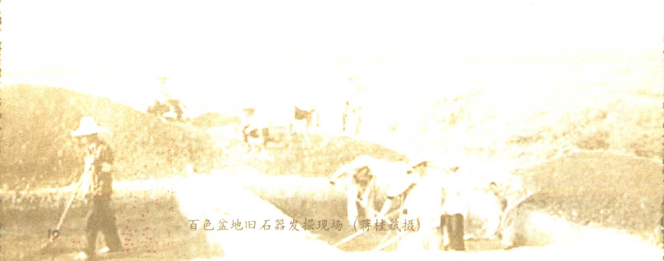
百色盆地旧石器发掘现场

定模洞人 定模洞所在的定模山位于田东县城西部13公里，距右江约3公里，西距田阳县城18公里。定模山高约70米，长约300米，宽约200米。该山四周宽阔，西、南两面是低平的一级阶地，已辟为水田，东、北两面与侵蚀丘陵的直缘连接。山上山下洞穴众多，其中北部、东部和南部都有含古文化遗存的大溶洞，尤以北部山峰下的定模洞最大。洞内的石器堆积多达四层。该遗址是1979年发现的，共存的还有打击石器、用火遗痕和动物化石。同年10月，又在该洞尽头