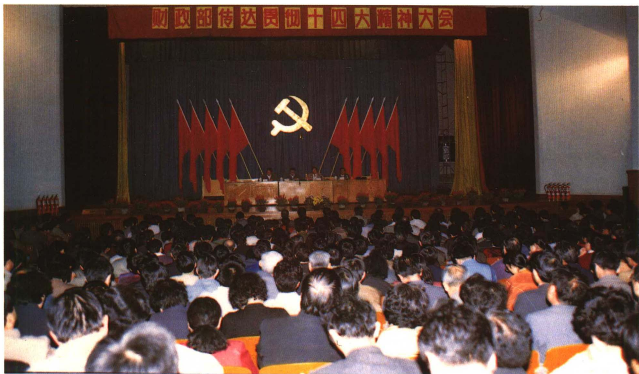
▲1992年10月20日,财政部召开全体党员大会,传达贯彻党的十四大精神。