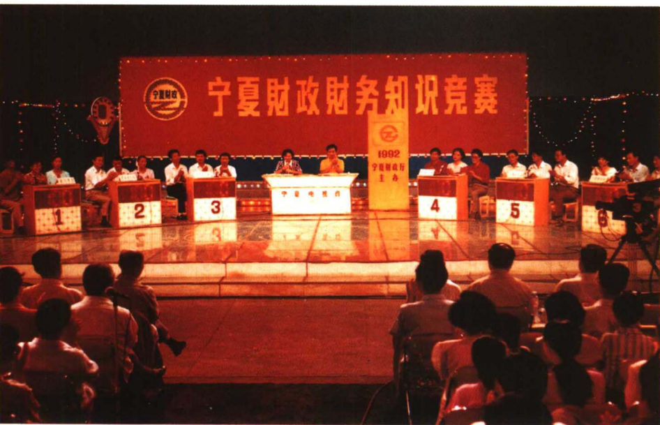
◀ 为了提高财政干部业务素质，宁夏回族自治区财政厅于一九九二年上半年在全区开展了财政财务知识竞赛活动，参加人数占全区财政干部总数的百分之九十三。图为电视公开对抗赛赛场。