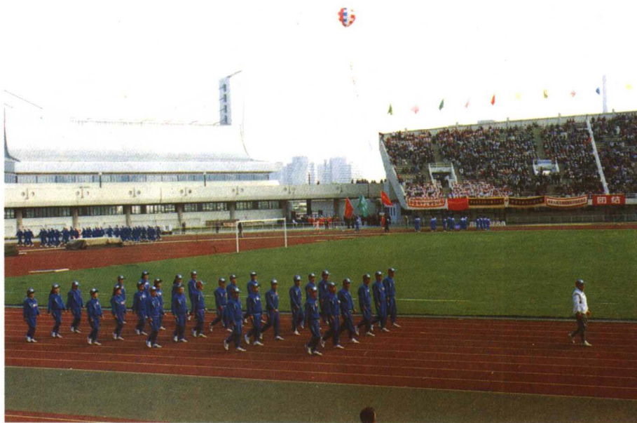
▶ 1992年9月26日，中央国家机关职工运动会在北京国家奥林匹克体育中心举行。图为财政部代表队由项怀诚副部长领队步入运动场。