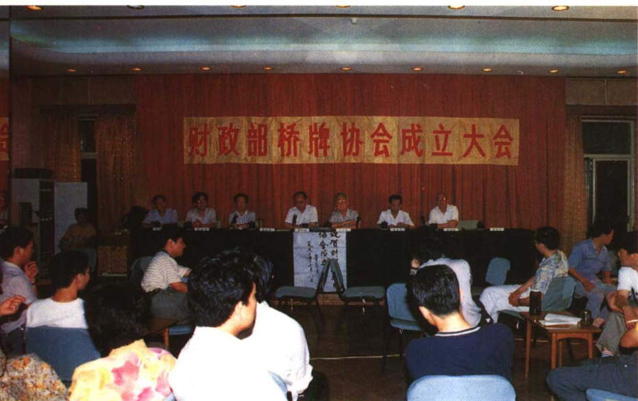
◀ 一九九二年七月八日，财政部桥牌协会成立。财政部副部长项怀诚、中国桥牌协会主席荣高棠出席了成立大会。