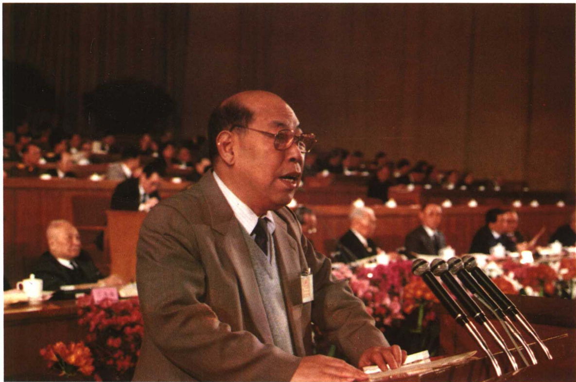
▲1992年3月21日,国务委员兼财政部部长王丙乾在第七届全国人民代表大会第五次会议上作关于1991年国家预算执行情况和1992年国家预算草案的报告。