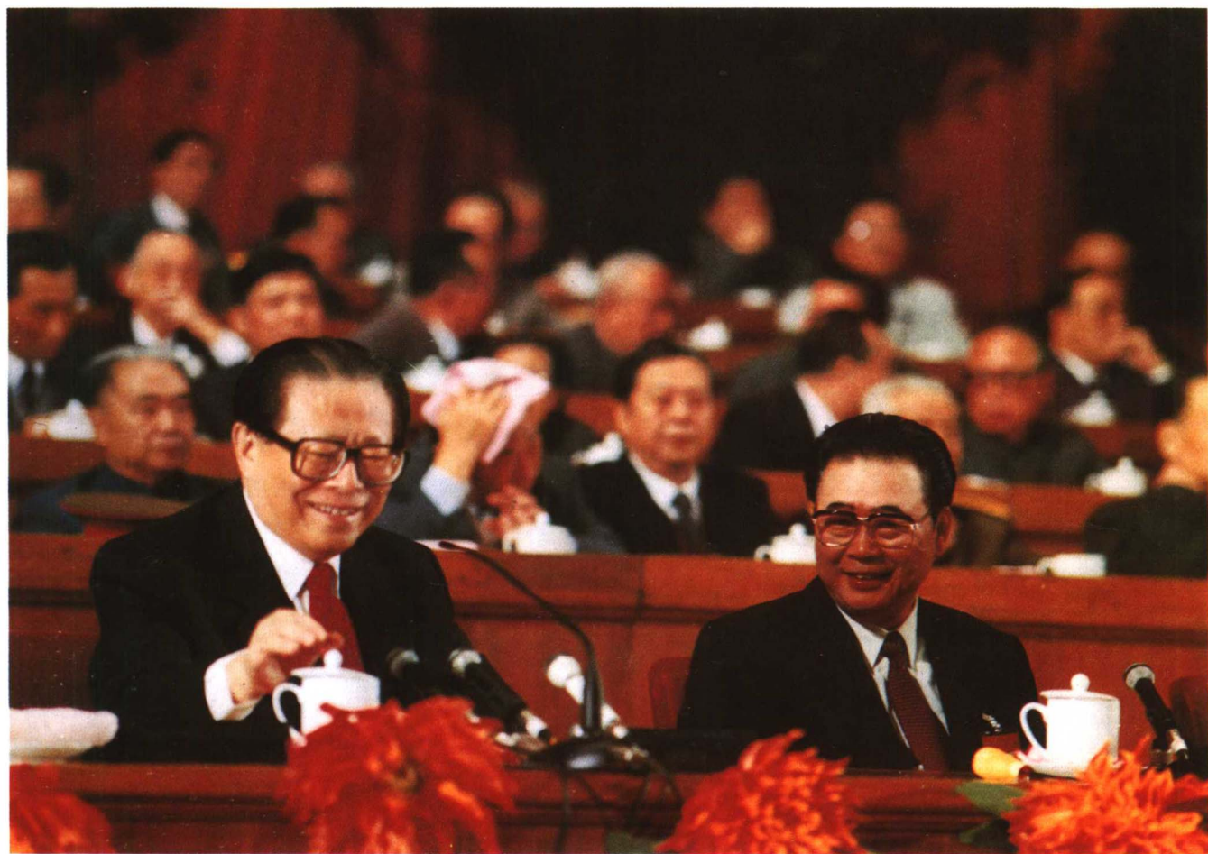
▲1992年10月12日，中国共产党第十四次全国代表大会开幕。图为江泽民、李鹏在大会主席台上。