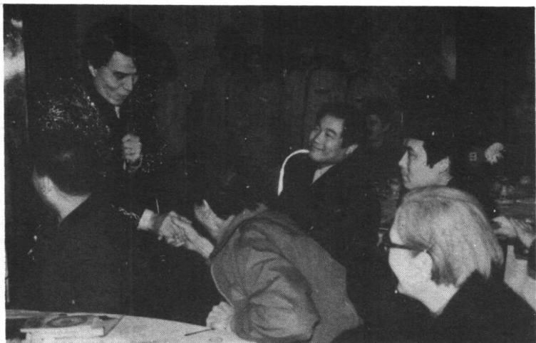
台湾影、歌、视“三栖明星”林冲先生，初到北京，百感交集。他激动地说：“没想到的，没见过的太多了！周围所有的人都那么和气，长城是那么雄伟……这一切，对我来说都是生平第一次。”