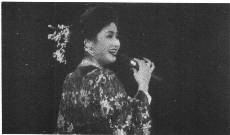
台湾著名影视歌演员池秋美小姐在上海为上海市民演唱。