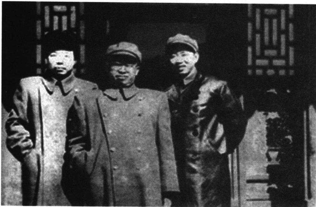
(从右起)空军刘亚楼司令、罗荣桓、空军政委肖华在一起