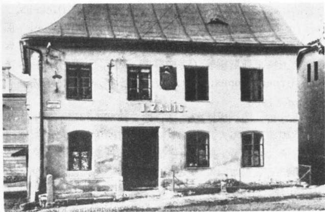
佛洛伊德的誕生地