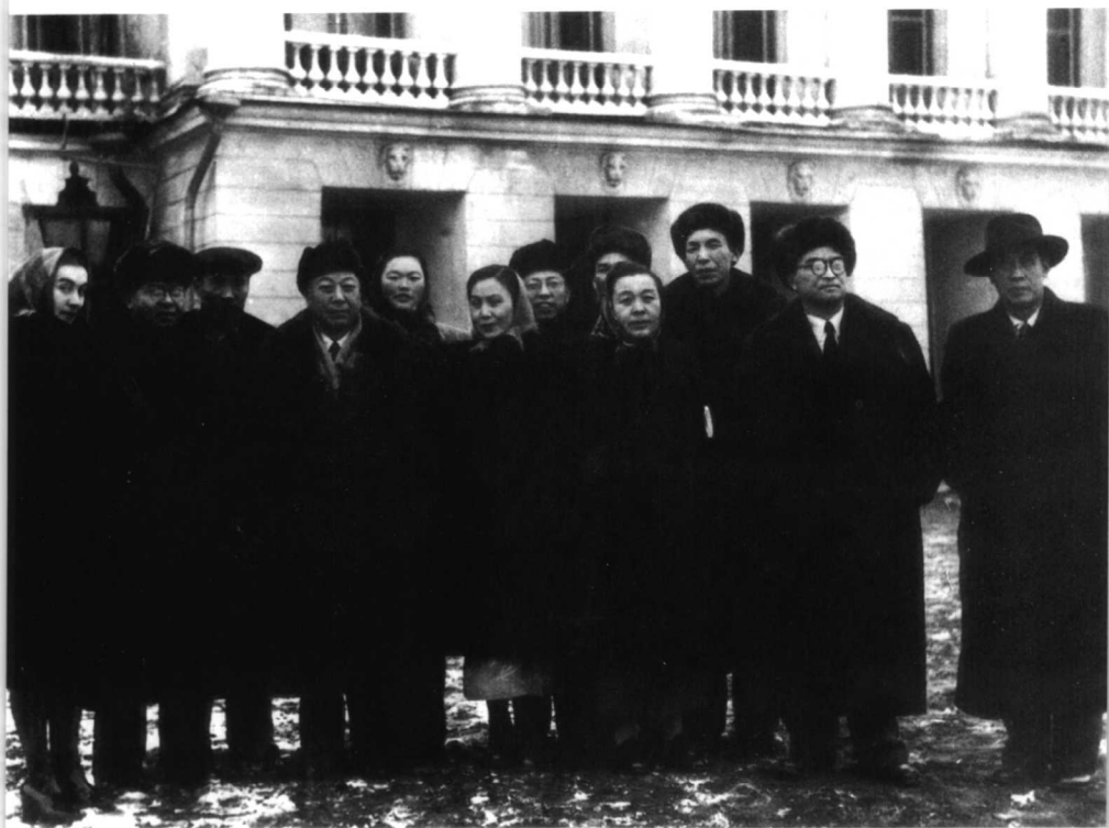
1949年11月，丁玲率团访苏与部分团员在莫斯科合影。前排自右： 2、沙可夫，3、丁玲，4、白杨，5、丁西林，6、吴晗；后排自 右：1、赵树理，2、许之桢，3、曹禺，4、李凤莲