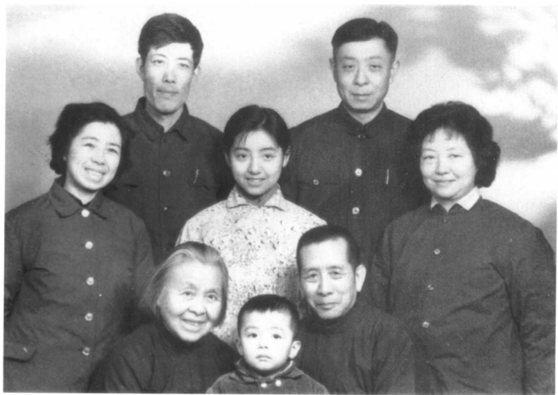
1979年1月，丁玲在北京与儿女团聚全家合影