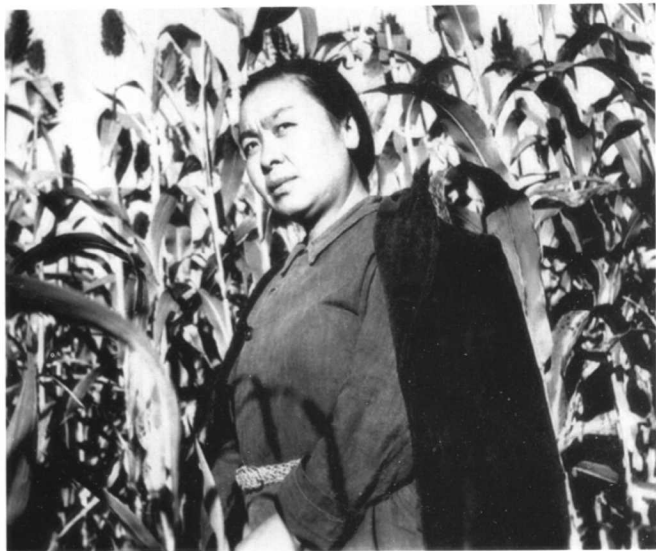
1946年7月，在涿鹿县桑干河畔温泉屯参加土改工作的丁玲