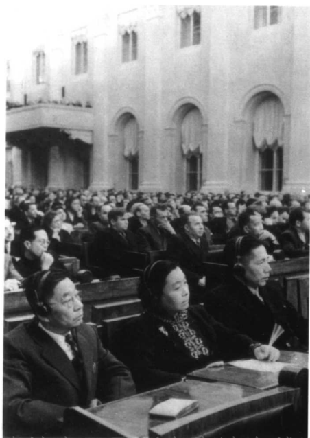
1954年12月，丁玲与周扬、老舍在莫斯科参加全苏作家第二次代表大会