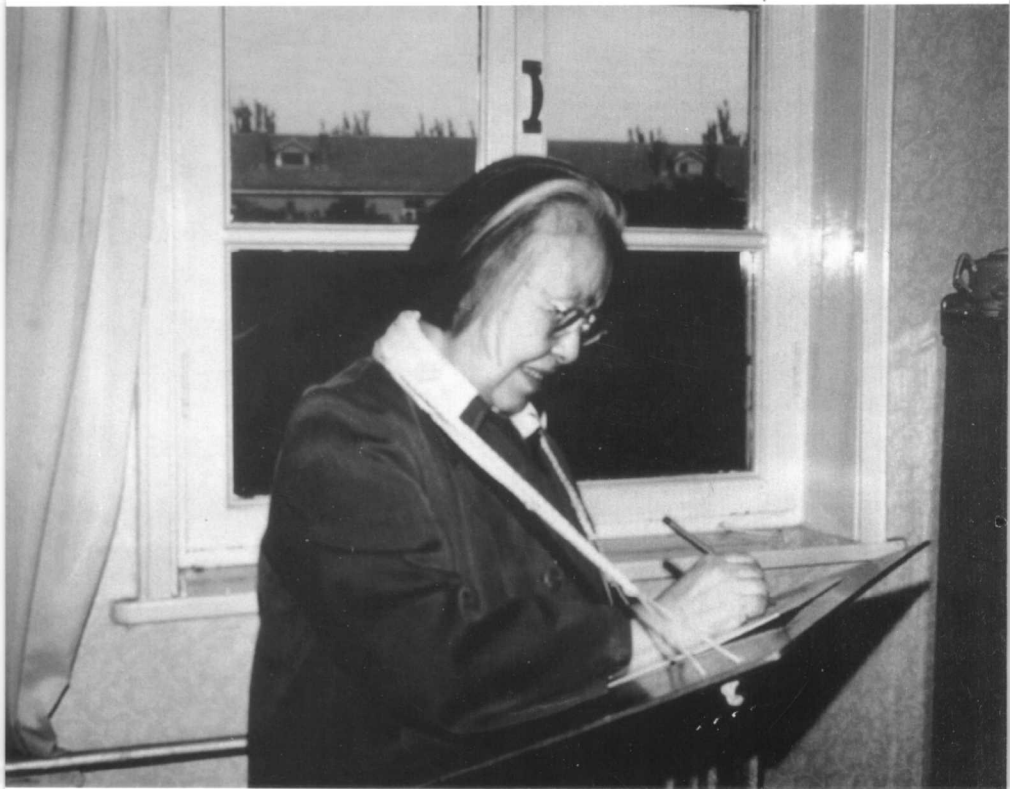
1979年丁玲经中组部批准回京治病，临时住在友谊宾馆公寓。 丁玲因腰疼不能久坐，陈明动手为她制作了专用书写板。 图为丁玲在写作