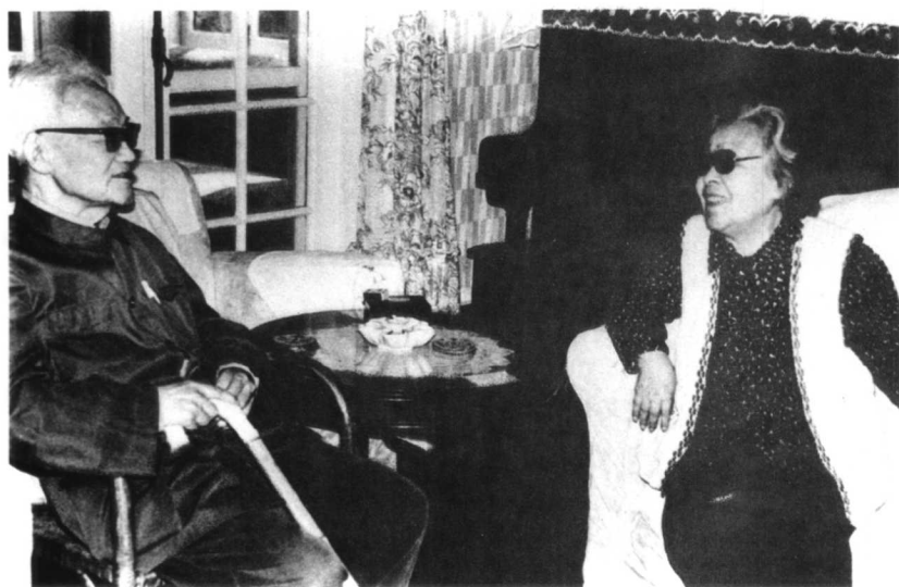
1983年5月，在上海看望巴金