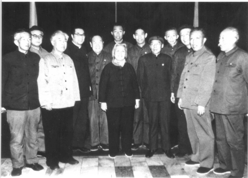
1979年在全国第四次文代会期间，丁玲与马烽，康濯，田间等原文讲所的同志合影