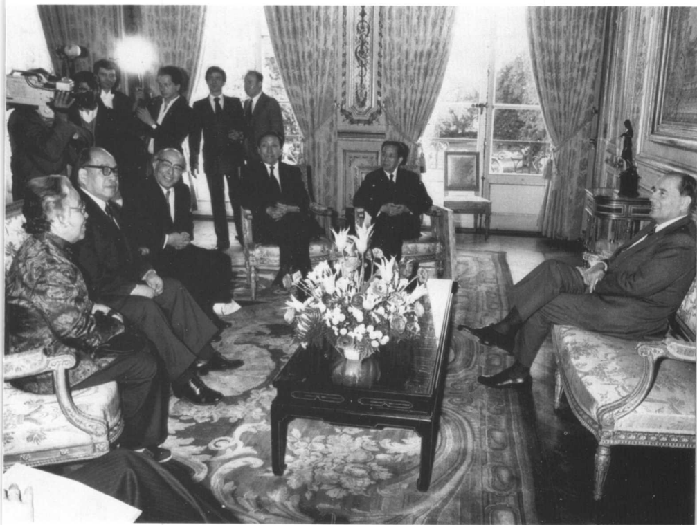
1983年4月，法国总统密特朗在巴黎爱丽舍宫会见丁玲等中国客人