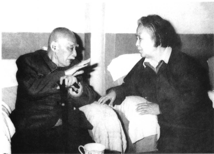
1979年5月，丁玲探望叶圣陶