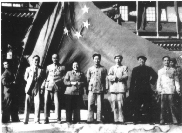
1949年9月丁玲参加第一届全国政协会议，通过了中华人民共和国新国旗，照片是第一面国旗送至政协会场——中南海怀仁堂门前所摄，左起：马思聪、胡风、丁玲、艾青、赵树理、田汉、蔡楚生