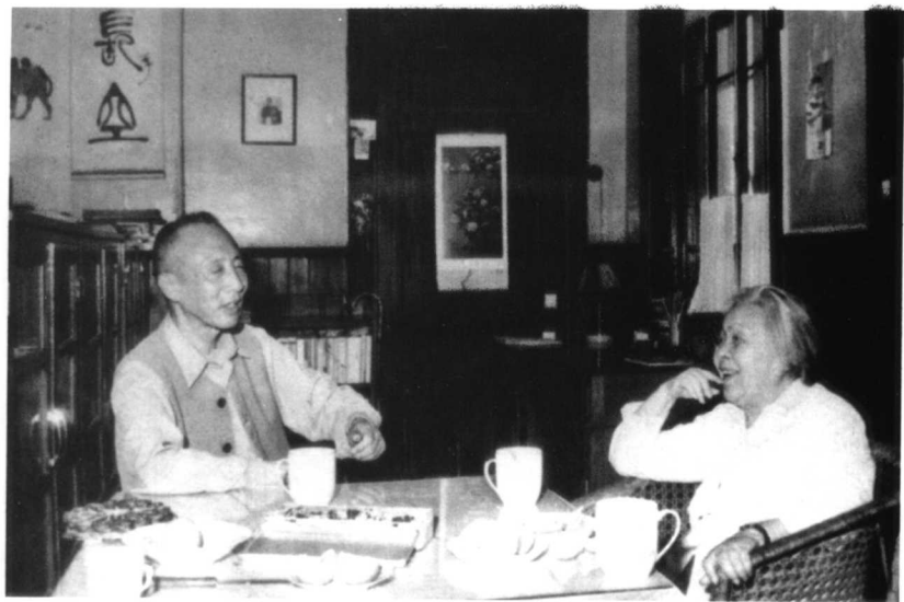
1982年5月，丁玲在天津看望孙犁