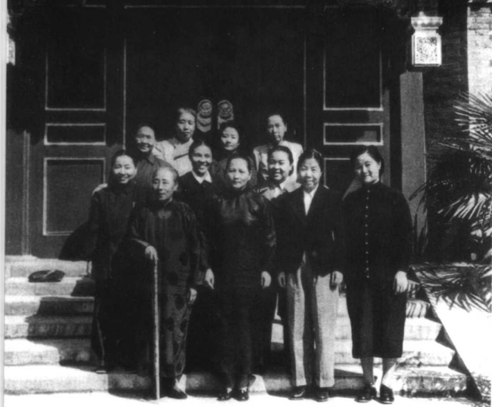
1949年9月，中国人民政治协商会议第一届全体会议部分女代表合影。前排左起：何香凝、宋庆龄、邓颖超、史良；中排左起：罗叔章、蔡畅、丁玲；后排左起：李德全、许广平、张晓梅、曾宪植