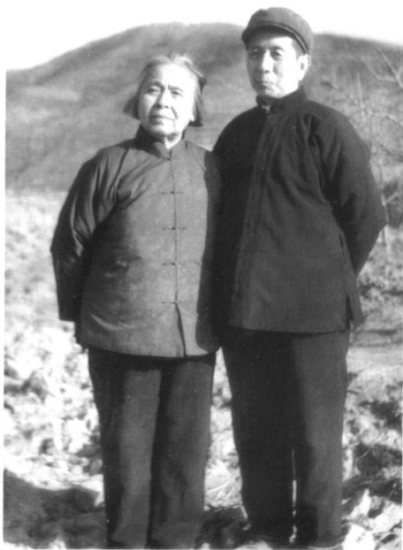
1975年秋，丁玲、陈明在 山西长治漳头村