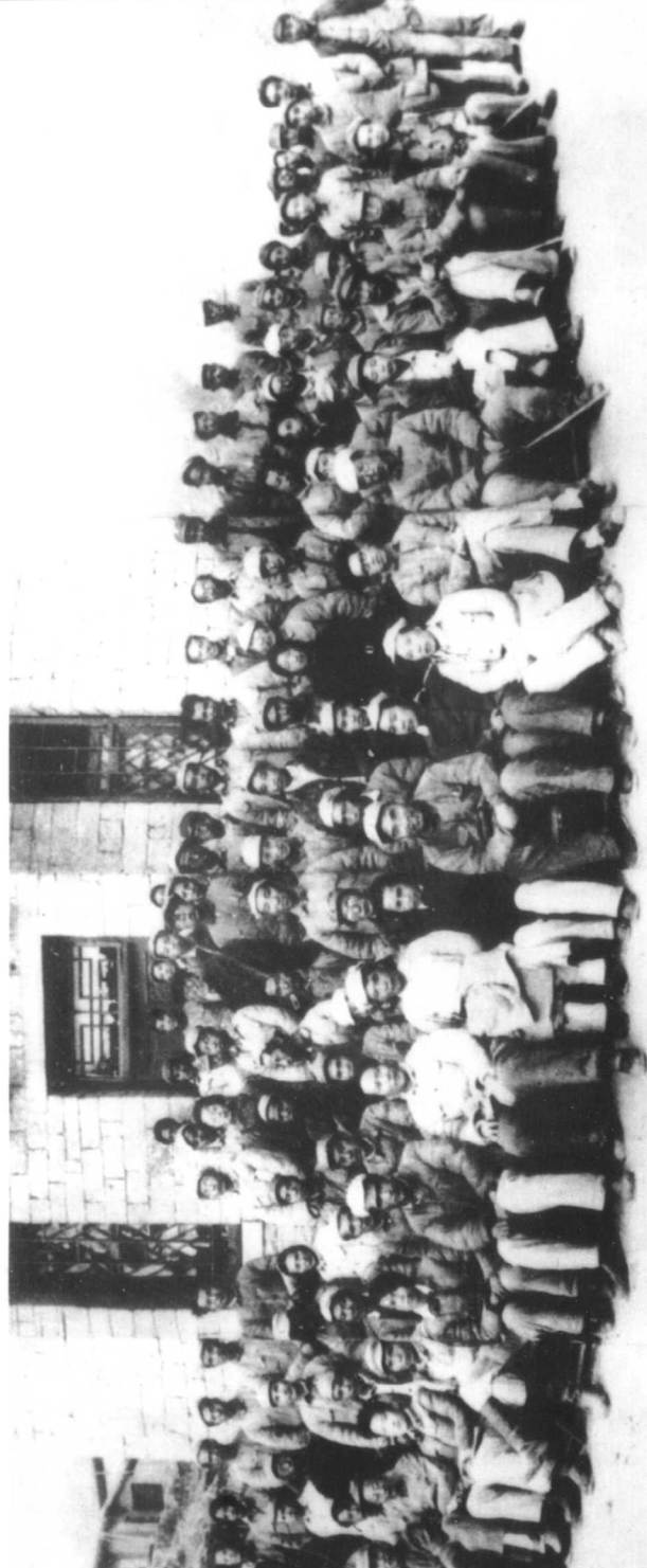
1942年5月延安文艺座谈会合影，毛泽东（前左7），朱德（前左10），丁玲（前左11）