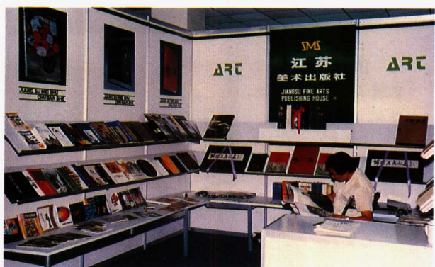
图7 全国第三届书展的展品陈列