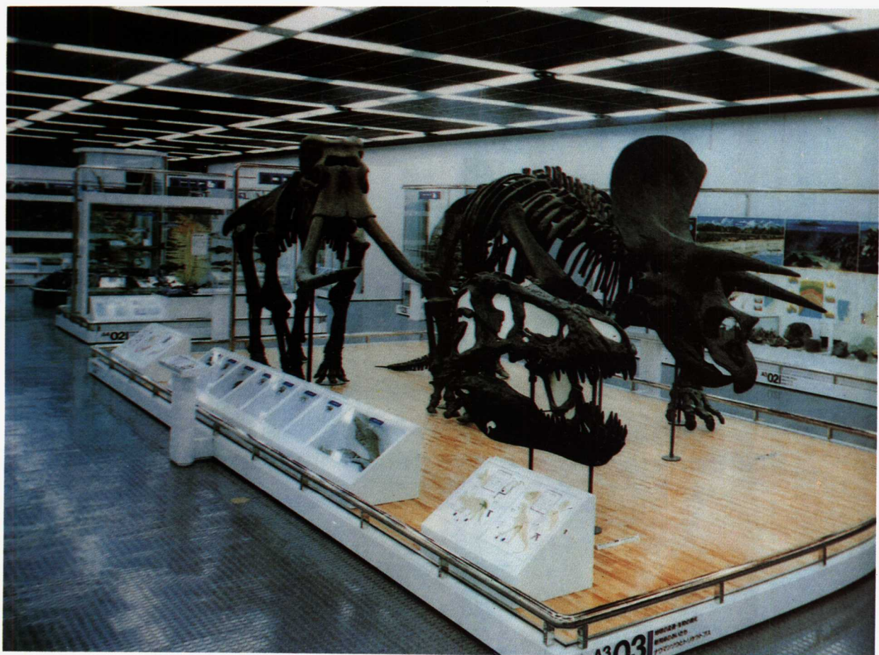
图16 日本新潟县立自然科学馆的自然科学区，在展厅空间中突出了文物：三崎龙及古象骨的展示，使文物占据了空间的统治地位。图表嵌板及复制品介绍呈现进化过程的各种象齿及相关资料，箱子、嵌板皆有一定的规格。