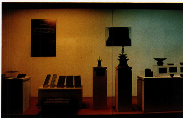
图6 陕西历史博物馆的文物陈列