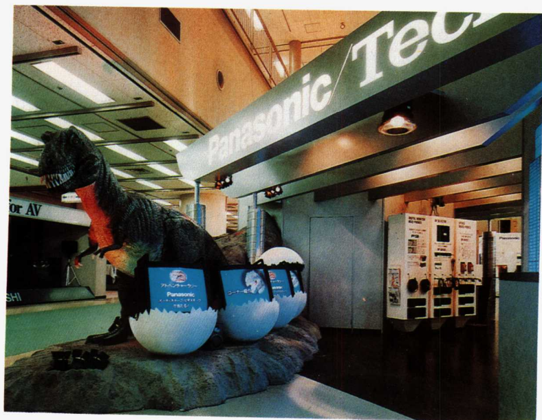
图10、11 松下电力工业有限公司