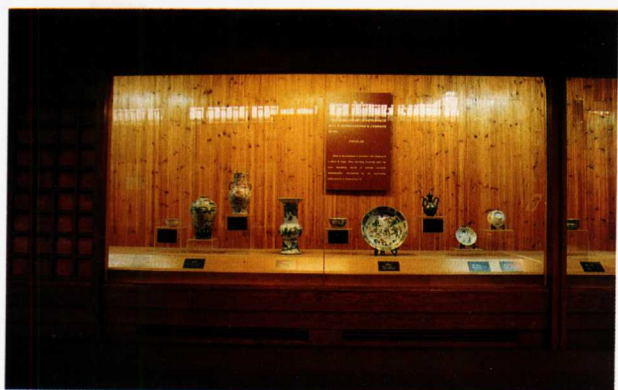
图8 浙江历史博物馆的文物陈列