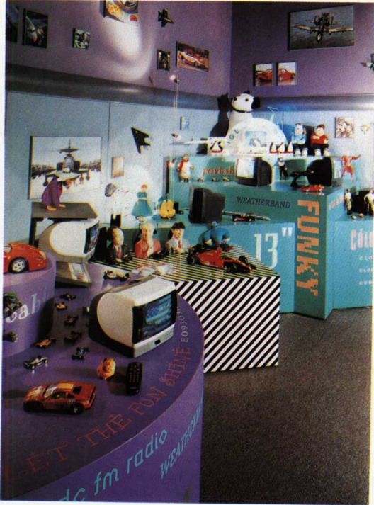
图14 展出者：汤姆森·康休默电子公司