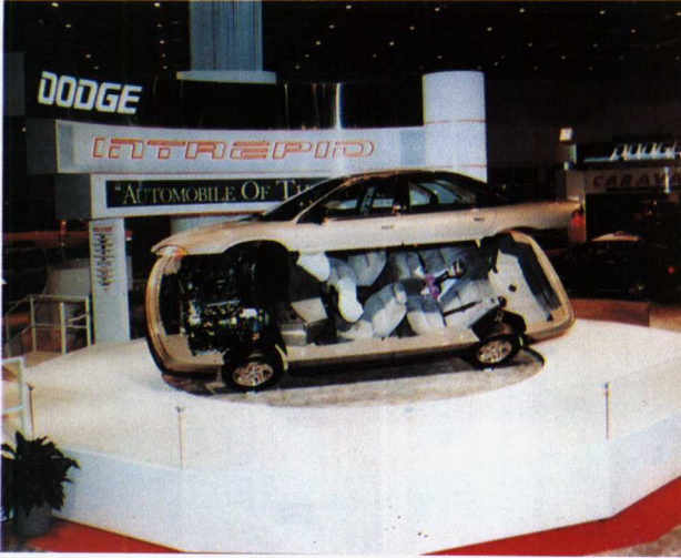
图12 展出者：克莱斯特公司/道奇生产部