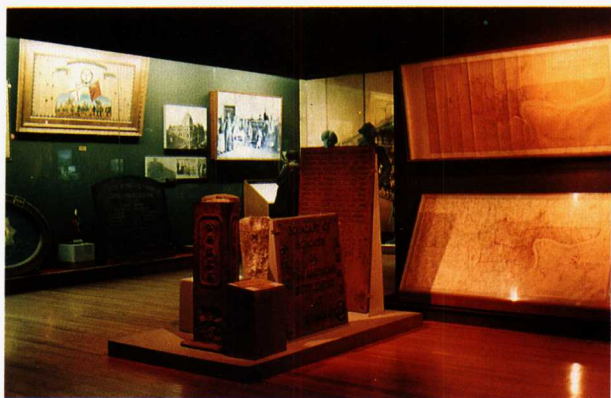
图5 太平天国纪念馆的文物陈列