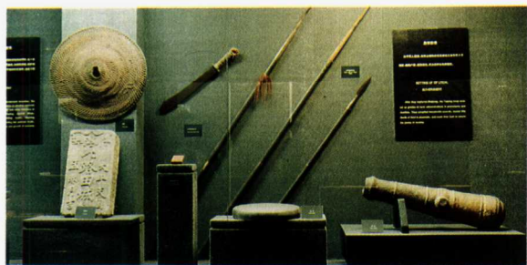
图4 太平天国纪念馆的文物陈列