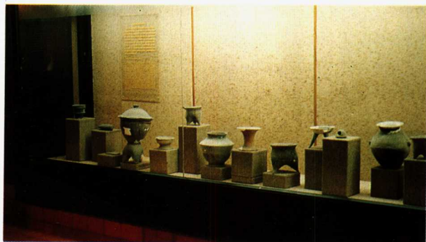
图9 南京博物院文物陈列