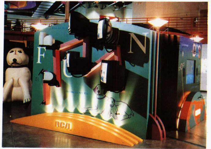
图13 展出者：汤姆森·康休默电子公司