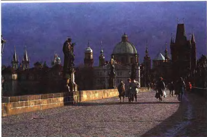
▲ 布拉格市伏尔塔瓦河上的查理大桥