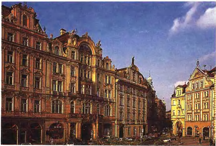
▲ 布拉格市老城区的老城广场，周围耸立着巴罗克式建筑。