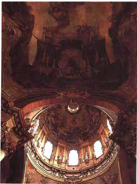
◀ 布拉格市圣尼古拉斯教堂的穹顶。似乎在向天空升腾。上面绘有精美的壁画。