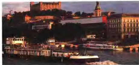
斯洛伐克城市布拉迪斯拉发及其城堡(17~18世纪)