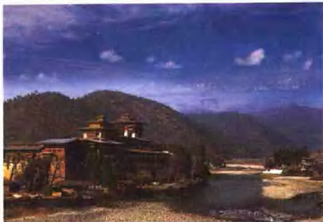
旅游业是不丹外汇的重要来源之一。1997年旅游业收入为684.5万美元。(图为不丹河谷的喇嘛寺院)

历史 17世纪。被西藏人占领的不丹建立起神权政治王国。喇嘛教为国家宗教。自1865年起英国强迫不丹对外关系受英国“指导”。1949年成为印度的半保护国。1971年不丹独立。