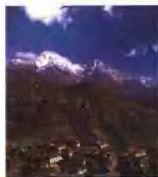
不丹的气候：北部山区气候寒冷。中部河谷较温和。南部丘陵平原属湿润的亚热带气候。(图为西部的河谷农田)