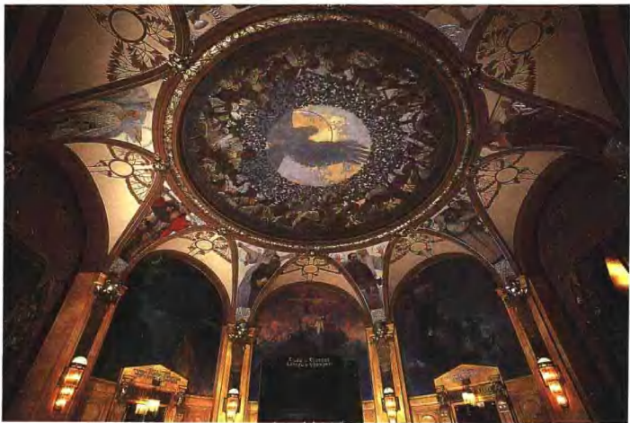
▲ 布拉格老市政厅中的穆哈厅，其中的壁画由捷克著名画家穆哈绘制。