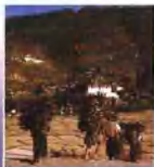
背木材回家的一家