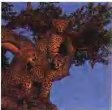
W区国家公园内的猎豹