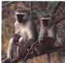
W区国家公园内的非洲白眉猴