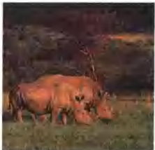
W区国家公园内的犀牛