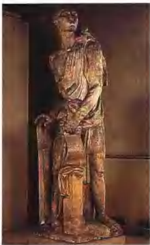
法国雕刻家布代尔创作的雕像《雄辩》