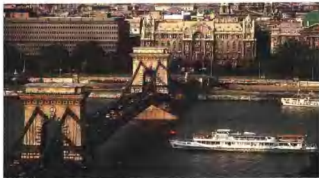
匈牙利布达佩斯的多瑙河大桥

凡有正常性生活,未避孕,同居二年未能受孕者。婚后从未妊娠者称原发性不孕症;有过妊娠后又连续三年不孕者称继发性不孕症。主要原因有女方子宫发育不良、输卵管阻塞和排卵障碍;男方精子生成障碍和输精管不通及性交障碍等。