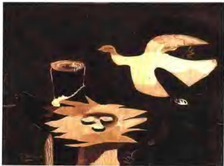
法国画家布拉克的画作《鸟儿和巢》(1956)

(1921—1981)法国词作家、作曲家和翻译家。他向观众奉献以反习俗为特征的歌曲。二次世界大战之后,他作为一名令人敬佩的