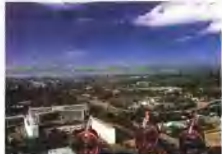
首都瓦加杜古市景