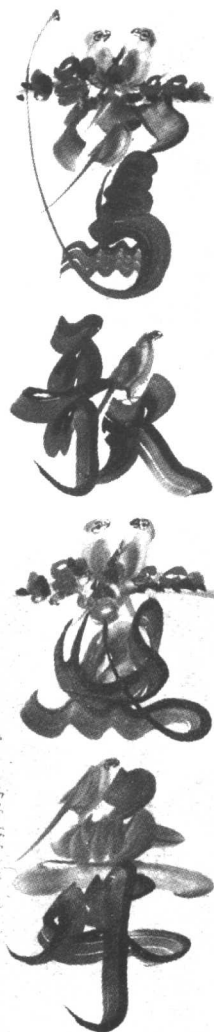
盘龙卧虎 莺歌燕舞