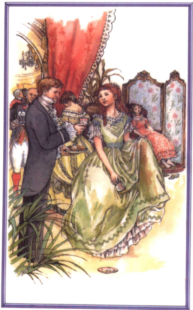
乔在舞会上把咖啡溅到了自己的裙子上 （参见第三章）