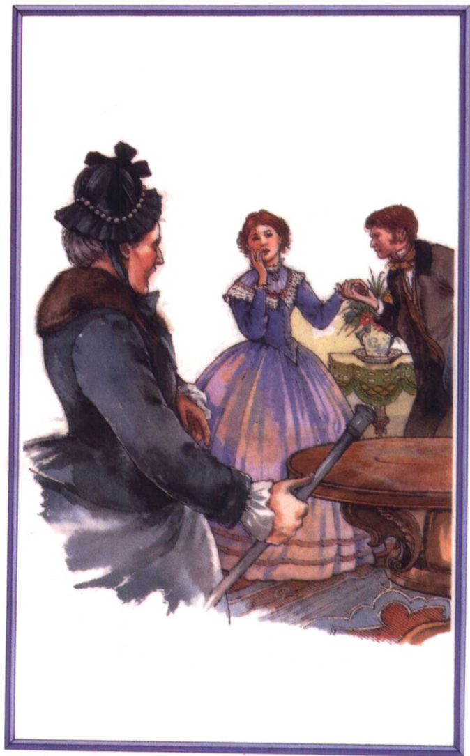
马奇姑婆发现梅格和约翰·布鲁克在一起 (参见第十二章)