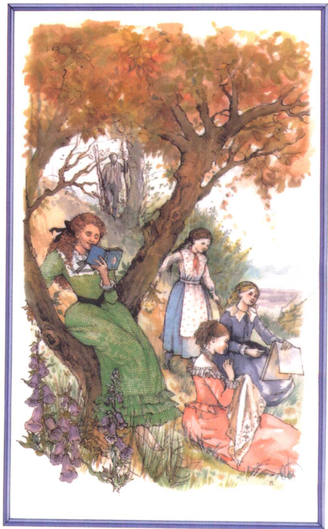
劳里发现姑娘们坐在树丛下（参见第六章）