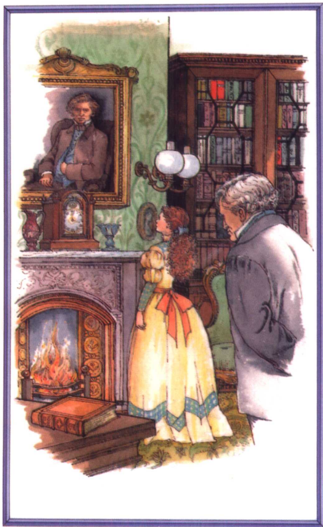
劳伦斯先生听见乔在评论他的相片（参见第四章）