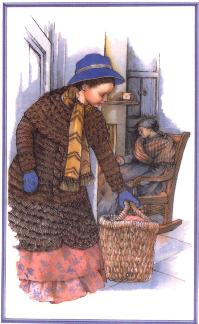
贝思把好东西塞满了篮子准备送给赫梅尔一家 （参见第八章）