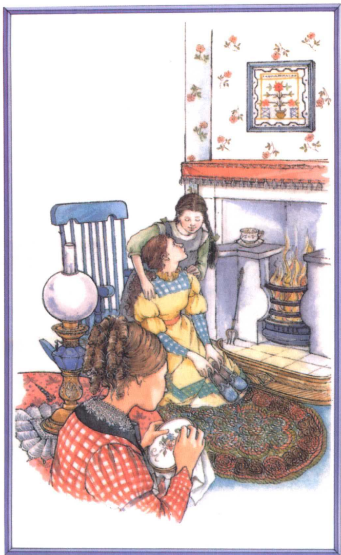
乔和贝思在炉火前为母亲把鞋子烤暖和（参见第一章）