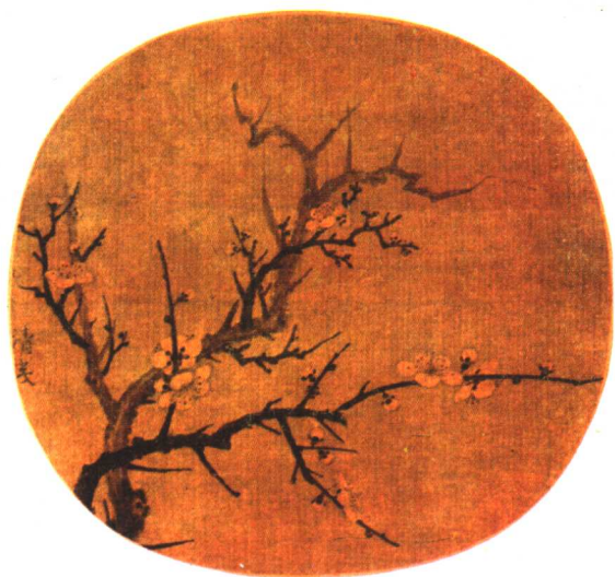
► 墨梅图 宋·杨无咎