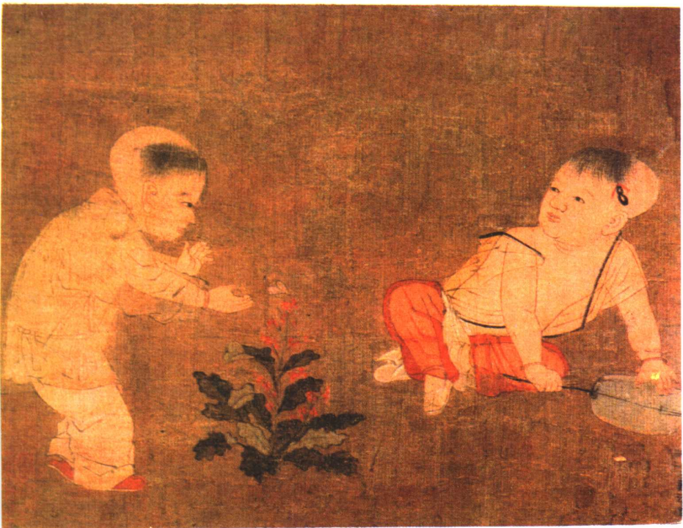
► 婴戏图 宋·苏汉臣