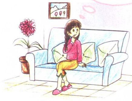
图 1-1 假期心情

仅仅经历了短短一个学期的中学生活，为什么离开学校一段时间后，我们会如此地想念同学、老师，想念学校呢？在假期里，为什么我们有时会感到孤独和寂寞呢？回到学校，回到我们的班级中，我们又感到安心、开心、愉快了呢？