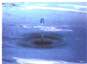
图 1-8 一滴水与大海

一滴水的寿命是短暂的，但当它与浩瀚的大海融为一体时，就获得了新生命。大海永远不会干涸，一滴水永存于大海之中。