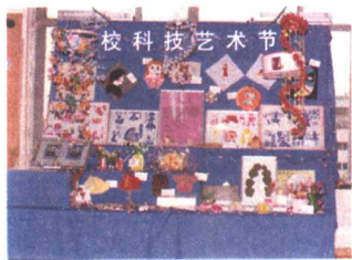
图 1-7 学生手工艺作品

根据同学们的兴趣、爱好和特长，学校组织开展了体育、文学艺术、书法绘画、摄影等多种多样的课外活动。这些活动为我们学习兴趣的培养、个性特长的发挥，提供了极好的机会。