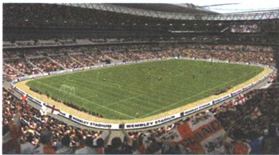
图 1-10 绿茵场上的集体