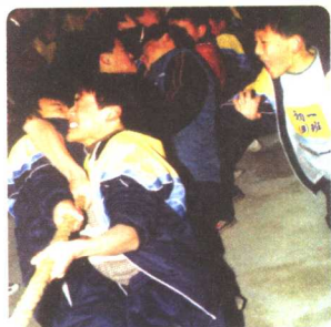
图 1-5 三班! 加油!

我们已经在班级和学校这个大家庭中共同生活了一个学期。在这里，有温馨、有关爱、有快乐，也有矛盾和烦恼。我们一起学习，共同进步，分享收获的喜悦；我们共同生活，相互鼓励，共享成功的快乐。我们热爱我们共同的家。