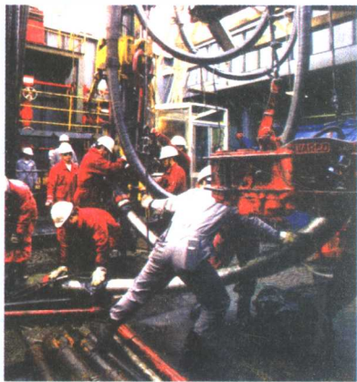
图 1-9 劳动中的集体