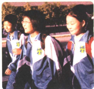
图 1-4 我们来自和睦中学