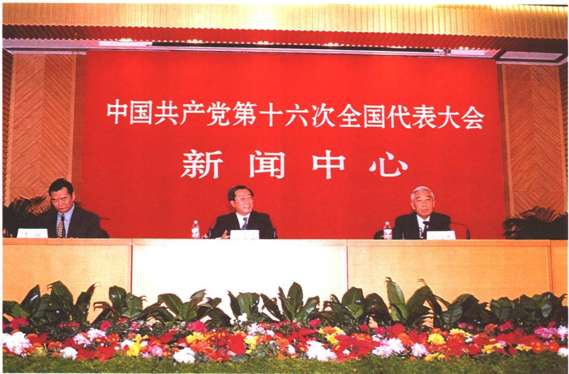
2002年11月11日，中国共产党第十六次全国代表大会新闻中心举行第二次记者招待会，劳动保障部部长张左己、中华全国总工会副主席张俊九应邀出席介绍我国劳动和社会保障情况，并回答中外记者的提问。