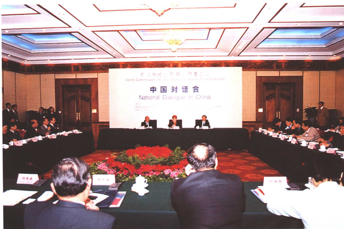
2002年11月26日，劳动保障部部长张左己与来北京进行国事访问的芬兰总统哈洛宁进行会谈，并共同出席国际劳工组织全球化社会影响世界委员会中国对话会，发表演讲。