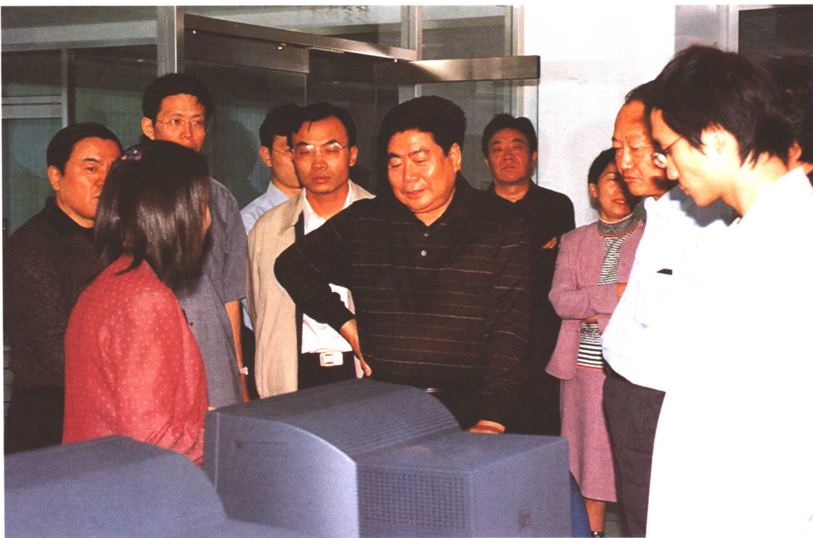
2002年8月19日，劳动保障部副部长王东进考察辽宁省鞍山市医疗保险基金管理中心。