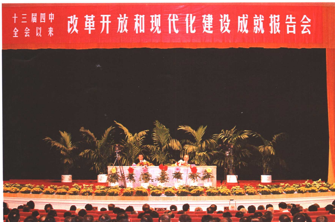
2002年9月27日，中共中央宣传部、中直机关工委、中央国家机关工委、解放军总政治部、中共北京市委在人民大会堂联合举办“十三届四中全会以来改革开放和现代化建设成就报告会”，劳动保障部部长张左己在会上作报告，全面系统介绍了我国就业和社会保障改革取得的历史性成就。