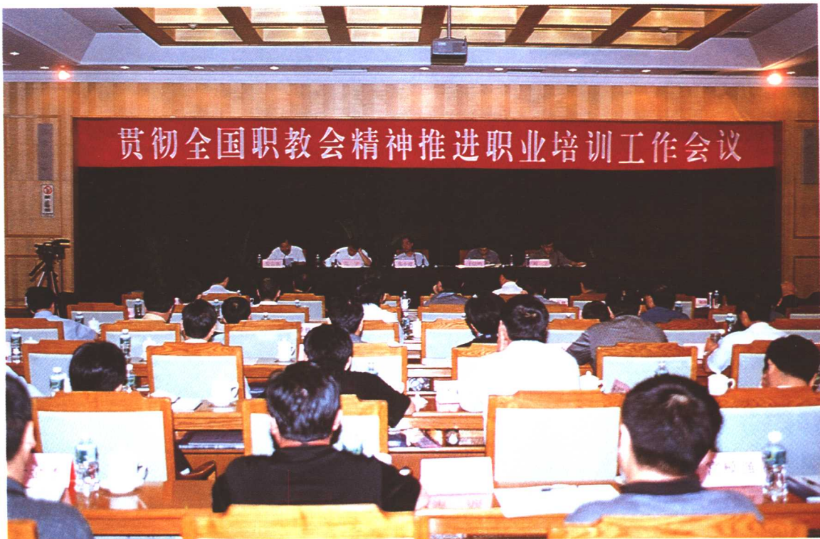
2002年7月30日至31日，劳动保障部在北京召开贯彻全国职教会精神推进职业培训工作会议，劳动保障部副部长张小建出席会议并讲话。