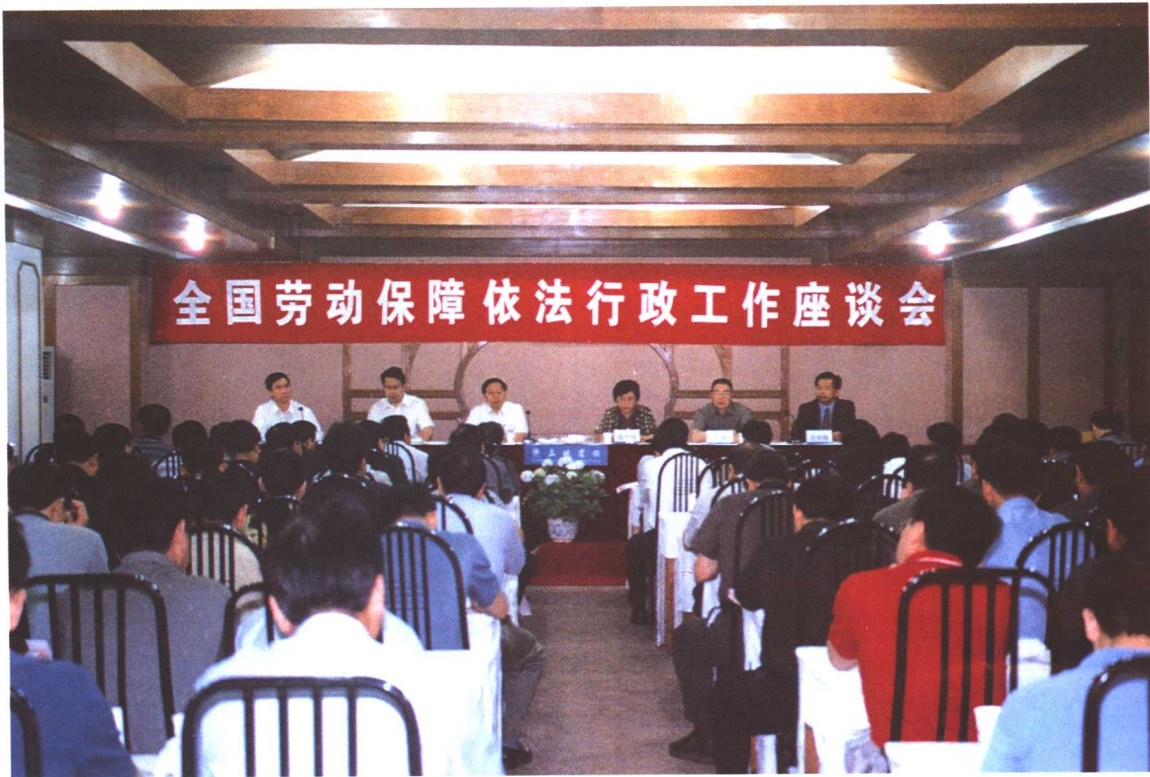
2002年5月28日至31日，全国劳动保障依法行政工作座谈会在湖北省宜昌市召开，劳动保障部副部长步正发出席会议并讲话。