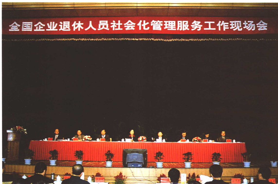
2002年11月4日，全国企业退休人员社会化管理服务工作现场会在广西壮族自治区南宁市召开，劳动保障部副部长刘永富出席会议并讲话。