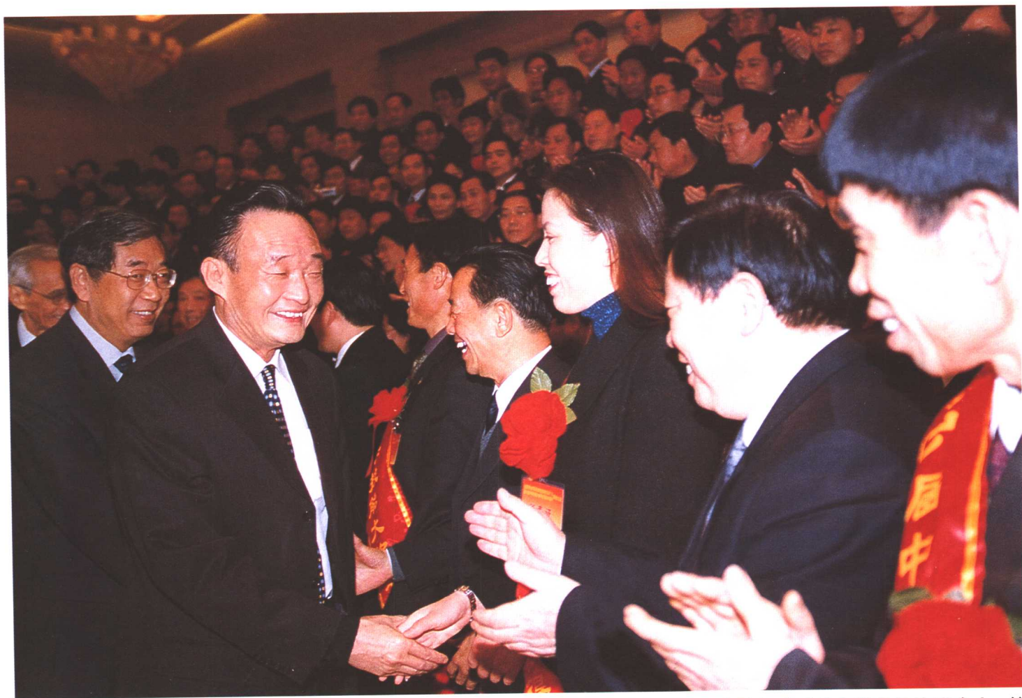
2002年12月12日，中共中央政治局常委、国务院副总理吴邦国接见出席全国劳动保障系统先进集体先进个人、第六届中华技能大奖和全国技术能手表彰大会的代表并发表重要讲话。全国人大副委员长许嘉璐、全国政协副主席经叔平参加了接见活动。