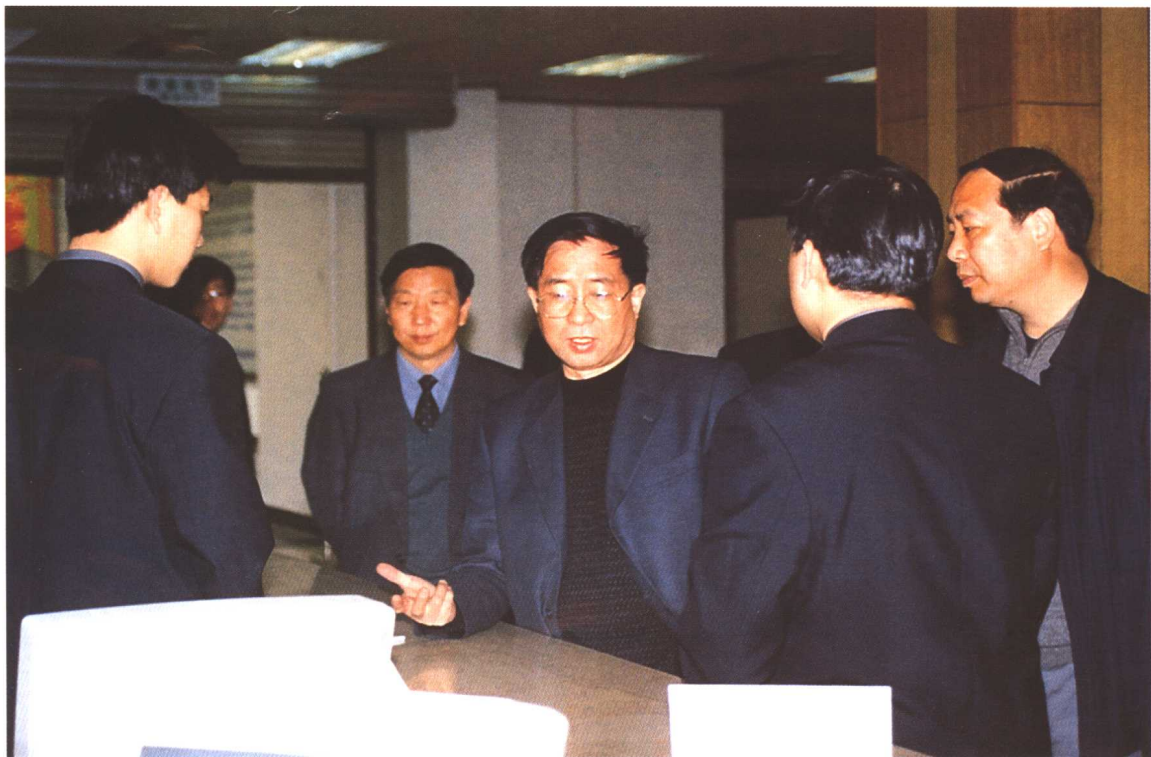
2002年4月12日，劳动保障部副部长张小建在天津市调研再就业工作。