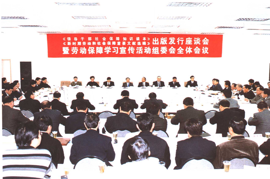
2002年3月2日，劳动保障部召开《领导干部社会保障知识读本》《新时期劳动和社会保障重要文献选编》出版发行座谈会暨劳动保障学习宣传活动组委会全体会议。