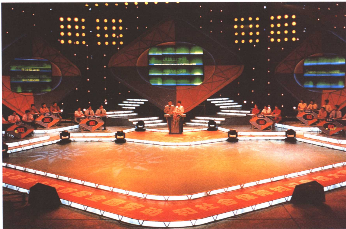
2002年7月16日，全国首届劳动和社会保障知识电视大奖赛总决赛在京举行。劳动保障部部长张左己，副部长李其炎、王东进、步正发、张小建、刘永富，纪检组组长崔会烈和人民日报社、财政部、广电总局、中华全国总工会及天津环球磁卡集团公司的领导和嘉宾出席并为获奖选手颁奖。