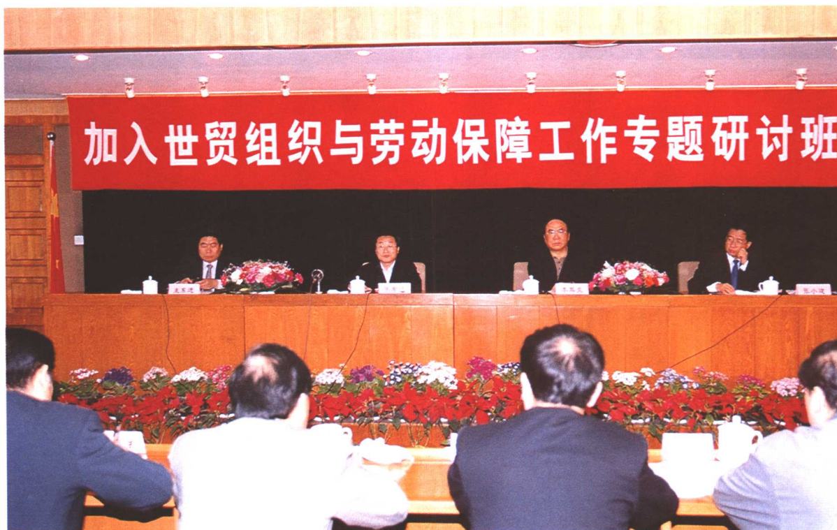
2002年4月16日，劳动保障部部长张左己，副部长李其炎、王东进、张小建出席“加入世贸组织与劳动保障工作专题研讨班”开班仪式。