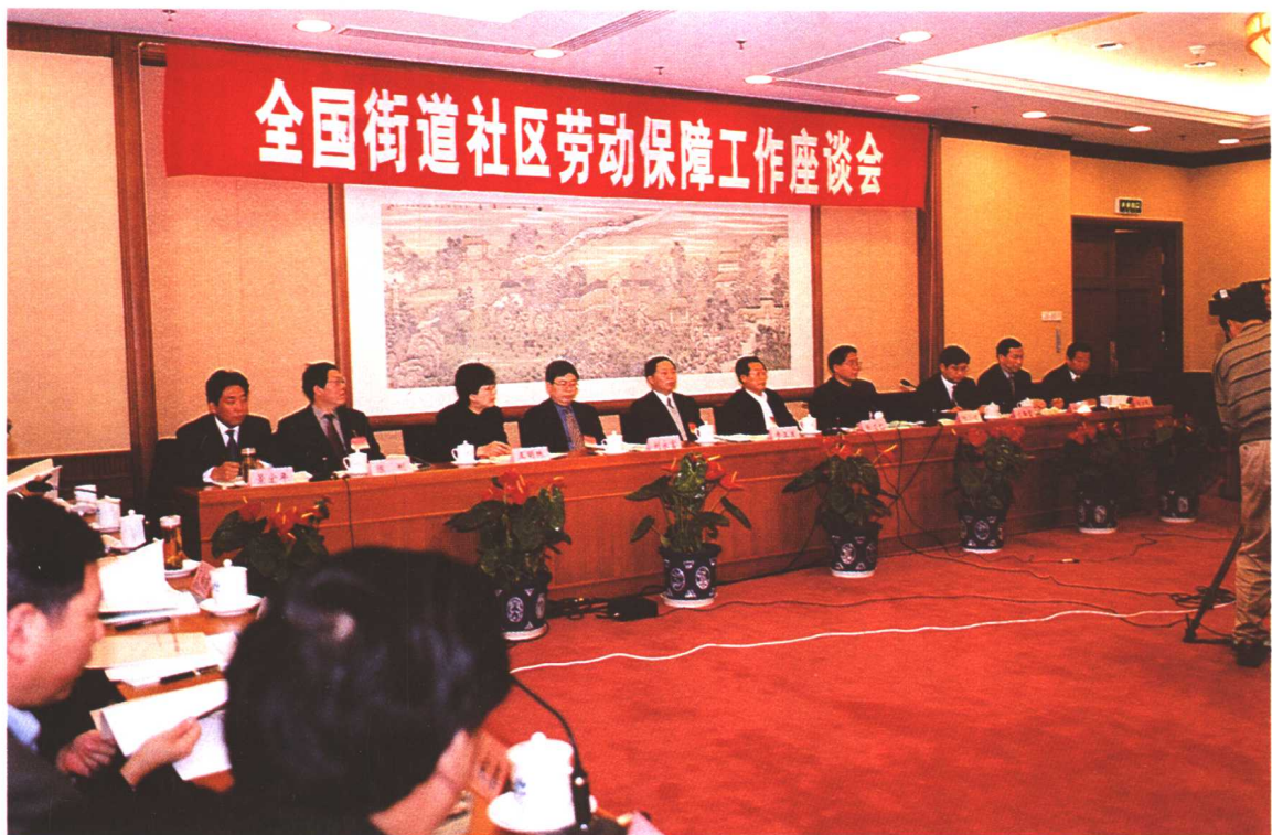
2002年12月13日，全国街道社区劳动保障工作座谈会在京召开，劳动保障部部长张左己，副部长步正发、张小建、刘永富等出席会议。