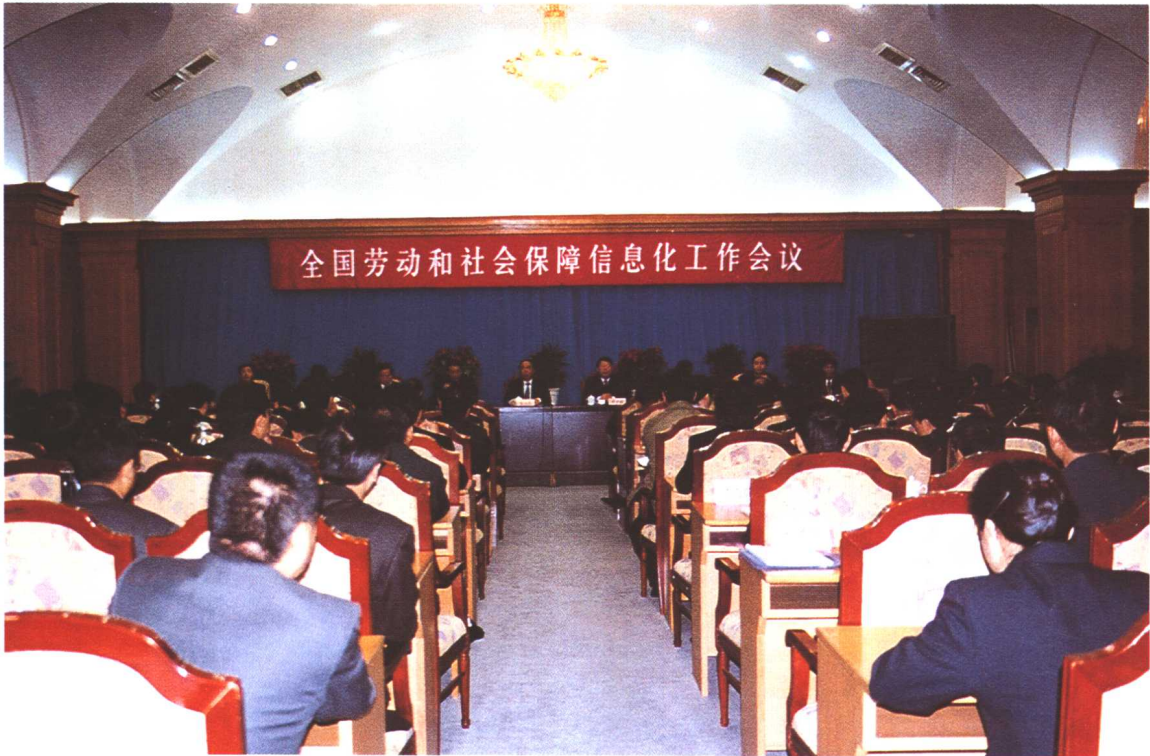
2002年10月30日至31日，劳动保障部在辽宁省沈阳市召开全国劳动保障系统信息化工作会议，研究部署加快全国劳动保障信息系统建设，全面启动“金保工程”。劳动保障部副部长李其炎出席会议并讲话。