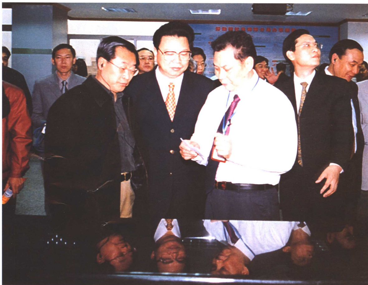
2002年12月25日，劳动保障部部长张左已在广东省南海市进行调研。