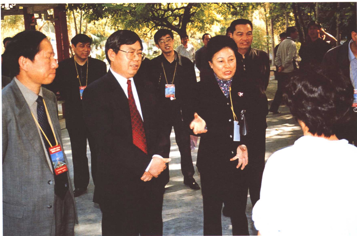
2002年11月5日，劳动保障部副部长刘永富在广西南宁市就企业退休人员社会化管理服务工作进行调研。