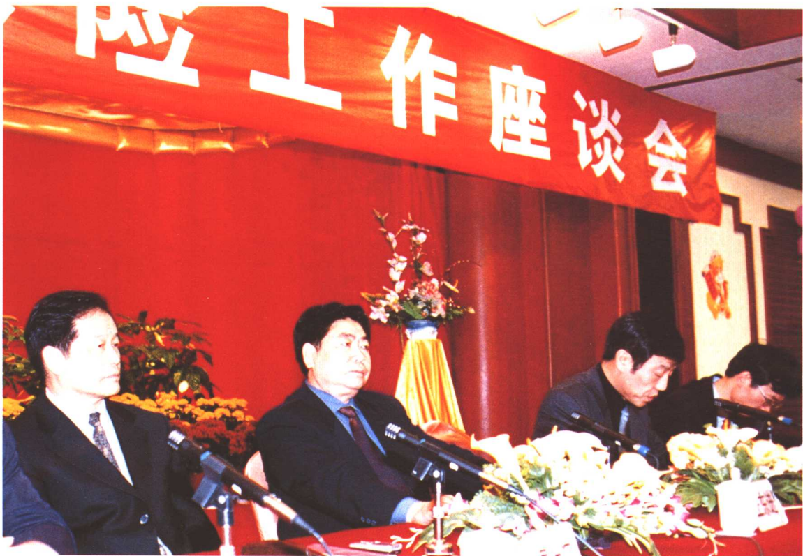
2002年2月28日至3月1日，劳动保障部在广东省中山市召开全国医疗保险工作座谈会，劳动保障部副部长王东进出席会议并讲话。