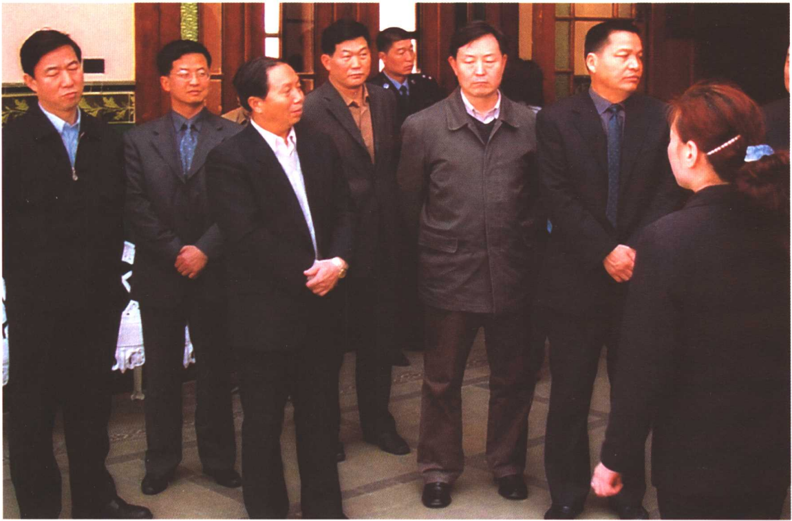
2002年3月27日，劳动保障部副部长步正发在青岛市劳动和社会保障局调研。