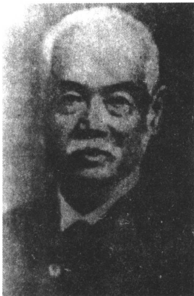
↑ 容闳 (1828—1912)

容闳，中国第一个留学美国的学者，晚清驻美副公使。1828年11月17日他生于广东澳门附近的南屏镇，家境贫困。1835年七岁去澳门入英国人古特拉富夫人的私塾。1846年随美国人勃朗校长去美留学，先在孟松学校求学，后毕业于美国著名的耶鲁大学，获学士学位。按学识和条件，他可以在美国当传教士或从事其他工作，但这位海外赤子拒绝了美国友人的劝告，1854年毅然返国。他先同情和寄希望于太平天国，并向天国领导人洪仁玕