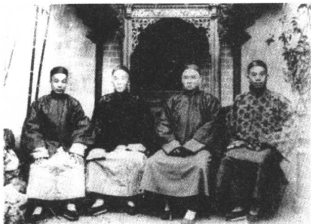
↑ 这是曾为幼童出洋游学做出过不懈努力的容闳与长大后幼童的合影。左起：1 吴其藻、2 杨昌龄、3 容闳、4 吴仰曾。