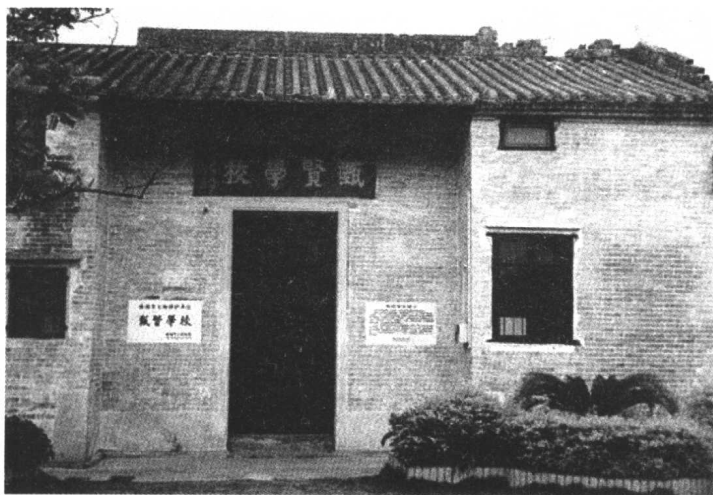
↑ 容闳创立的甄贤学校