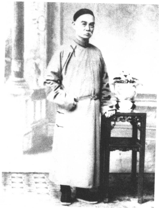
→ 中国驻美副公使容闳