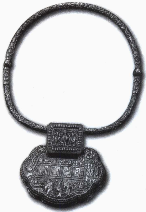
7. 银“玉堂富贵”戏曲人物项圈锁 传世 山西

玉堂富贵是对府第辉煌富贵的赞美。汉代皇宫有“玉堂殿”和“金马门”，均为内廷要地。后世遂以“玉堂”指称翰林院。汉·杨雄《解嘲》：“历金门，上玉堂有日矣。”谓任重职登高位指日可待。“富贵”出自《论语·颜渊》：“商闻之矣：死生有命，富贵在天。”言富裕而显贵。通常由玉兰、海棠与牡丹组成，借玉兰的“玉”字相同，棠与“堂”谐音，牡丹则是富贵的象征。古人常喜欢把玉兰、海棠与牡丹同植一庭，即取“玉堂富贵”之意。