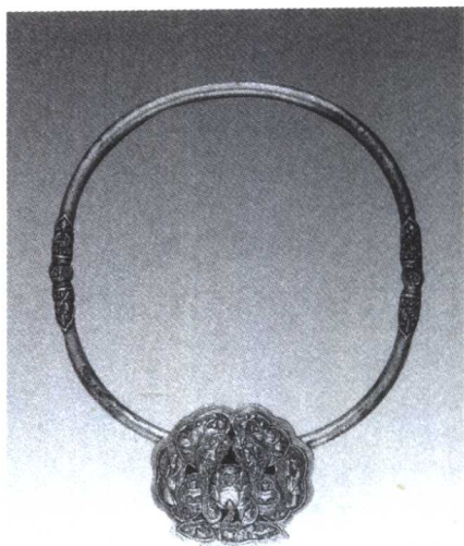
2. 银花鸟人物项圈锁 传世 山西

涵盖的一个方面，在本文中我们所讨论的是广义的护身符概念，举凡具有警示意义，或隐含特定吉祥寓意的事物都具有护符的性质。当人们使用它作为驱妖辟邪的灵符时，它就成为护身符了；并旨在从一个新的角度来追寻民俗文化发展的脉络，从侧面了解一定历史时期的民风民俗，探究人类精神世界的另一面。