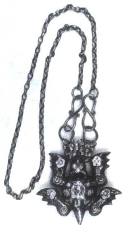
4. 银龟形坠挂链 传世 山西介休

先民们在洪荒初辟的年代，为了寻求自身的生存与繁衍，同自然万物做着殊死的斗争。在生产力低下的史前阶段，不可避免地要遇到无力抗拒的自然现象以及人生的种种灾难。不仅如此，更可怕的是来自于人们精神世界深