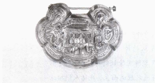
5. 戏曲人物银锁 清代 山西运城