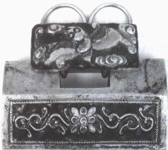
6. 银烧蓝蝙蝠纹长命锁 传世 北京