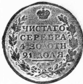
13 俄國 1811年 銀質 20.2克