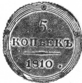
12 俄國 1810年 銅質 51.5克