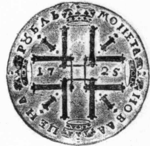
3 俄國 1725年 銀質 28.6克