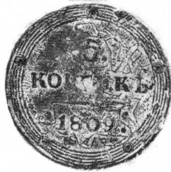
11 俄國 1809年 銅質 56.0克