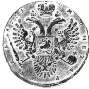
5 俄國 1731年 銀質 25.8克