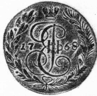
7 俄國 1768年 銅質 43.0克