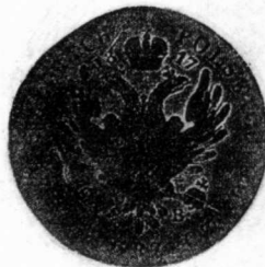
15 俄國 1817年 銀質 15.2克