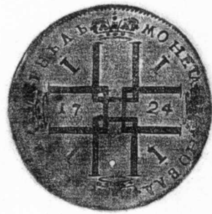
2 俄國 1724年 銀質 13.8克