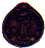
波斯薩珊王朝巴赫蘭六世