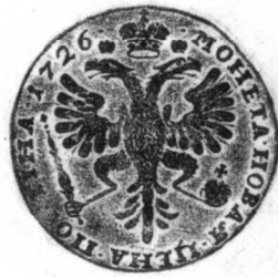
4 俄國 1726年 銀質 14.4克