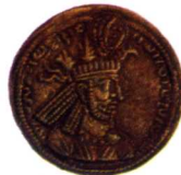
波斯薩珊王朝納賽