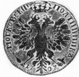
1 俄國 1707年 銀質 27.4克