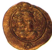
波斯薩珊王朝卡瓦得一世