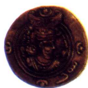
波斯薩珊王朝庫思羅二世