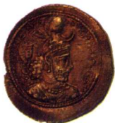
波斯薩珊王朝耶澤提格一世