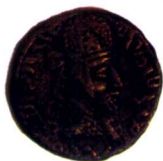
波斯薩珊王朝阿塔希爾一世