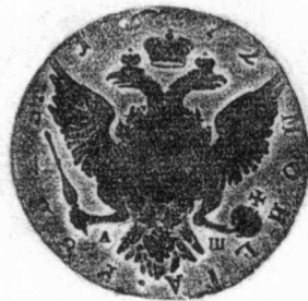
8 俄國 1772年 銀質 23.2克