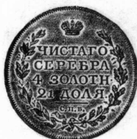
14 俄國 1817年 銀質 20.6克