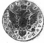
10 俄國 1791年 銀質 5.9克