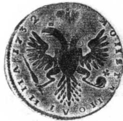
6 俄國 1732年 銀質 12.0克