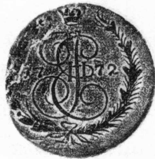
9 俄國 1772年 銅質 44.8克