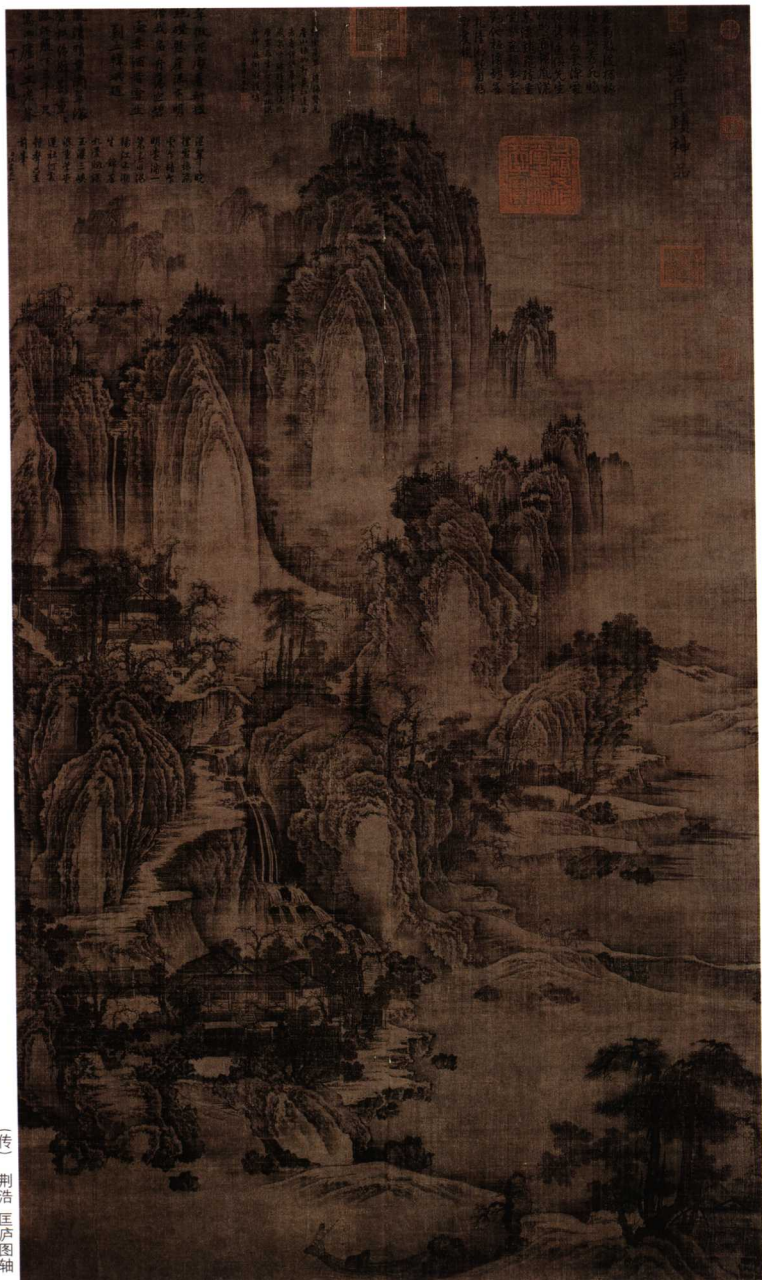
(传) 荆浩 匡庐图轴