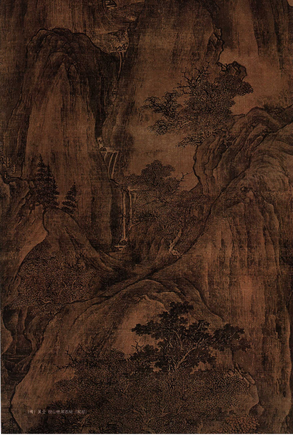
(传) 关仝 秋山晚翠图轴 (局部)