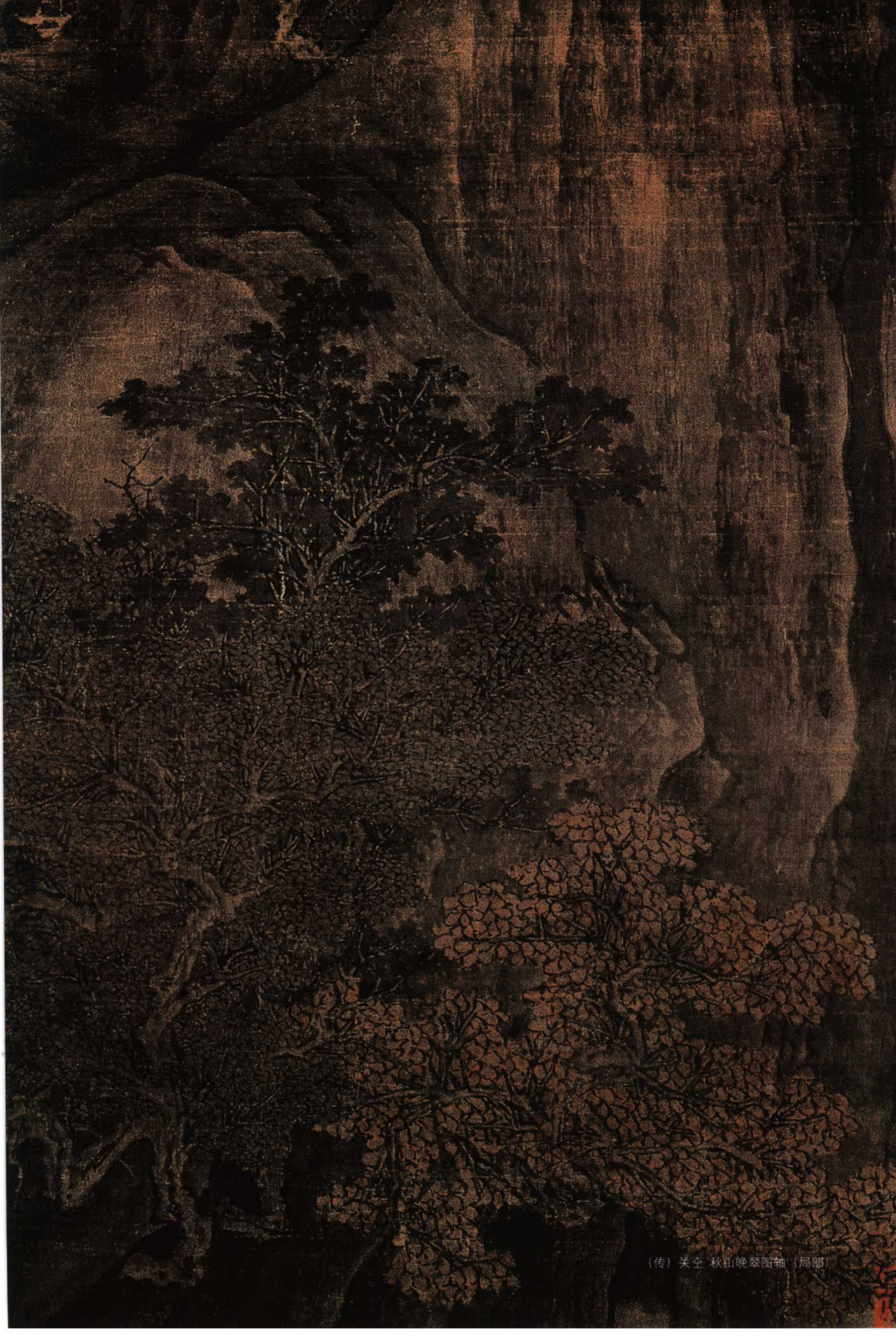
(传)关仝 秋山晚翠图轴(局部)