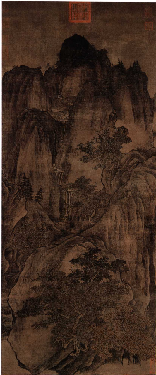
(传) 关全秋山晚翠图轴