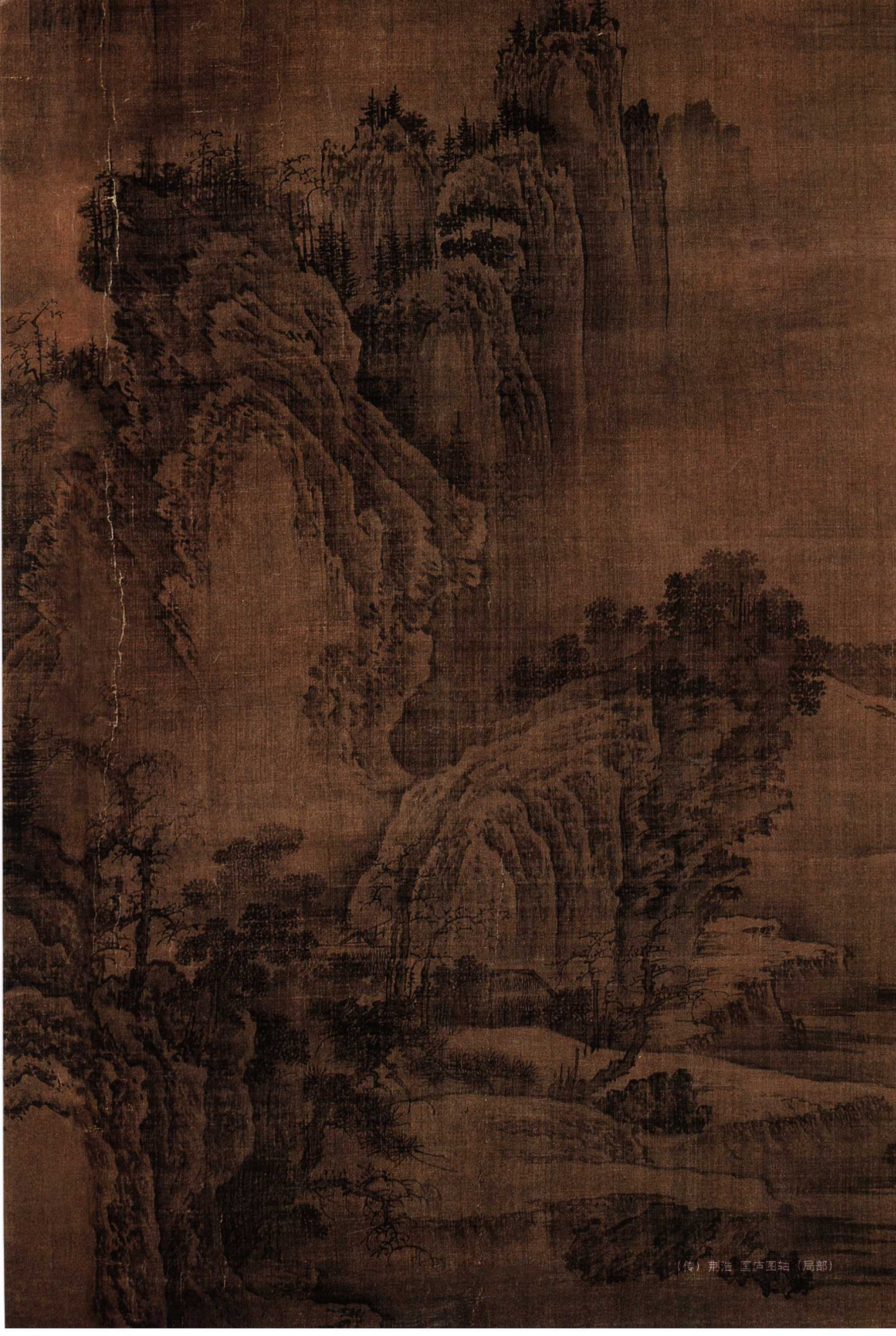
(传) 荆浩 匡庐图轴 (局部)