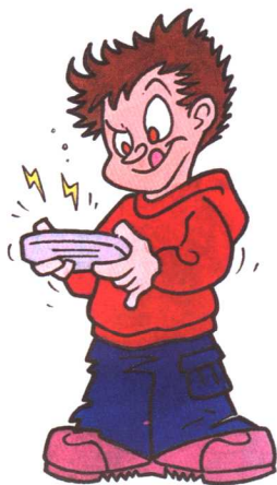
图 1-4 学龄儿童