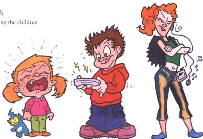
Fig 1-1 Introducing the children