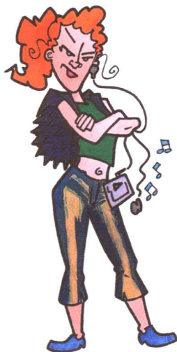
图 1-6 十几岁的青少年 Fig 1-6 Teenager

Behaviour-management techniques are appropriate for cooperative and potentially