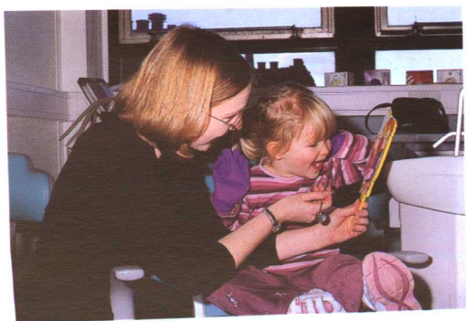
图 1-3 吸引学龄前儿童的想像力 Fig 1-3 Capture the pre-school child's imagination

By the age of four, children are becoming more self-determining and begin to try to impose their will. They are able to interact in small groups and start to develop independent skills. It may be possible for the dental nurse to engage the child while you speak to the parent. Four-year-old children understand how to use “Thank you” and “Please”. They often express their independence by rejecting previously established patterns of behaviour. For example, they