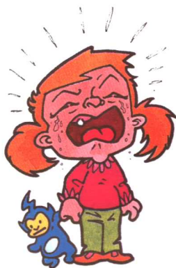
图 1-2 学龄前儿童