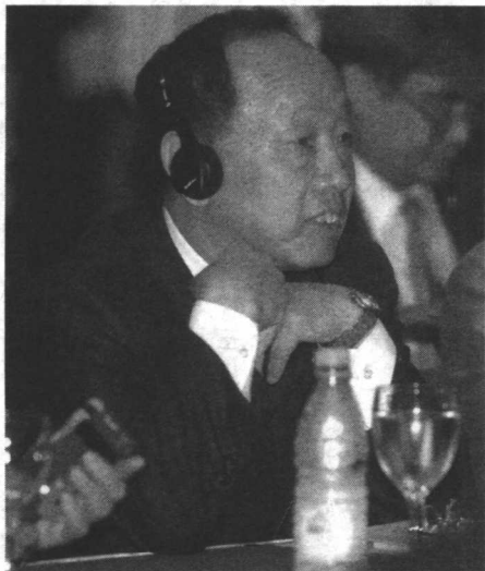
李肇星出席东南亚国家联盟与中国、日本、韩国（10+3）外长会议并发言

2005年4月15日上午，位于北京朝阳门外的外交部迎来了自2003年以来的第三个公众开放日，这也是外交部公众开放日制度化后第一次敞开大门，迎接160余位来自全国20个省、市、自治区的普通民众的参观。