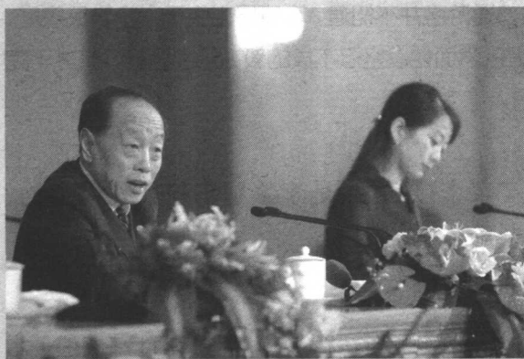
外交部长李肇星回答 中外记者提问

李肇星，资深外交家。1940年10月出生于山东胶南，1964年毕业于北京大学西语系。历任外交部新闻司副处长，驻莱索托大使馆一秘，外交部新闻司副司长，外交部司长、发言人，外交部部长助理，常驻联合国代表，外交部副部长，驻美国大使，外交部常务副部长等职。2003年3月起，任外交部部长。系十五届中央候补委员，十六届中央委员。