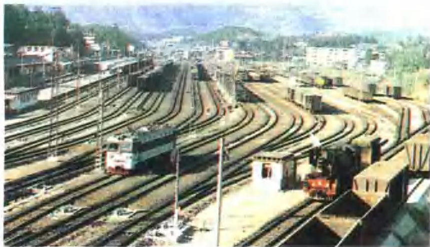
铁路交通枢纽——漳平火车站