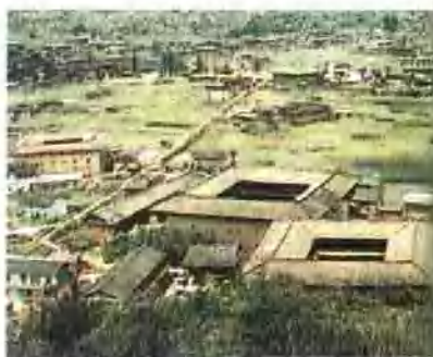
龙岩适中方形土楼群