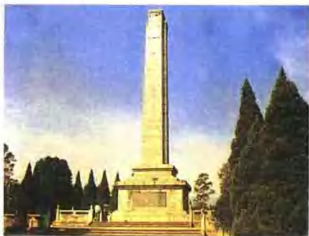
闽西革命烈士纪念碑