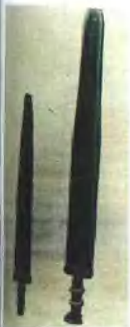
武平出土的东周时期 青铜剑