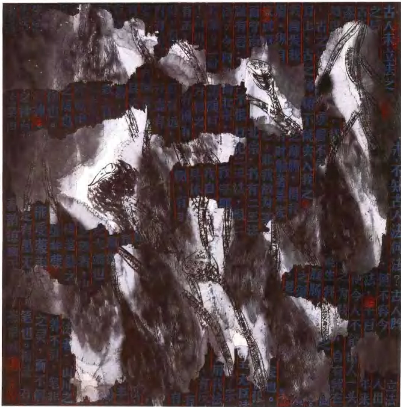
啾 66 × 66cm 纸本 1993