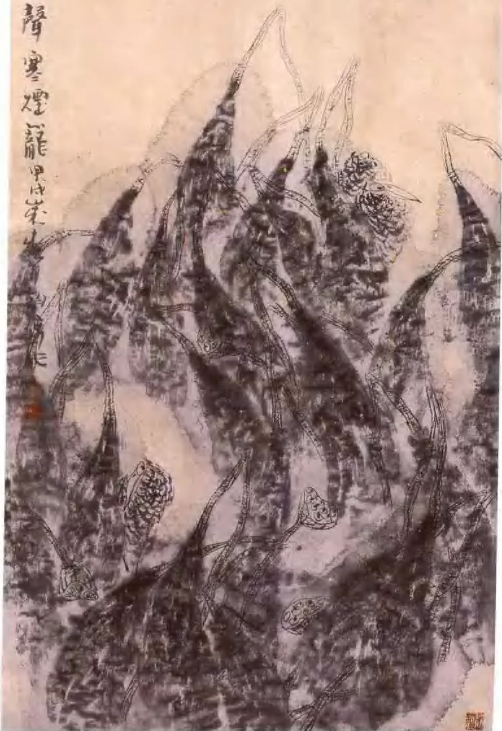
野雀 纸本 66 × 132cm 1994