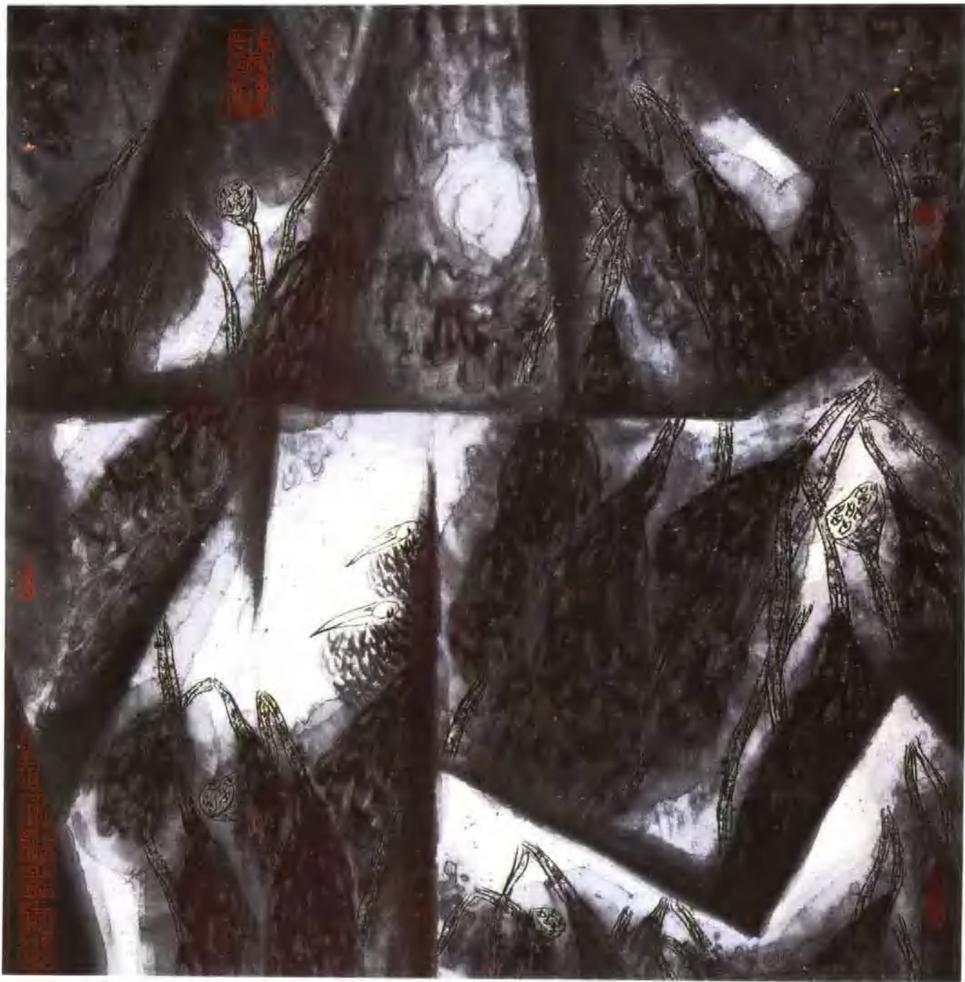
浑茫 66 × 66cm 纸本 1993