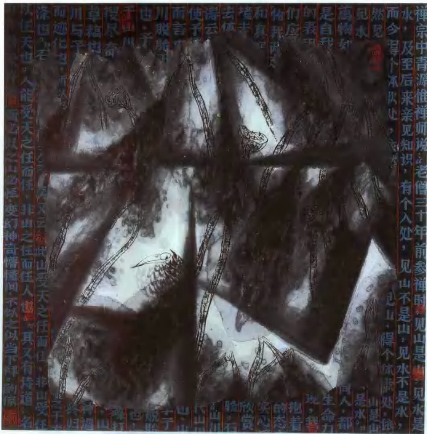
懵懂 66 × 66cm 纸本 1993