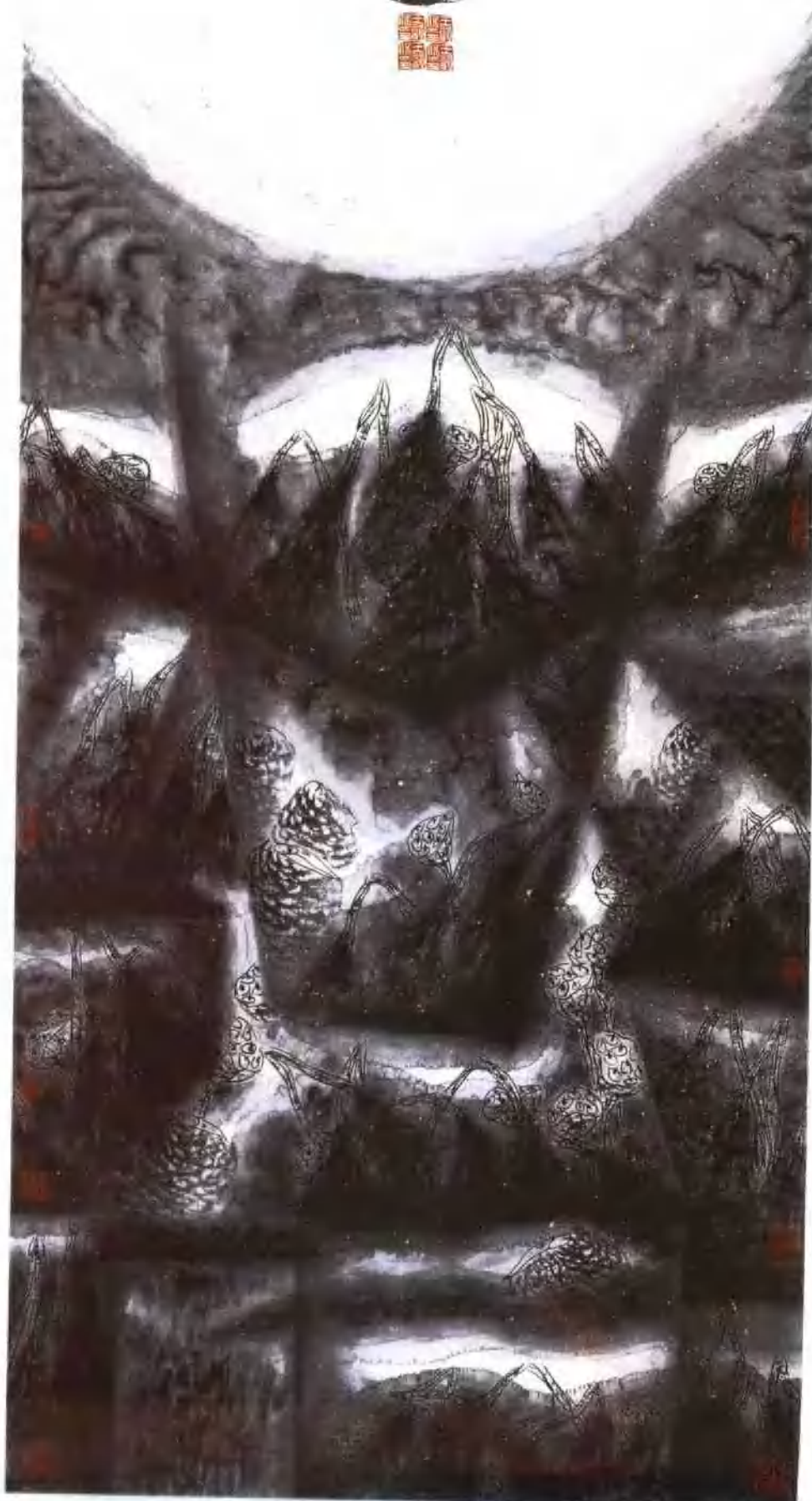
叶幻 纸本 66 × 132cm 1994