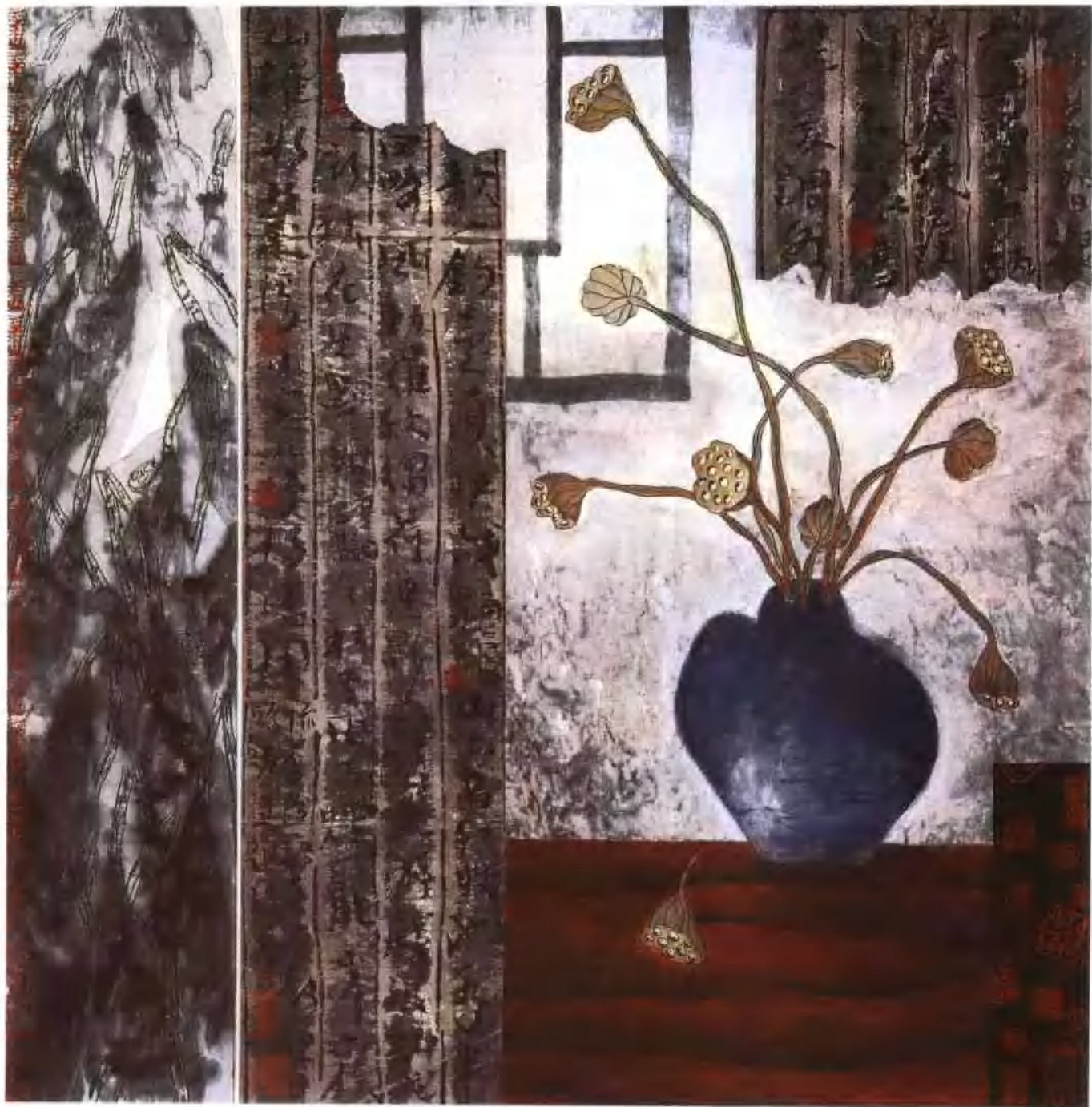
香露 66 × 66cm 纸本 1993