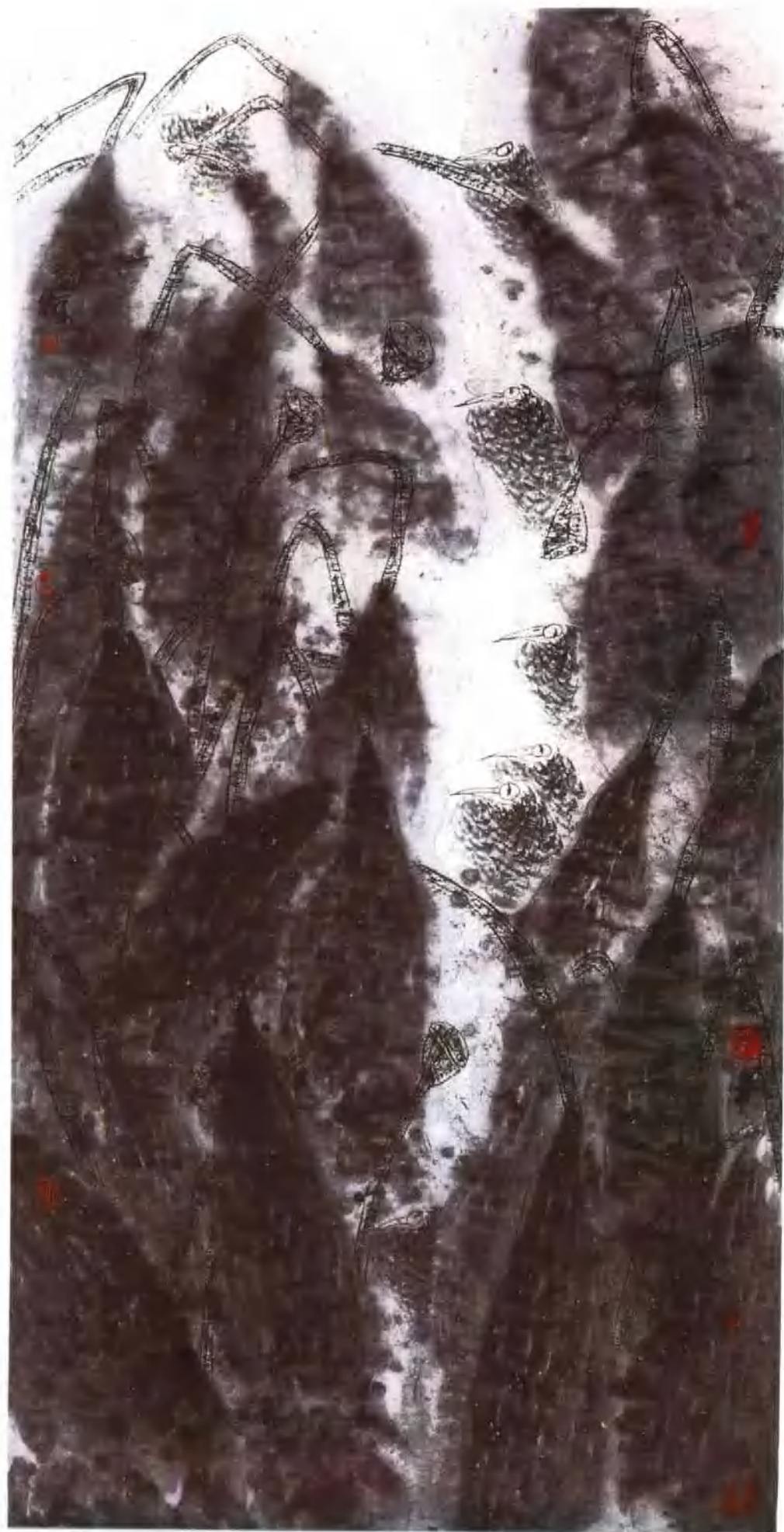
雨过秋塘 纸本 66 × 132cm 1992