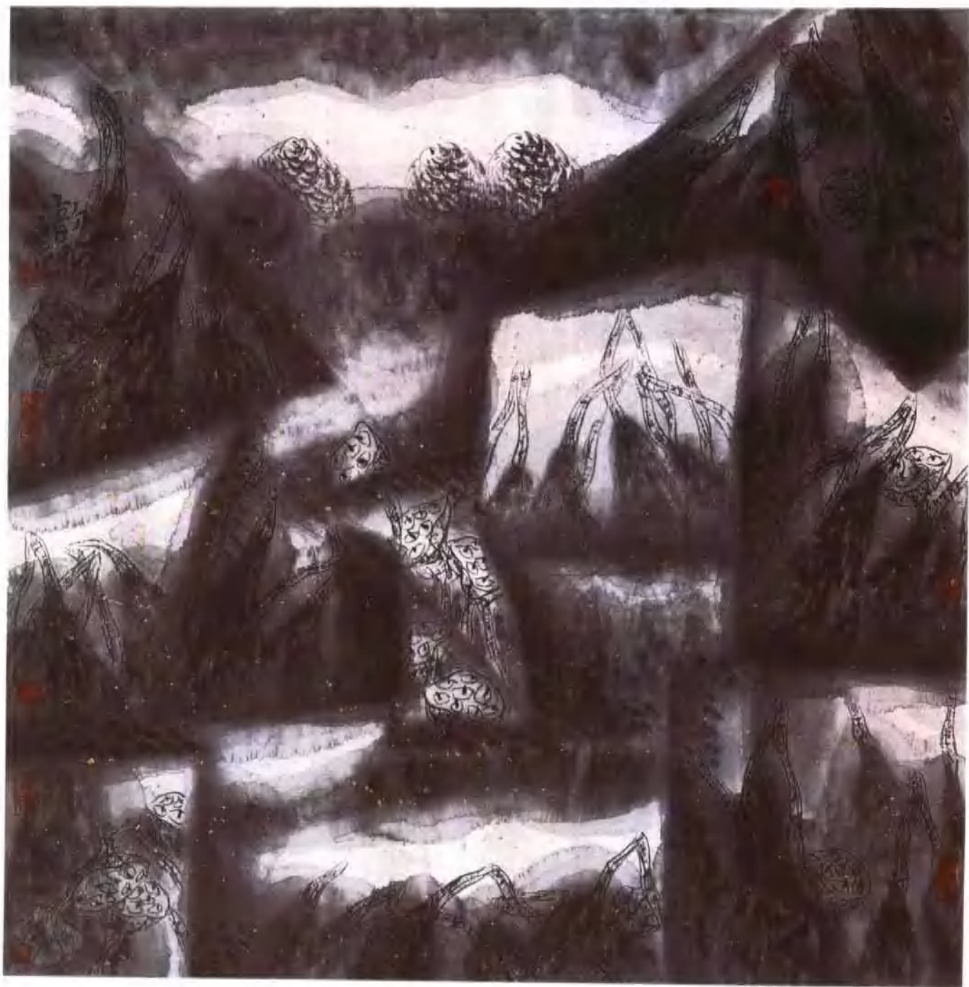
蛊惑 66 × 66cm 纸本 1993