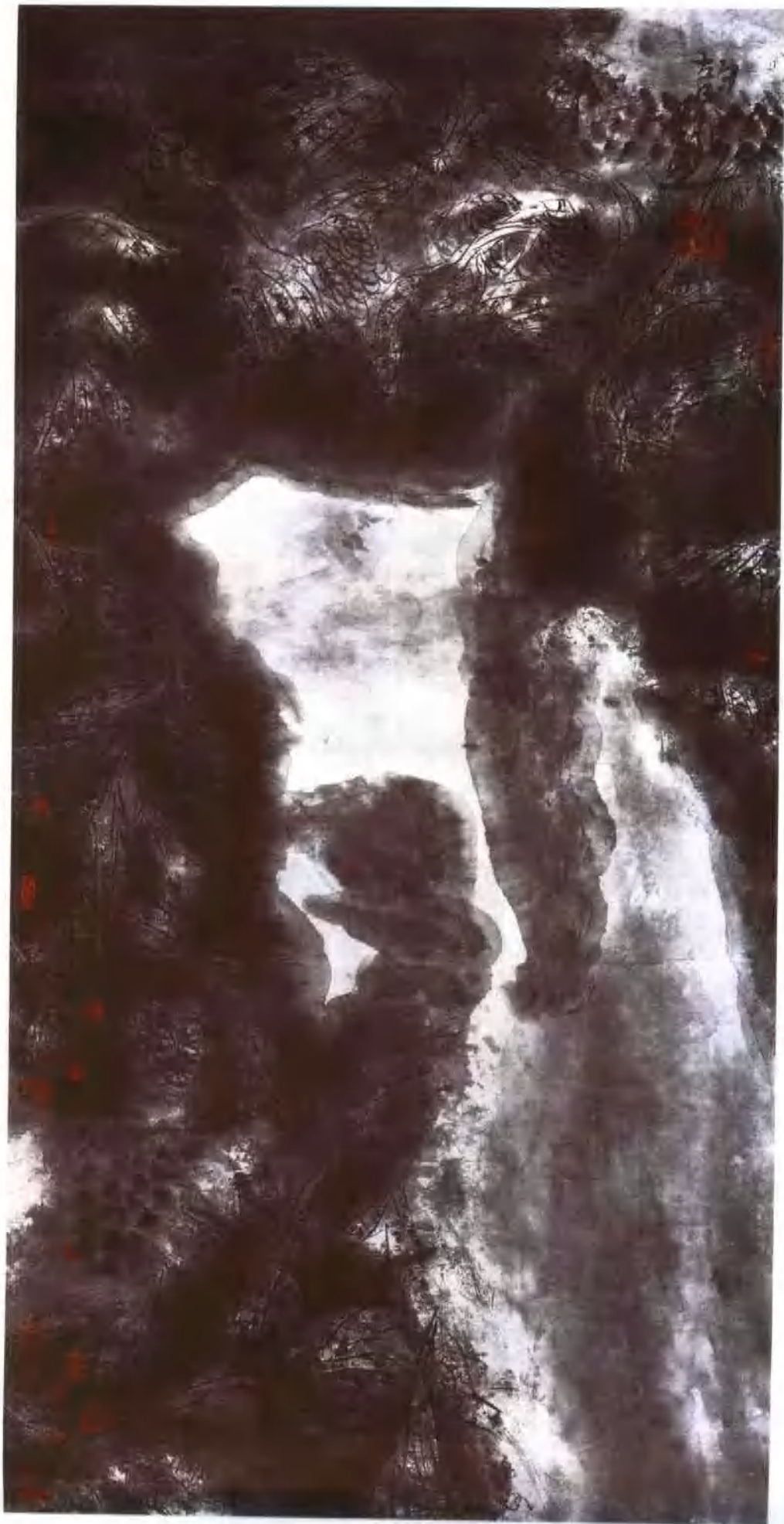
幽塘深处 纸本 68 × 136cm 1994