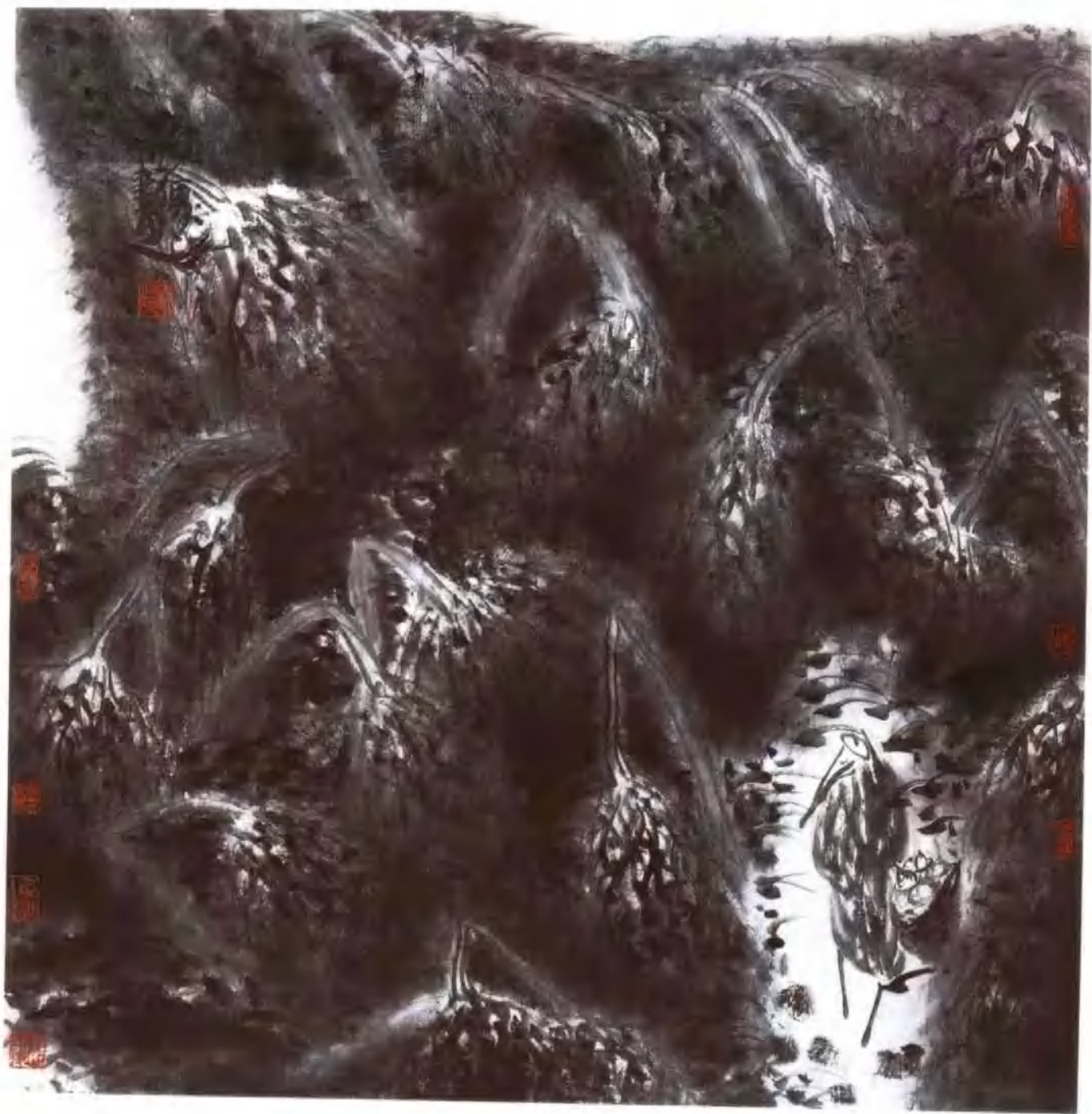
独栖 68 × 68cm 纸本 1993