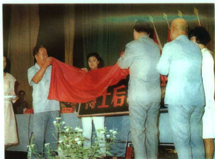
▼博士后流动站成立揭牌仪式

河南医科大学1928年创建于开封，全校占地面积41.91万平方米，是一所省属重点高校，是国务院学位委员会首批批准的具有学士、硕士、博士三级学位授予权的高等医学院校，1991年6月经国家人事部批准设立基础医学博士后流动站。学校拥有配套齐全的先进医疗、教学、科研仪器设备，仪器设备总值达1.2亿元，其中拥有省内第一家磁共振成像系统和全国领先的螺旋CT成像系统。