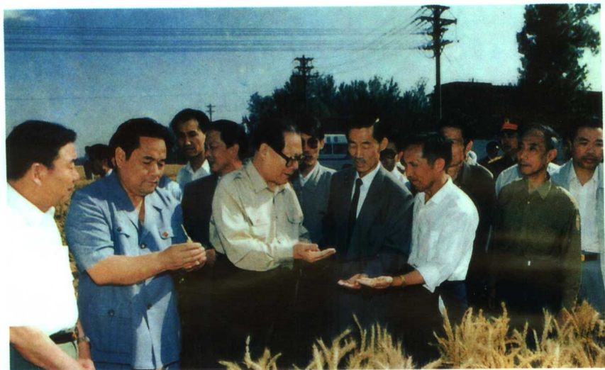
▲ 1996年6月5日，中共中央总书记、国家主席江泽民来院视察

河南省农业科学院是河南省政府直属的事业性综合科研单位。现设有12个直属研究所(中心)和1个科学实验中心，农业部农产品质量监督检验测试中心，国家潮土肥力监测基地、河南省种子质量监督检验站和河南省农作物新品种重点实验室也设在这里。1978年以来，全院共获科技成果1369项(次)，其中获国家级奖23项、农业部奖29项、省政府奖300项。经省级以上品种审定委员会审(认)定命名的品种81个，并有9个品种通过了国家级审定。