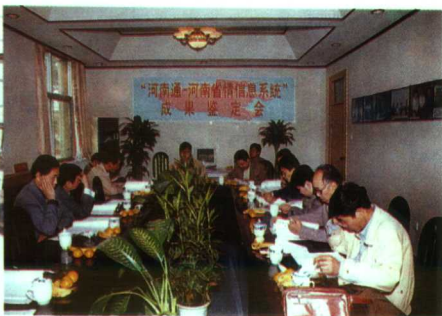
▲地理研究所 GZS 开发应用中心最新研制的“河南通——河南省情信息系统”光盘

河南省科学院创建于1958年,是省政府直属的综合性自然科学应用技术研究开发中心,下设化学研究所、地理研究所、同位素研究所、生物研究所、能源研究所、应用物理研究所、河南省生物技术开发中心、专利事务所、《河南科学》编辑部9个直属事业单位。另有河南省分析测试中心、河南省精细化工重点实验室、河南省硅肥工程技术研究中心、河南省自动化工程技术研究中心和河南省高新技术实业公司。建院以来,河南省科学院在科学研究、科技开发、基础设施和中试基地建设等方面都取得了长足发展,取得了显著的社会经济效益,为河南经济和社会发展做出了重要贡献。