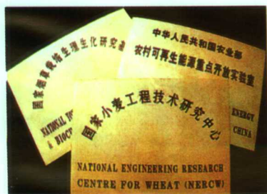
▲依托学校建立的部分国家级科研机构