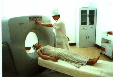
▲投资600多万元购置的日本日立公司磁共振诊断仪

门诊设置齐全，布局合理，医疗设备精良齐全，拥有万元以上大型设备180多台套，医疗业务水平远远走在洛阳市医疗行业前列。改革开放使这所老医院焕发出勃勃生机，两个效益明显提高。