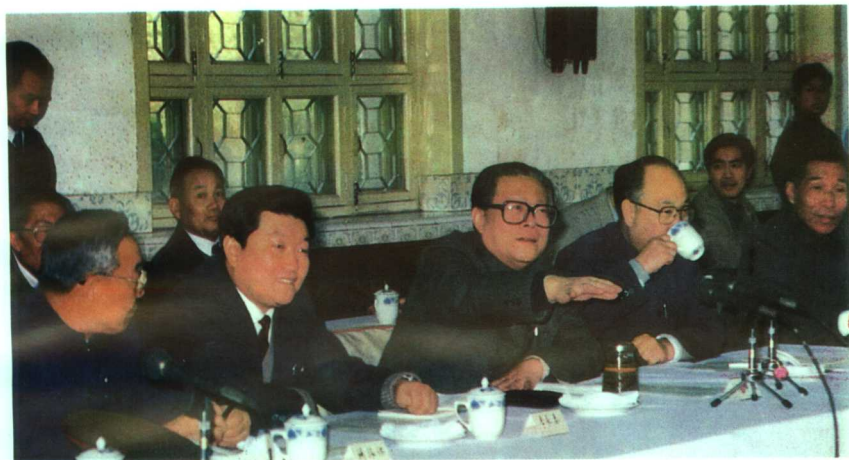
▲ 1991年2月10日，江泽民总书记视察郑州大学

郑州大学创建于1956年，是新中国成立后国家创建的第一所文、理、工全面发展的综合性高等学府。现有7个学院，13个系，54个本、专科专业，30个硕士点，3个博士点，1个博士后流动站，1个国家级“理科基础科学研究和教学人才培养基地”。省委、省政府把郑州大学的建设列为“八五”和“九五”期间全省重点投资项目，并把郑州大学确定为河南省唯一一所申报进入“211”工程高校。