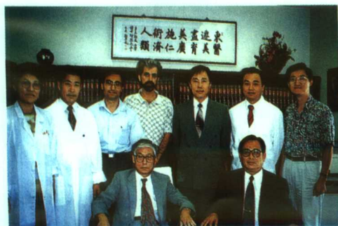
▲学院与美国育英大学结为姐妹学院