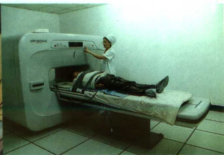
▲引进以色列政府贷款购置的螺旋CT