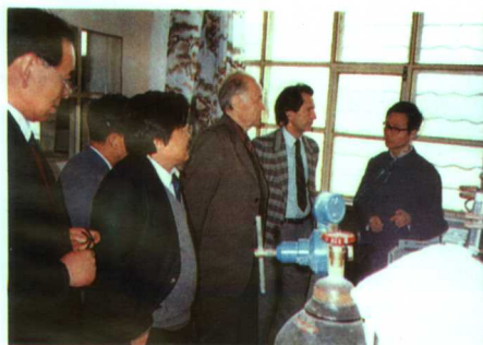
▲白俄罗斯专家与化学研究所进行学术交流