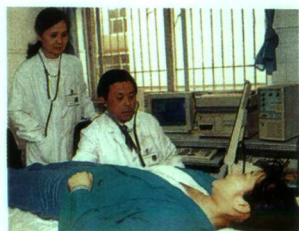
▲高血压个体化计算机辨证诊疗系统