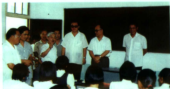
▲中共中央政治局委员、原国务委员李铁映来校参观