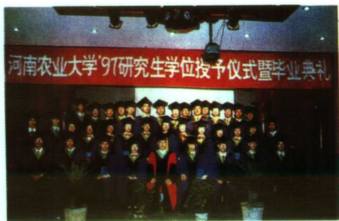
▲硕士研究生举行隆重的毕业典礼