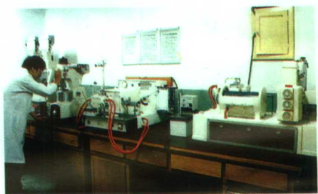
▲测定小麦面粉粉质的设备

河南省农业科学院是河南省政府直属的事业性综合科研单位。现设有12个直属研究所(中心)和1个科学实验中心，农业部农产品质量监督检验测试中心，国家潮土肥力监测基地、河南省种子质量监督检验站和河南省农作物新品种重点实验室也设在这里。1978年以来，全院共获科技成果1369项(次)，其中获国家级奖23项、农业部奖29项、省政府奖300项。经省级以上品种审定委员会审(认)定命名的品种81个，并有9个品种通过了国家级审定。