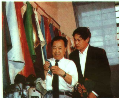
▲KS系列皮化材料荣获国家星光项目二等奖