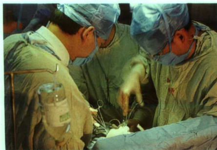
▲全省著名的重点专科心脏外科