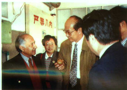
▲联合国粮农组织(FAO)驻我国首席代表库瑞西博来生物研究所进行学术交流