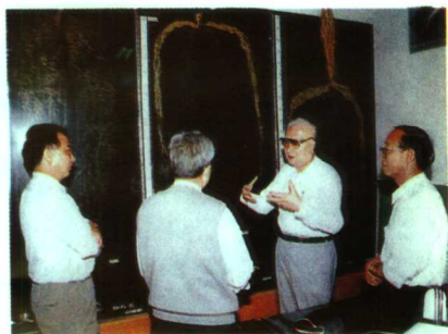
▲中国工程院副院长卢良恕(右二)视察国家小麦工程技术研究中心

河南农业大学创建于1913年，是一所集理、工、农、经、贸为一体，以培养研究生、本科生人才为主的综合性高等农业院校。学校建有“农业生物环境与能源工程”和“作物栽培学与耕作学”两个博士授权点，19个硕士学位授权学科，9个院系，20个本科专业，1个省级农业生物技术与工程技术重点开放实验室，6个省级重点学科，7个研究所，21个研究室。学校实力雄厚，先后主持完成了小麦、玉米、烟草、棉花、泡桐、能源、畜牧、山区农业科技开发、黄淮海平原开发等重大科研项目。近年来承担国家级科研项目19项，省部级科研项目252项，获国家级奖励10项，省部级奖励160多项。