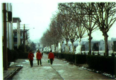
▲汉白玉雕塑装点的东干道