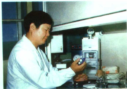
▲科技人员在做实验