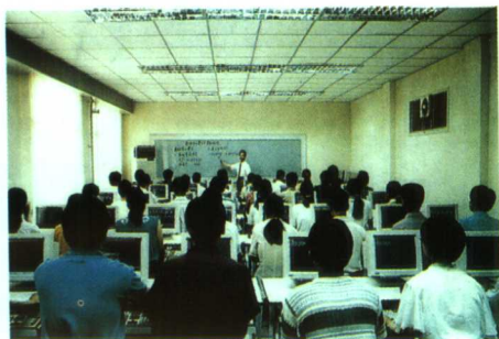
▲现代化的微机教学

河南中医学院是全国建校较早的中医院校之一，国务院批准的有权授予硕士、学士学位，国家教委批准的接收留学生和港澳台学生的中医药高等院校。全院占地面积36万平方米，现有教职工2343名，42个教研室、20个实验室、三所附属医院。设有中心实验室、中药试验场、制药厂、中药标本室和张仲景学术研究中心、脾胃病、儿科、类风湿、眼科等研究机构。学院具有博士研究生、硕士研究生、本科生、专科生四个培养层次，具备普通高等教育、成人教育、留学生教育三种办学模式。学院科研成果丰硕，近年来，有40余项科研成果获省级奖励。