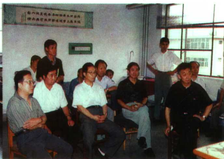
▲张涛副省长视察自动化工程技术中心