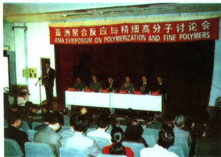
▲亚洲聚合反应与精细高分子讨论会在河大召开