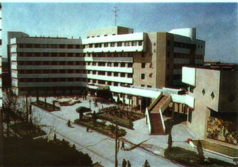
▲拥有先进设备的科技馆