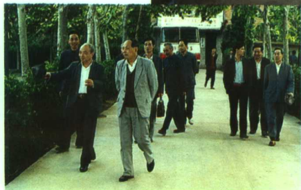
▲全国人大教科文卫副主任 杨海波来校视察