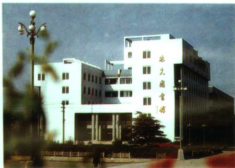
▲现代气息浓厚的图书馆

河南大学创建于1912年。今天的河南大学，是一所拥有文、理、工、经、管、法、体育、艺术等多种学科的综合性大学。学校现设10个学院(含20个系)和7个单列系，办有59个本、专科专业，其中10个为河南省重点学科；39个专业先后招收了博士或硕士研究生。学校先后有4项获国家级优秀教学成果奖，31项获省级优秀教学成果奖。近年来出版教材700余部，其中9部获国家级奖，50多部列入全国统编教材目录，荣获全国教材建设先进单位。