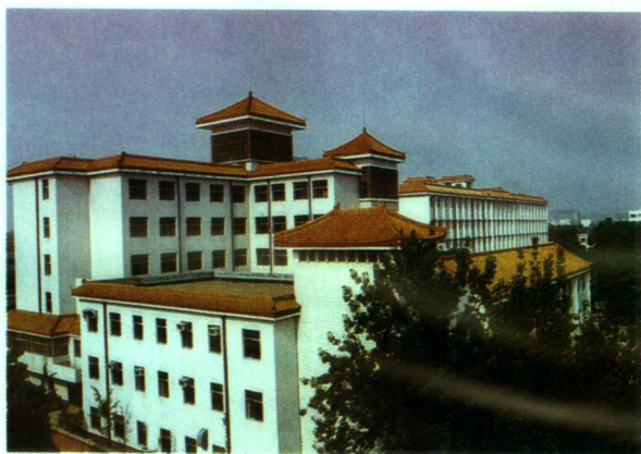
▲庄重、典雅的主体建筑群

河南省中医药研究院是一所应用现代化手段和传统中医药理论进行中医、中药、中西医结合防治疾病的科学研究专业机构，是全省中医药研究的中心基地，是国家中医药管理局确定的重点科研院，在四大怀药、阳虚证研究、高血压病个体化分型诊疗、癫痫病、心脑血管疾病、抗肝纤维化治疗、中药新药研制和保健品开发等方面具有独特的优势。