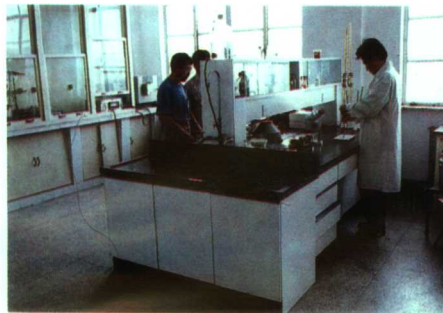
▲省精细化工重点实验室