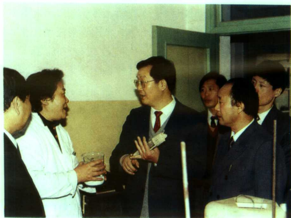
▲卫生部部长张文康来院视察工作