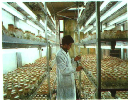
▲生物技术组织培养室