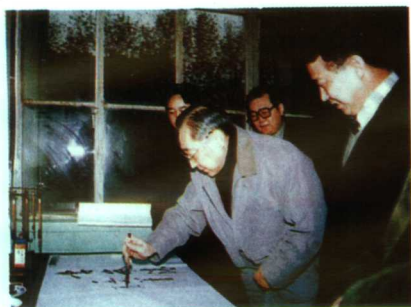
▲中共中央政治局常委、国务院副总理李岚清来校视察时题词