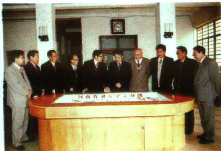
▲校领导班子商讨学校的远景发展规划

河南农业大学创建于1913年，是一所集理、工、农、经、贸为一体，以培养研究生、本科生人才为主的综合性高等农业院校。学校建有“农业生物环境与能源工程”和“作物栽培学与耕作学”两个博士授权点，19个硕士学位授权学科，9个院系，20个本科专业，1个省级农业生物技术与工程技术重点开放实验室，6个省级重点学科，7个研究所，21个研究室。学校实力雄厚，先后主持完成了小麦、玉米、烟草、棉花、泡桐、能源、畜牧、山区农业科技开发、黄淮海平原开发等重大科研项目。近年来承担国家级科研项目19项，省部级科研项目252项，获国家级奖励10项，省部级奖励160多项。