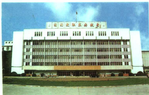
▲学校实验中心大楼