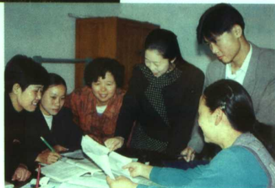
▲为了上好每一节课