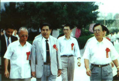
▲1996年副省长张世英出席院黄河中医药国际学术研讨会