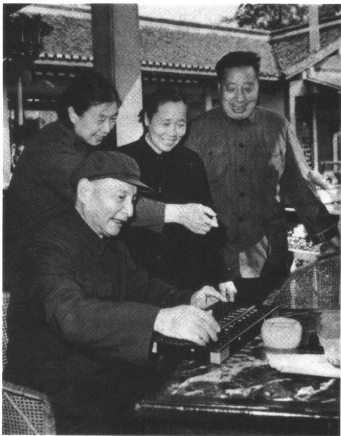
1978年11月1日，陈云在杭州玉泉茶室打算盘。

我要走了，他说把那个塞子给他塞上，他要跟我说几句话。他说，如果我没有到上海，没有当工人，没有到商务印书馆，就没有机会接触共产党。他说从青浦到上海，这是我人生中间，非常重要的一段，这步迈出去以后，才有机会接触到共产党，才有这一生。那会儿可能是觉得自己病重了，才有了这番对人生总结的话。