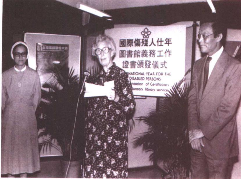
应邀任国际伤残人士年开幕典礼嘉宾(1981年)