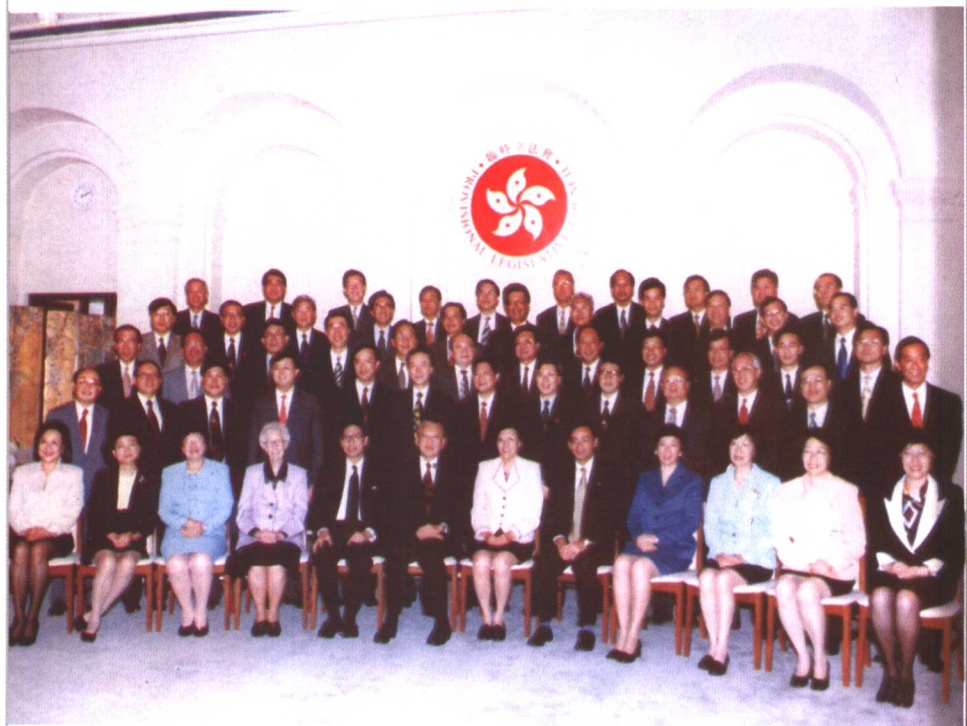
参加在深圳举行的临时立法会选举(1996年)