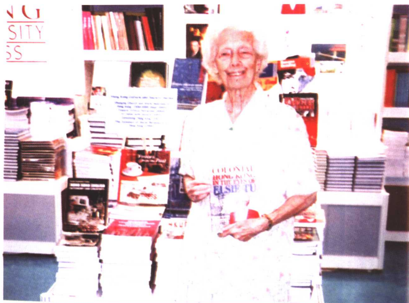
摄于2003香港书展上(《我眼中的殖民时代香港》英文版)