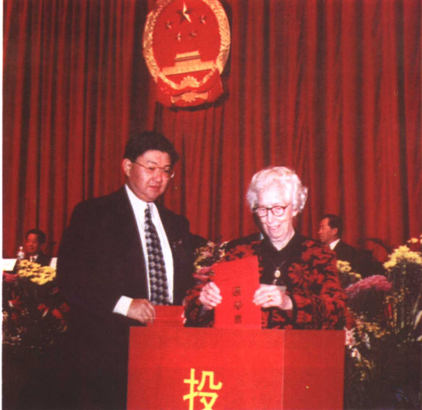
参加在深圳举行的临时立法会选举(1996年)