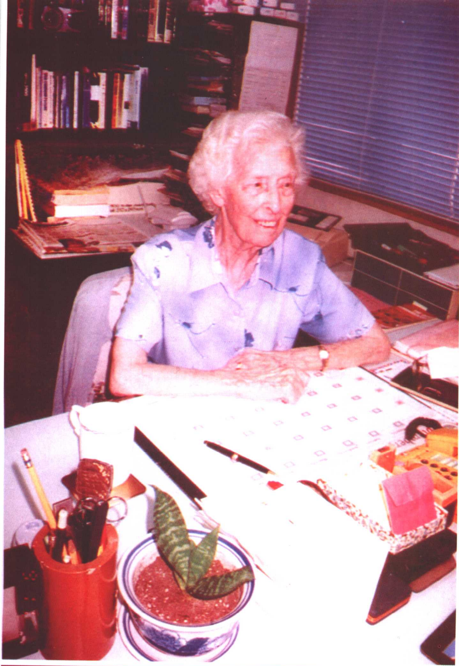
在学校接受传媒访问(2003年)