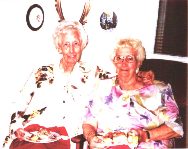
与妹妹出席母校颁发特别荣誉奖后的派对(1996年)