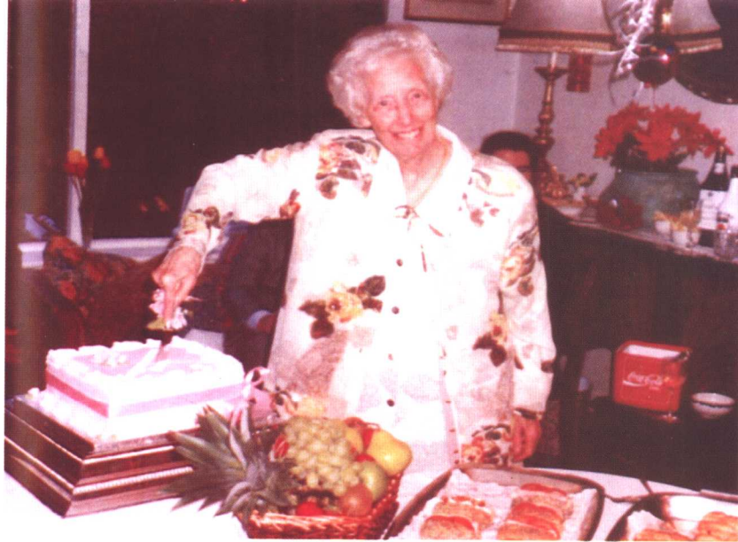
与妹妹出席母校颁发特别荣誉奖后的派对(1996年)