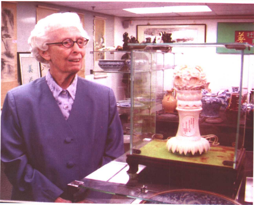
第二次捐出私人珍藏品筹款帮助贫困人士