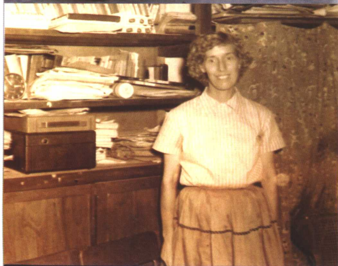
摄于启德 新村办公 兼家居中 (1958年)