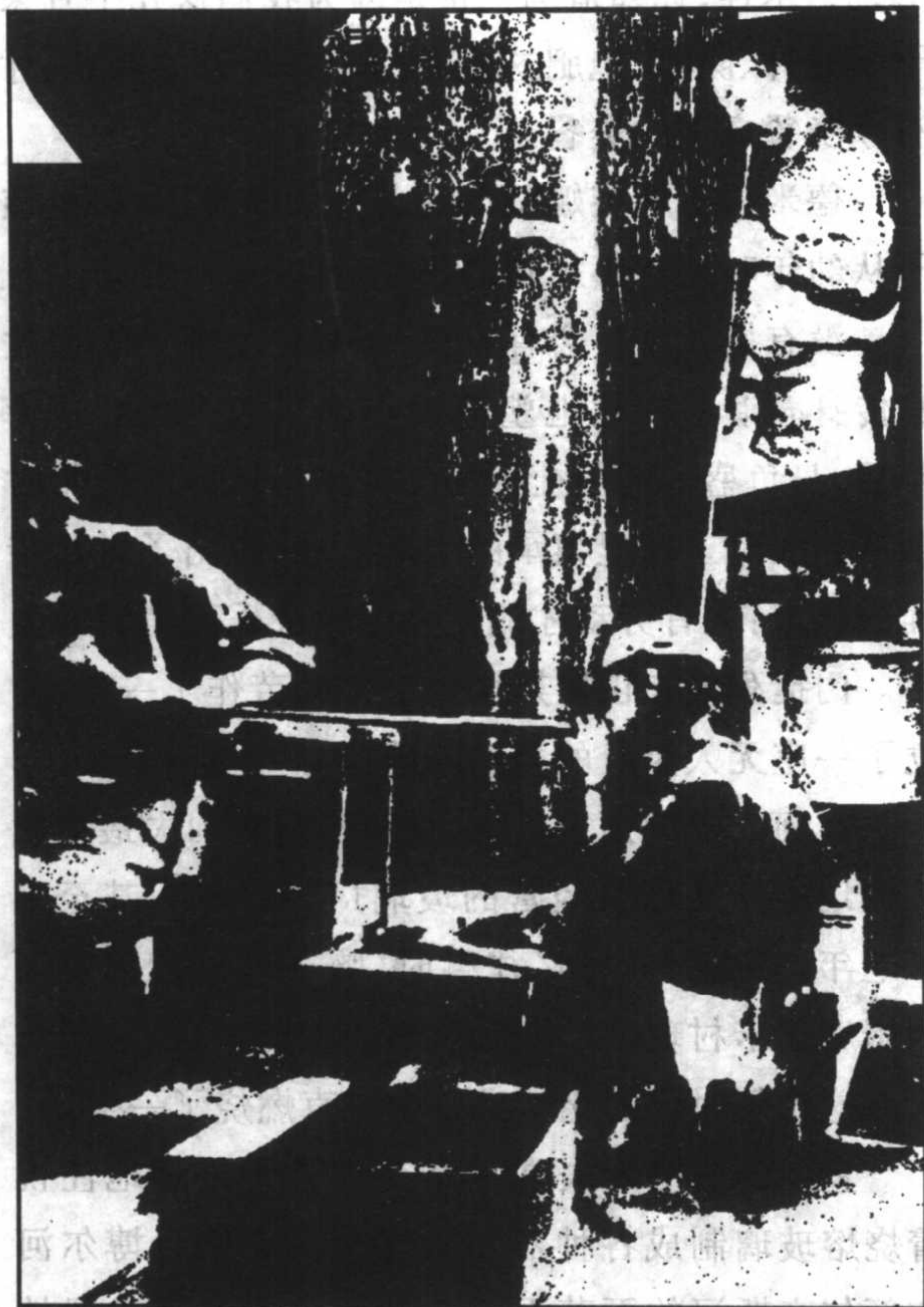
Caption text in Chinese characters, likely describing the scene in the photograph above.