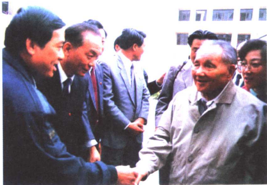
1992年，邓小平接见顺德主要领导

20世纪90年代初，中国的改革遇到了前进中的问题，姓“社”姓“资”的争论使不少人陷入困惑与苦闷，政府主导、负债发展的“顺德模式”也受到一定的影响。1992年，邓小平来到广东，在顺德发表“发展就是硬道理”的著名论断。邓小平的南巡讲话坚定了顺德人深化改革的决心，此后，顺德的综合体制改革开始启动，顺德人迈开了二次创业的步伐。