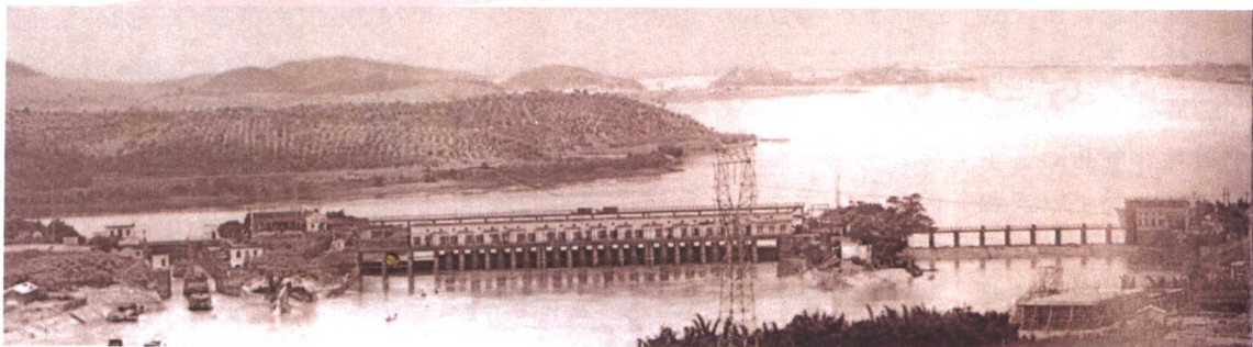
甘竹滩洪潮发电站

间，经济运作照常进行，没有发生大的武斗，社会秩序相对稳定，一度冷落的社队办工业重新恢复发展。20世纪70年代开始，顺德兴修了三项大型水利工程：疏挖潭洲水道、围垦中心沟、修建甘竹滩洪潮发电站。当时，在劳动技术低的条件下，完全依靠人力来战天斗地，改造自然，其突破限制、勇于创新、敢为天下先的精神已初现端倪。文革期间，交通也有所发展，主要交通干线改为沥青路面，实现了公社与公社和公社与主要乡村通车。1975年，县二轻电线厂和北滘电器塑料厂试制台式金属电风扇成功并投产，标志着顺德家用电器产业开始萌芽。1977年10月，顺德中国旅行社开业，透出了新时代春天的气息。