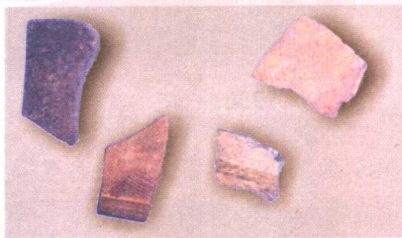
顺德出土的古陶瓷碎片

江南移民的大量迁入，形成了强烈的中华民族的自尊与自强意识。江南移民丰富的水田耕作经验，促进了水乡的垦辟；大规模筑堤围垦，使土地面积不断扩大；水稻成为主要的农作物，