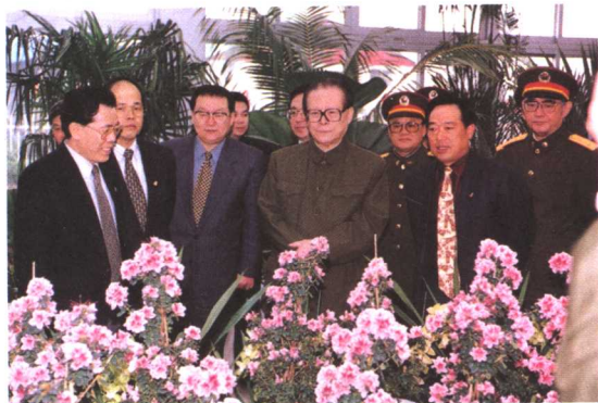
2000年，江泽民视察陈村花卉世界