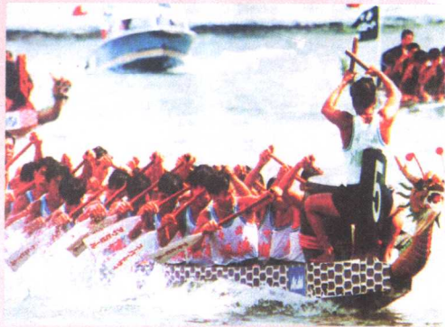
顺德男子龙舟队在国际比赛中

顺德的体育场馆遍及城乡，全民健身非常普及，体育竞技成绩突出。继均安女篮之后，顺德舞狮队、龙舟队、武术队等先后在国内外各种大赛中取得好成绩。