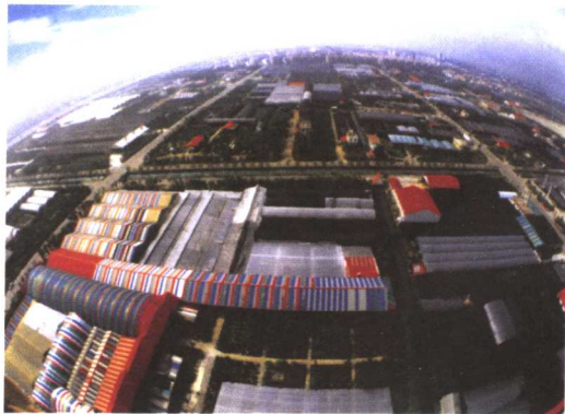
俯瞰陈村花卉世界

这个时期，顺德产生了万家乐集团公司，美的、华宝空调器厂，广东电饭锅厂和珠江冰箱厂等一批国内著名企业；出现了专业产业群，如龙江、乐从的家具，伦教木工机械，北滘、容桂的家用电器和涂料，勒流的五金和交通机械，陈村的花卉、机床等。到1991年，年产值亿元以上的乡镇企业达14家，全国年产值2亿元以上的10家乡镇企业中，顺德占5家。