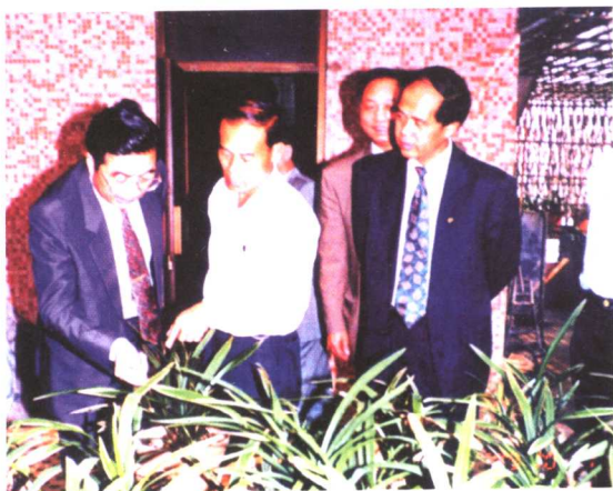
1994年，胡锦涛参观陈村

1992年9月，顺德的综合体制改革正式启动，主要内容有：一、实行企业转制，进行产权改革，推行“全员股份化”、“贴身经营”。二、实行政府机构改革，大刀阔斧削减政府机构，按市场经济要求转变和规范政府职能，实现政企分开、政资分开，政府对经济事务的管理由直接变间接，微观变宏观，行政式变分权式。