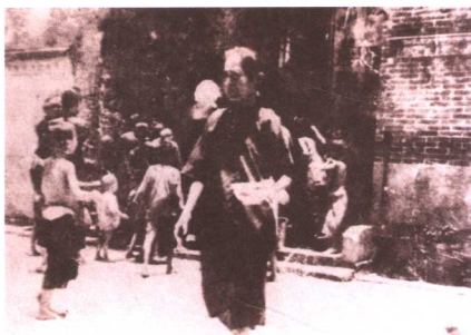
饥民轮候救济食品 (摄于20世纪30年代)

1929年，世界性经济危机爆发，世界市场对于蚕丝的消费锐减，市场萎缩，价格暴跌，导致顺德经济全面崩溃，82.2%的丝厂倒闭，1933年全县失业人口高达20多万人。