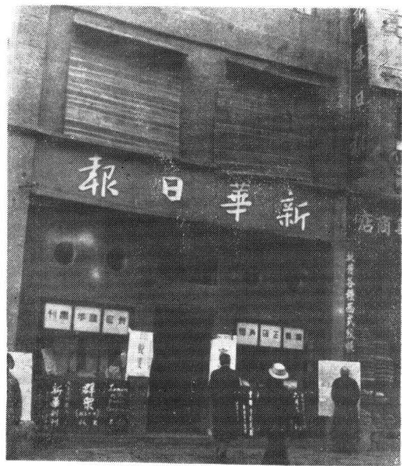
重慶民生路新華日報館門市部