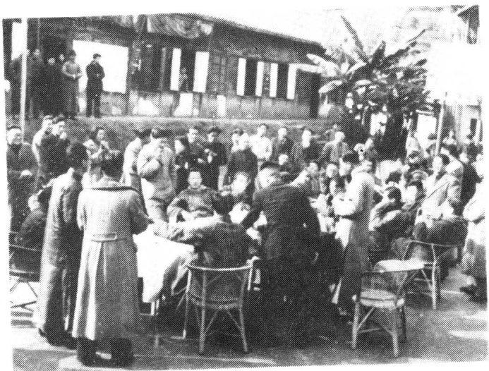
创刊四周年，各界友好来报馆祝贺联欢