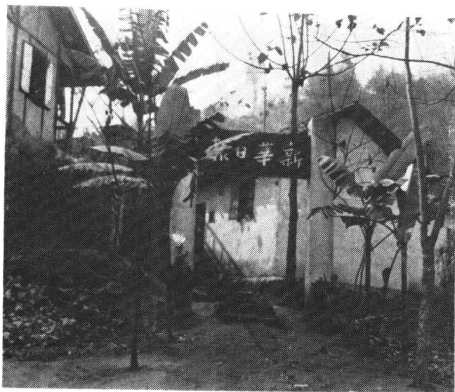
重慶化龍橋新華日報館大門