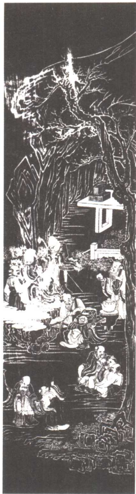
◎ 《百寿图》，绵竹年画八条屏之一。清版。