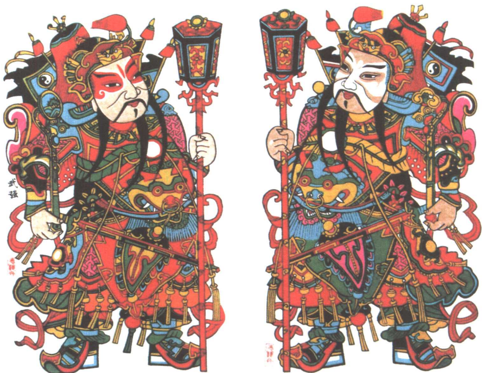
◎ 《立锤门神》，武强年画。