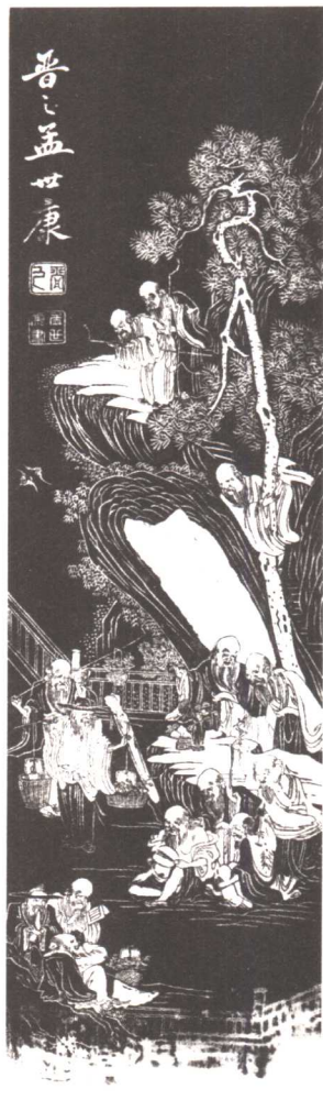
◎ 《百寿图》，绵竹年画八条屏之一。清版。

总之，不同体裁的年画贴在不同的地方，过年时，屋里屋外，院内院外，各个角落都贴得红红火火、花花绿绿，既用以表达主人的心愿，又烘托了节日气氛。