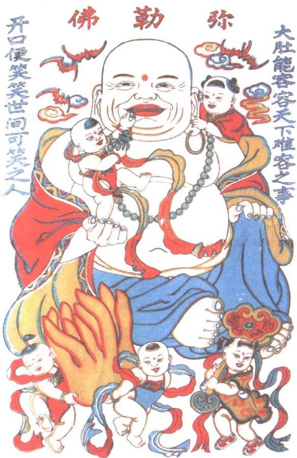
◎ 《弥勒佛》，喜庆类题材，武强年画。