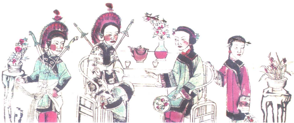
◎ 山东仕女类年画，清朝。