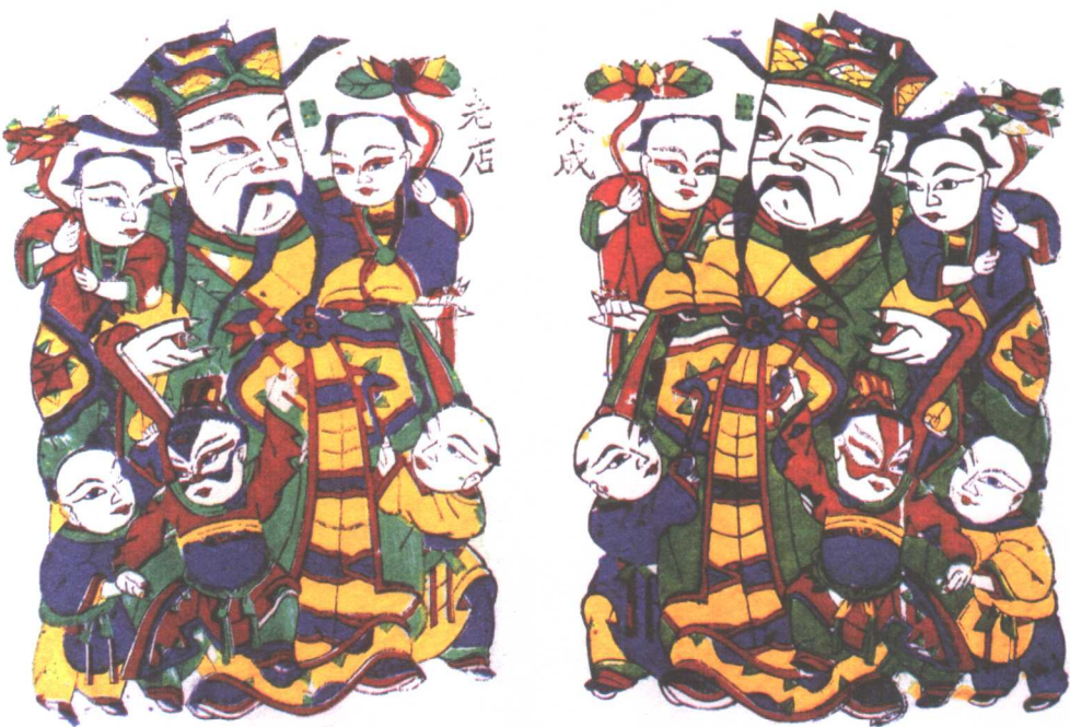
◎ 《五子登科》，也叫五子门神。