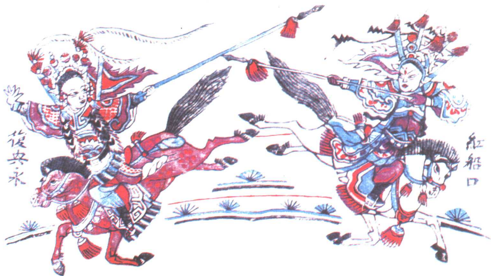
◎ 山东戏出类年画，清朝。