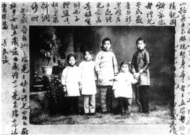
童年时林徽因和表姐妹的合影，最左边那个眉眼很清秀的小姑娘是她。