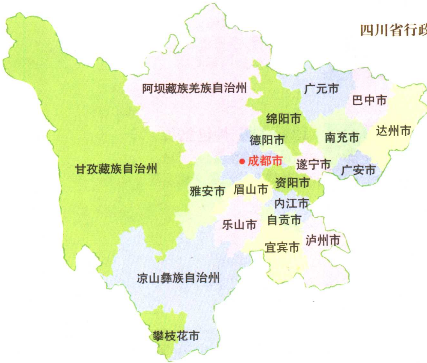
四川省行政区划示意图