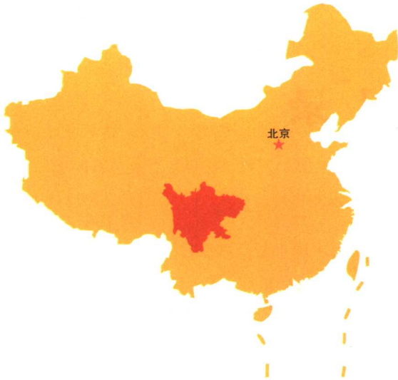
四川省在中国的位置示意图