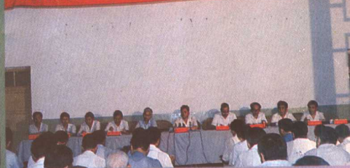
▲河南省实现了普及初等教育。