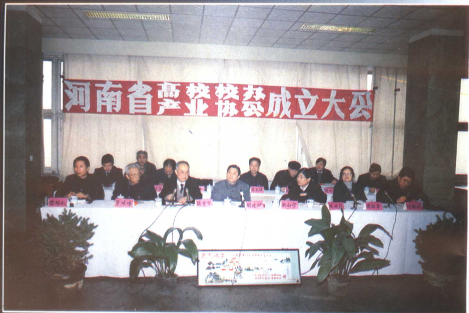
▲ 1991年12月21日河南省高校校办产业协会成立。 省教育生产公司供稿