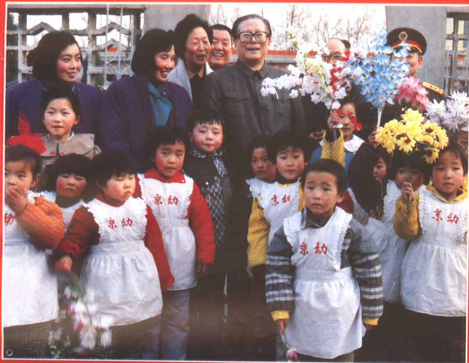
▲1991年2月6日江泽民总书记到新乡县京华实业公司视察，与幼儿园的小朋友合影。