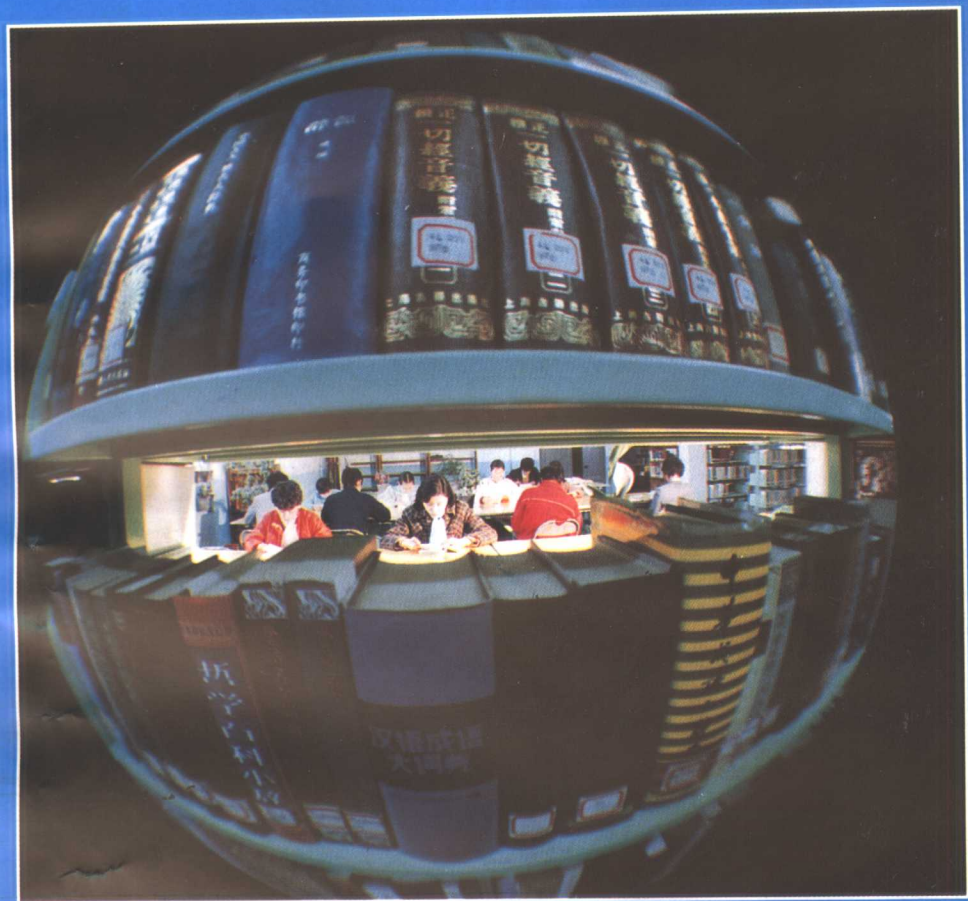
▲ 郑州大学阅览室一角。