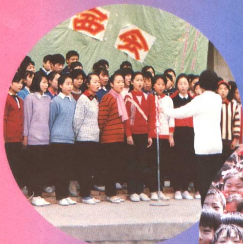
◀洛阳市实验中学组织学生开展唱好歌比赛。