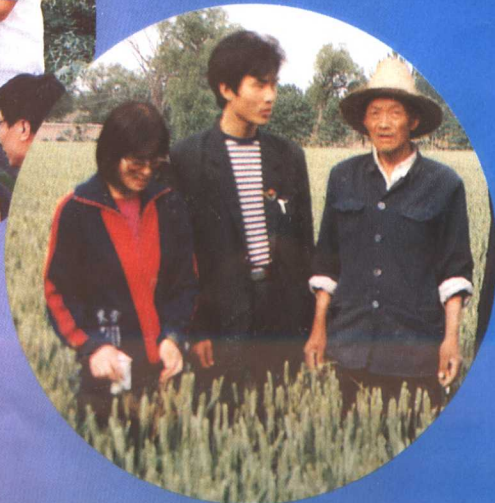
▲河南农大建成世界最大的泡桐种质资源基因库。图为河南农大校长、泡桐专家蒋建平与科研人员在荣阳泡桐科研点上。