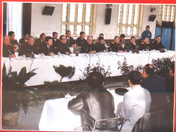
▶1991年2月 10日江泽民总书记 到郑州大学视察，并 与师生代表座谈。