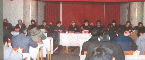
▲全国高等农林专科教育发展改革研讨会在郑州牧专举行。