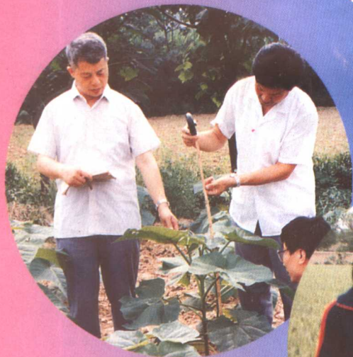
▼河南职业技术学院农学系开展大学生“科技承包农户”活动。图为学生向农民作田间指导。