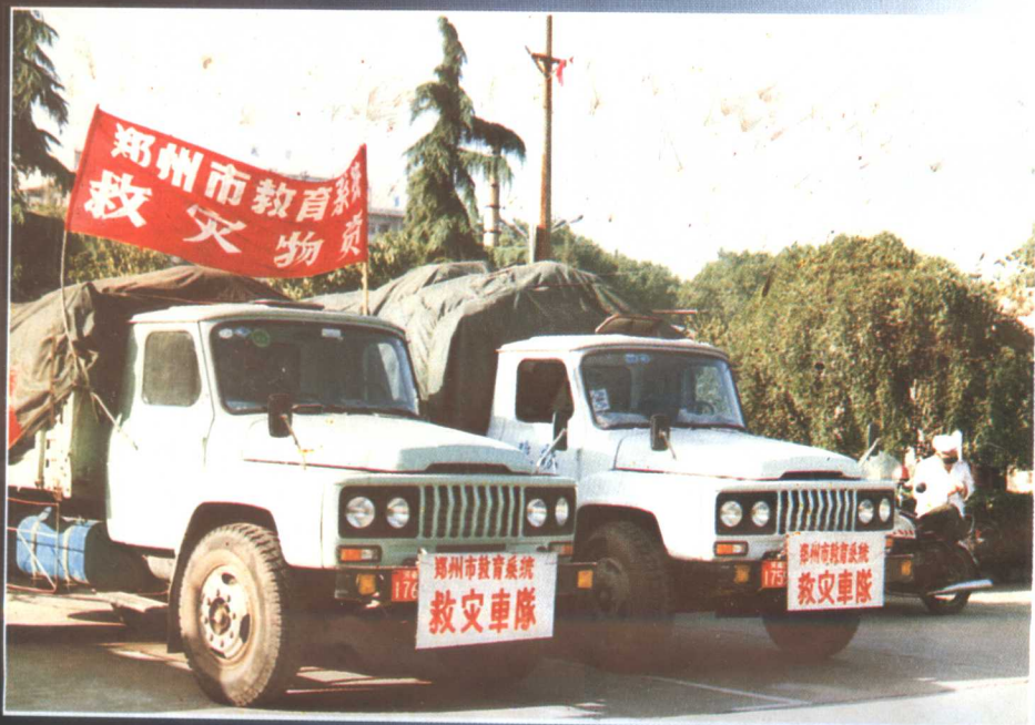
▲ 1991年9月运往灾区固始县的郑州市教育系统救灾物资。