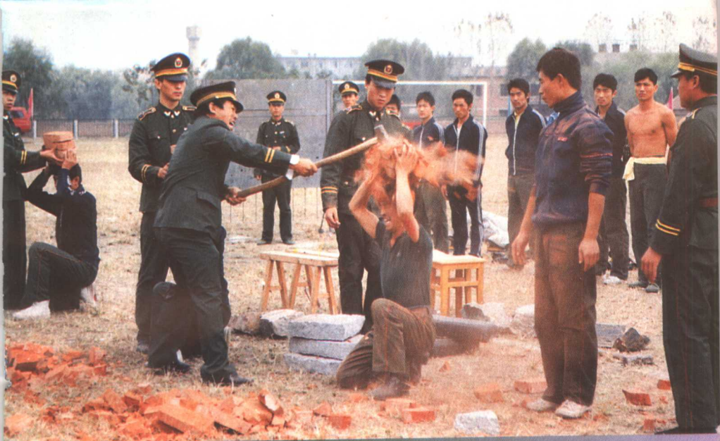
▲铁道部郑州公安干部学院学员在进行硬气功表演。