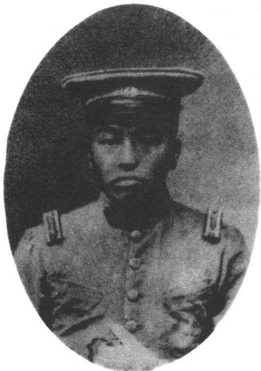
1923年，在湖南陆军讲武堂学习时的彭德怀

在大清国的京城里因为维新变法而政局动荡，仁人志士为了中国的变法图强而血洒市井的年代里，伴着乌石祠的雄浑钟声，“真伢子”渐渐长大了。