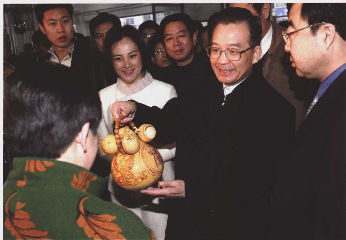
2004年11月中共中央政治局常委、国务院总理温家宝到辽宁考察，了解振兴东北等老工业基地战略实施情况。这是2004年11月14日，温家宝在锦州考察锦州市劳动力市场。