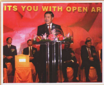
商务部副部长张志刚在第 98 届中国出口商品交易会上致词