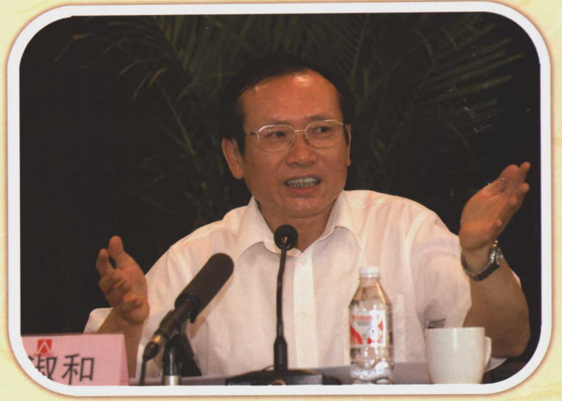
国务院国有资产监督管理委员会副主任黄淑和在地方国资委工作会议上讲话