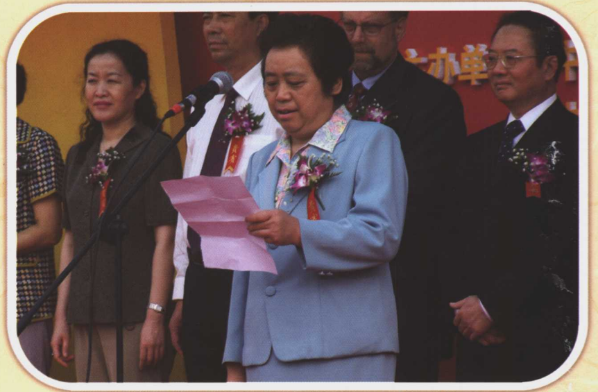
国家发展和改革委员会副主任欧新黔在中国中小企业创新发展高级研讨会上讲话