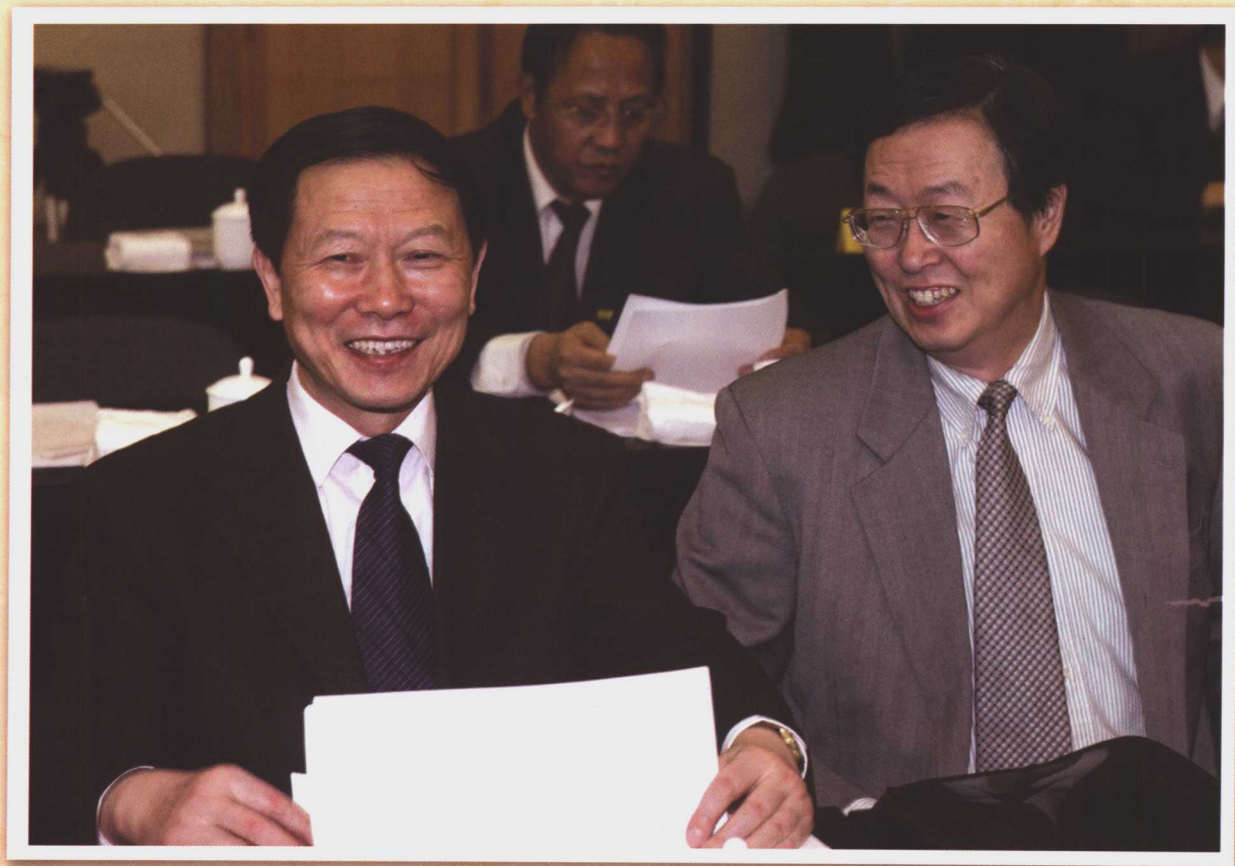
国务院国有资产监督管理委员会主任李荣融（左）、中国人民银行行长周小川（右）出席全国政协经济界、农业界委员联组讨论会。