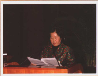
全国人大法律委员会副主任委员蒋黔贵在全国企业管理创新大会上发言