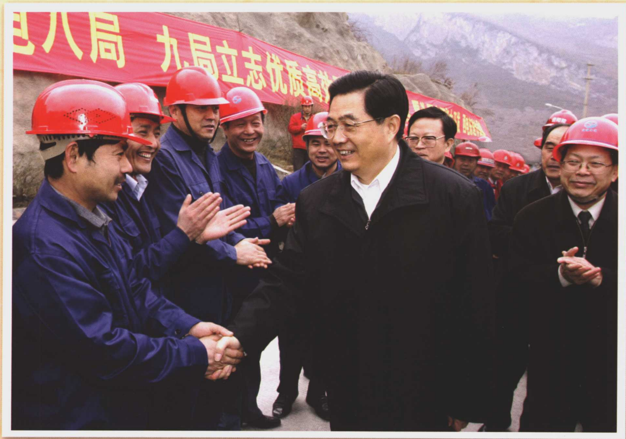
2005年2月7日至11日，中共中央总书记、国家主席、中央军委主席胡锦涛春节期间到贵州考察工作，并同各族干部群众一起欢度春节。这是2月10日胡锦涛在索风营水电站建设工地考察，并与节日加班的工人们亲切交谈。