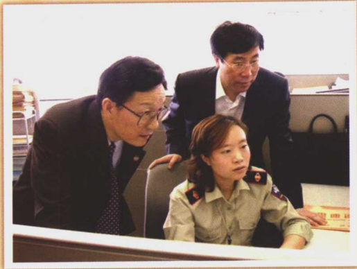
国家税务总局局长谢旭人视察苏州工业园区国税局