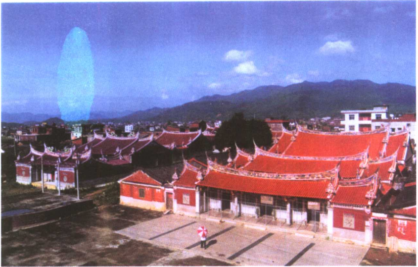
守恭公长房经公祖祠始建于公元 1458 年的良庵祠堂