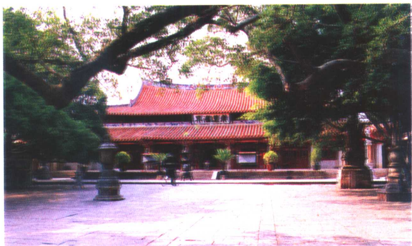
开元寺百柱殿 又称紫云大殿,始建于唐垂拱二年(公元 686年)