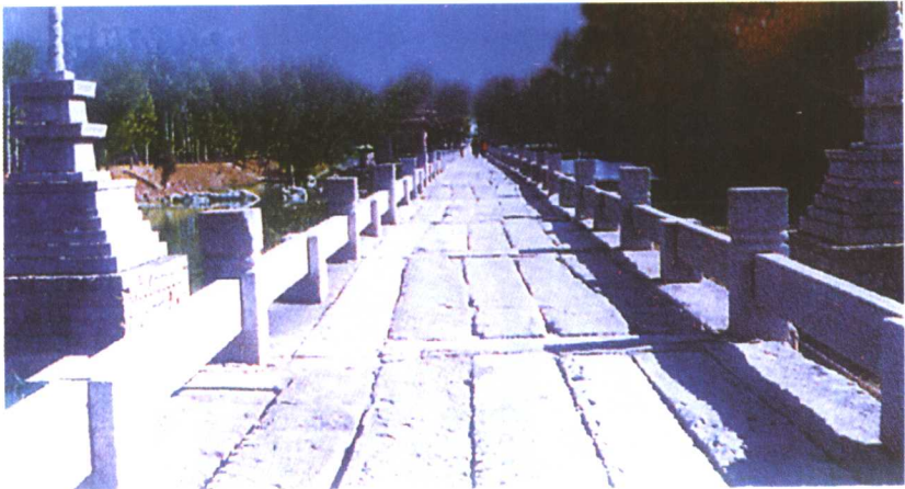
黄守恭裔孙黄护、黄逸于公元1138年偕建安平桥 1961年3月安平桥为国务院批准国家重点文物保护单位