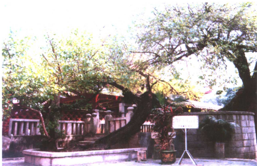
唐代桑树 距今已有 1300 多年的历史