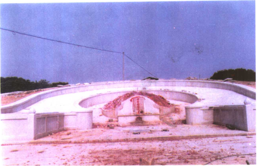
守恭公墓茔:位于潘山寺后翠屏山下,土名白塔穴,俗称刺仔墓。方位坐辛向乙兼戌辰。(2000 重修建)