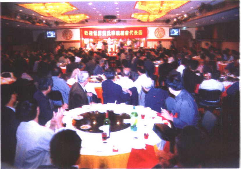
1999年11月,泉州江夏联谊会与紫云文物修建会在华侨大厦举行盛大宴会,热烈欢迎世界黄氏宗亲总会谒祖团代表