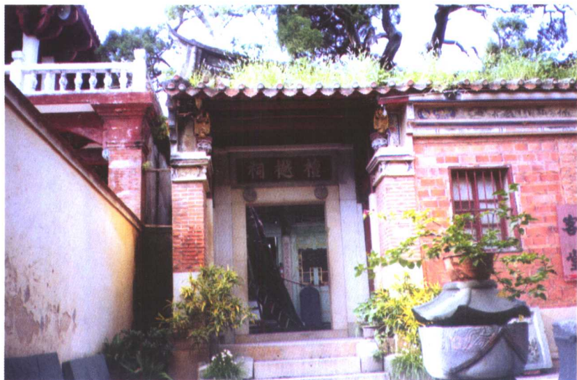
泉州紫云黄氏祖庭开元寺檀樾祠