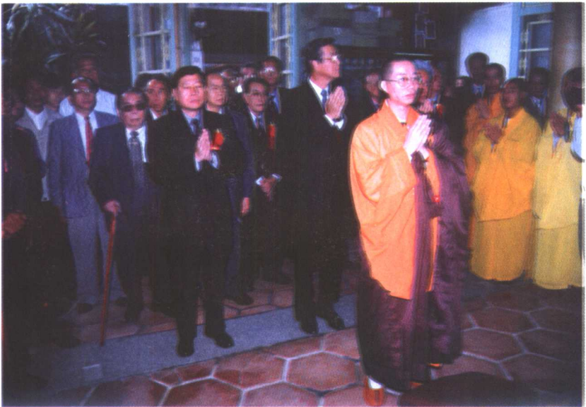
1999年11月世界黄氏宗亲总会谒祖团之宗亲在泉州开元寺檀樾祠拜谒守恭公神座