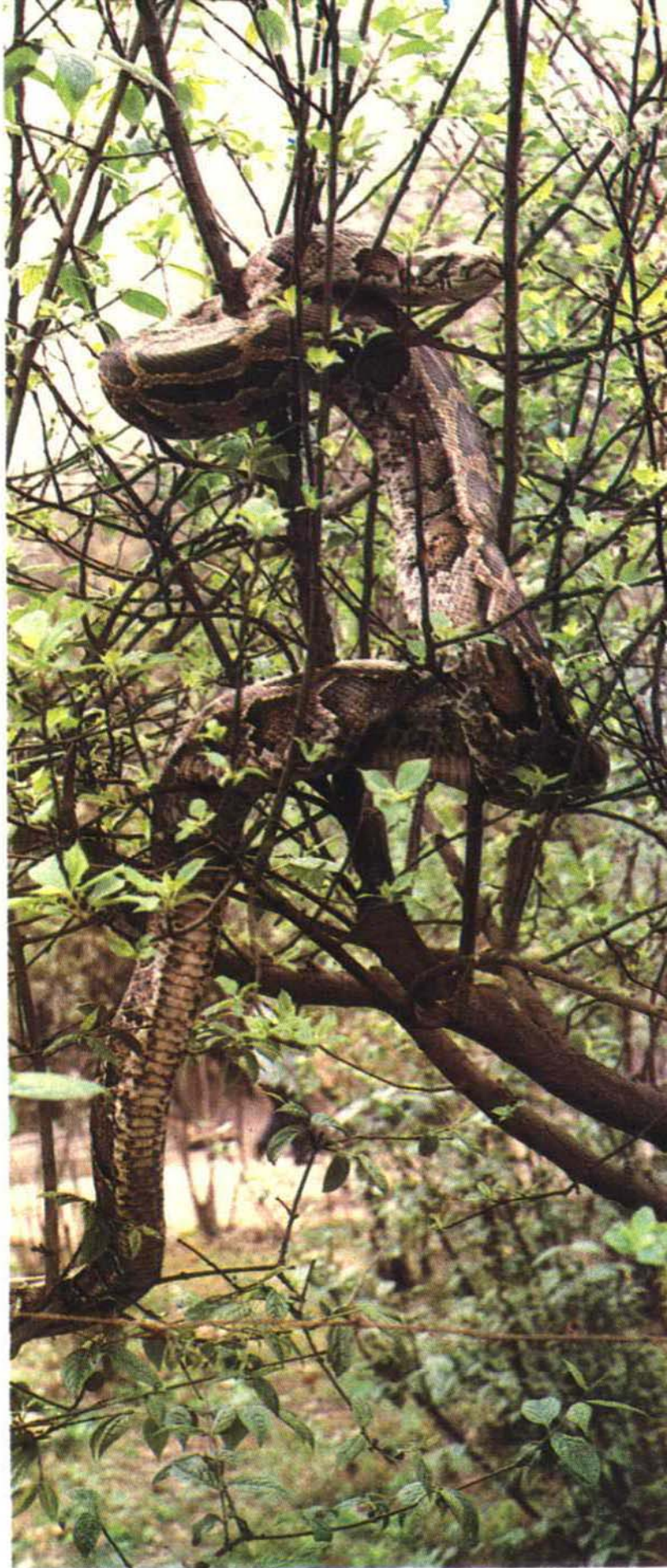
▲蟒，是蛇类中最大的，能囫圇吞食鸡和小兽。

象龟也属于爬行动物，虽然其貌不扬，但却是动物中的“寿星”，因此，人们非但不讨厌它，而且常用它比喻长寿。据说龟能活几百年，即使较长时间不进饮食，凭着它自身储备的养料，也不会饿死。艺术家们都把龟作为耐力和坚强的象征，因此，不少桥梁、石碑、房屋基石都刻有龟的形象。