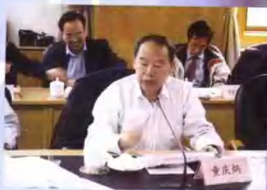
到会领导、学者在会上谈学习体会