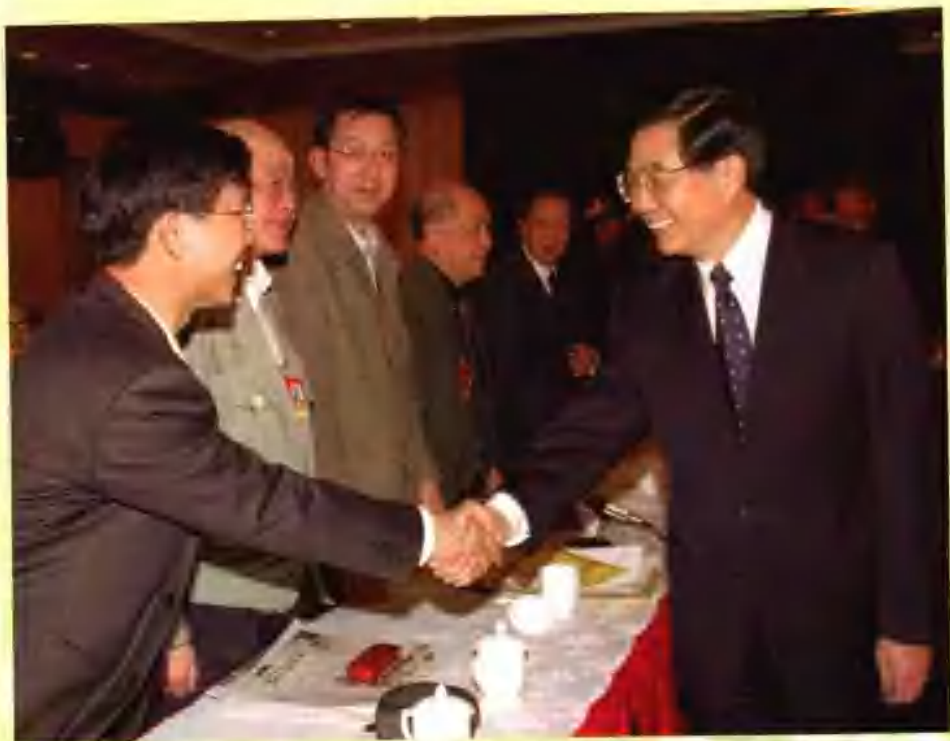
2002年3月4日，中共中央政治局常委、国家副主席胡锦涛来到中土大厦，看望出席全国政协九届五次会议的社会科学界和新闻出版界委员，并与大家共商国是。图为胡锦涛与委员握手