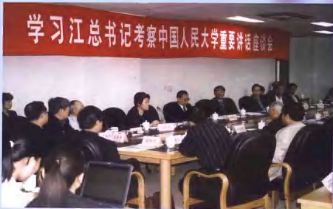
首都社会科学界学习江泽民同志考察中国人民大学时的重要讲话