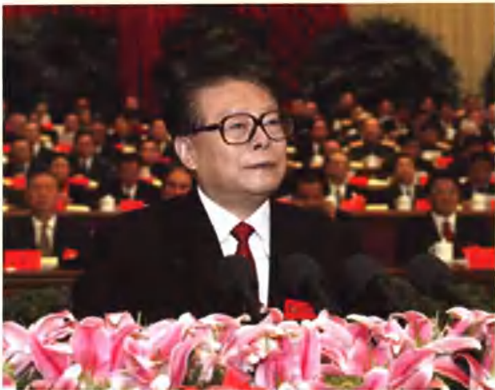
2002年11月8日，江泽民同志在中国共产党第十六次全国代表大会上代表第十五届中央委员会作报告