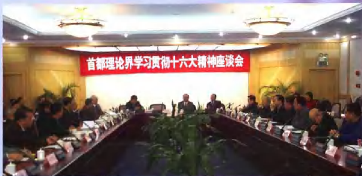
2002年11月24日，首都理论界召开学习贯彻十六大精神座谈会