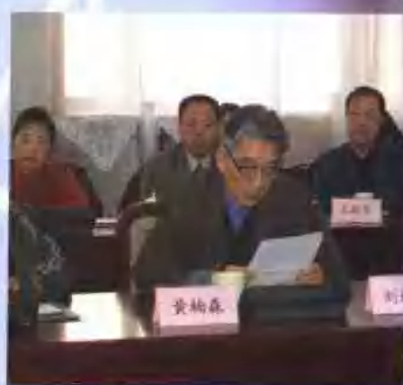
到会领导，专家学者在会上发言