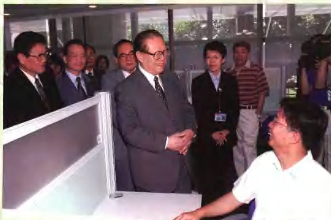
2002年7月16日，中共中央总书记、国家主席、中央军委主席江泽民来到中国社会科学院考察工作。图为江泽民考察时参观电子阅览室