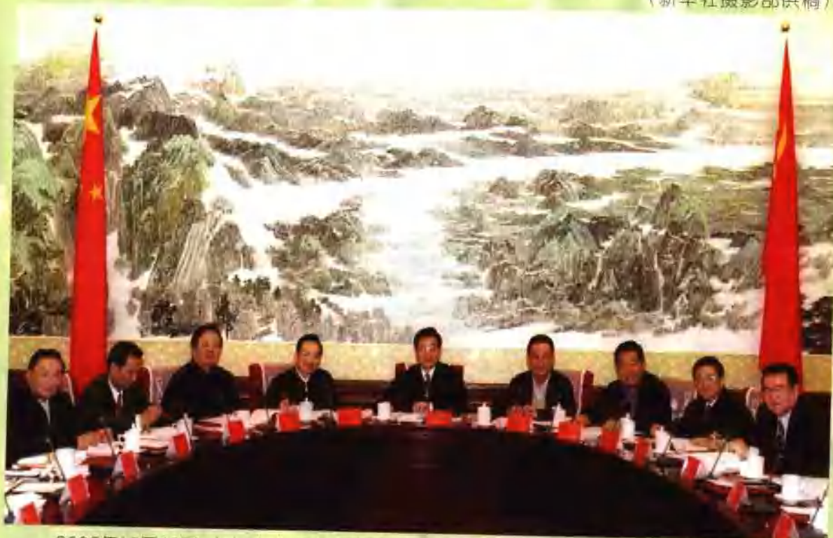
2002年12月26日，中共中央政治局集体学习宪法。中共中央总书记胡锦涛主持学习并发表讲话