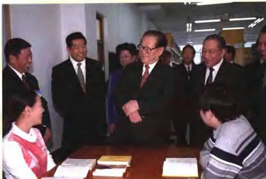
2002年4月28日，在五四青年节即将到来之际，中共中央总书记、国家主席江泽民来到中国人民大学考察工作，亲切看望学校的师生员工。中共中央政治局常委、国务院副总理李岚清，中共中央政治局委员、北京市委书记贾庆林随同考察 (新华社摄影部供稿)