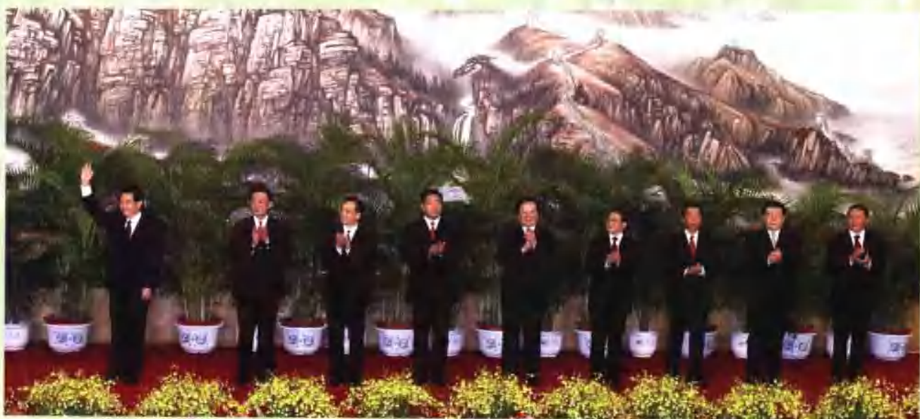
2002年11月15日，新当选的中共中央总书记胡锦涛和中央政治局常委吴邦国、温家宝、贾庆林、曾庆红、黄菊、吴官正、李长春、罗干在人民大会堂与采访十六大的中外记者见面