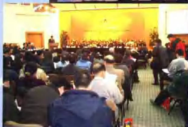
2002年12月14 日至 22日，北京市社会科学界联合会和北京师范大学共同主办“2002 学术前沿论坛”。图为以“小康社会：创新与发展”为主题的主论坛（上图）和部分分论坛（下图）