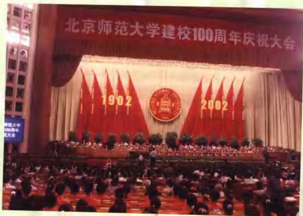
北京师范大学建校100周年庆祝大会会场