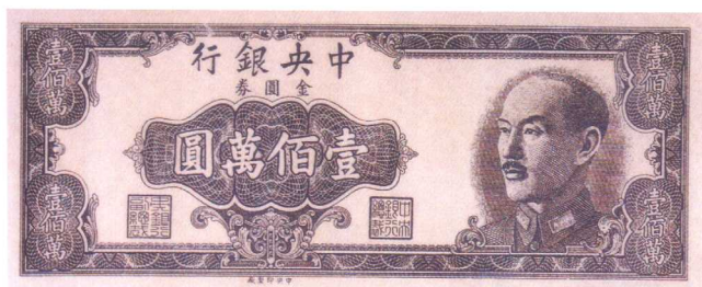
蓝色试印票、无套花