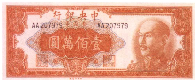
桔色试印票、有套花