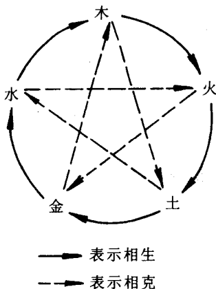
图 3-1 五行生克图

③相生关系《难经》中称为“母”“子”关系。“生我”者为母,“我生”者为子。相克关系《内经》中称为“所胜”“所不胜”。既“克我”者是“所不胜”,“我克”者是“所胜”。