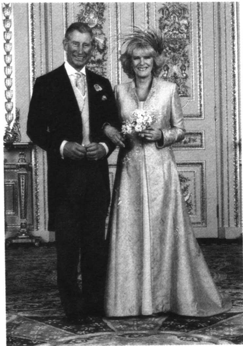
2005年4月9日，英国王储查尔斯和情人卡米拉结束长达35年的爱情长跑，成为一对真正的夫妻。

2005年在一个内地电视台的访谈里，看到张柏芝面带微笑，用蹩脚的国语说：“我浑身上下都流着爱的血液。如果不是观众对我的支持的话，我早就不活在世上了。”我一点也不想笑话她。这个年轻美丽的女孩，虽然刚被《无极》的无厘头糟蹋了她的美貌和演技，可是，我仍然相信柏芝演倾城就是演她自己：一个浑身流淌着爱的血液的人，她被命运施了咒永远得不到真爱，于是，她的一切行为看来就像个不