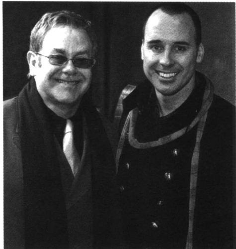
2005年12月21日，著名歌星埃尔顿·约翰与多年男友戴维·弗内斯在温莎市政厅正式注册结婚。之前一日，英国法律正式批准同性恋结婚。

她的胸她可以出名，单凭她的文字也可以出名，如果身材和文字都有呢？就成了牛人。她的粉丝们的素质普遍比其他宝贝的追随者要高许多，从大学教授、医生、律师、成功的商人到政府官员，甚至还有某寺庙的方丈。