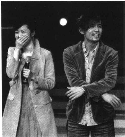
2005年一开春，媒体爆出周杰伦与美女主播日本密会，其后，两人的恋爱关系逐渐明朗化。

速走红，在中国内地的娱乐圈尚未有先例。如今，台湾最红组合S.H.E中最有观众缘的，是最不漂亮最不打扮最像男生的Ella。喜欢她们的，大多是女孩。女人们作为“超女”收视的主力军，她们的审美取向，从某种意义上来说，决定了“超女”最后的结果。前年的“超女”还没成大气候，女孩们的生杀大权还集中在评委手里，所以出了安又琪、张含韵，一看就是传统标准审美的结果，一个是端正齐整的漂亮，一个是扭捏嗲气的可爱。根正苗红、字正腔圆的标准美女叶一茜，成了前十名里唯一的花瓶，还被大家称为一脸“二奶相”，她的粉丝被称为“奶粉”或“奶瓶”（二奶+花瓶），陈西贝因为喜欢穿短裙，人称“陈大腿”，连挤进头三名的张靓颖也要被骂为“风尘味”、“怨妇”。著名博客安替也是“奶粉”，几乎声泪俱下地控