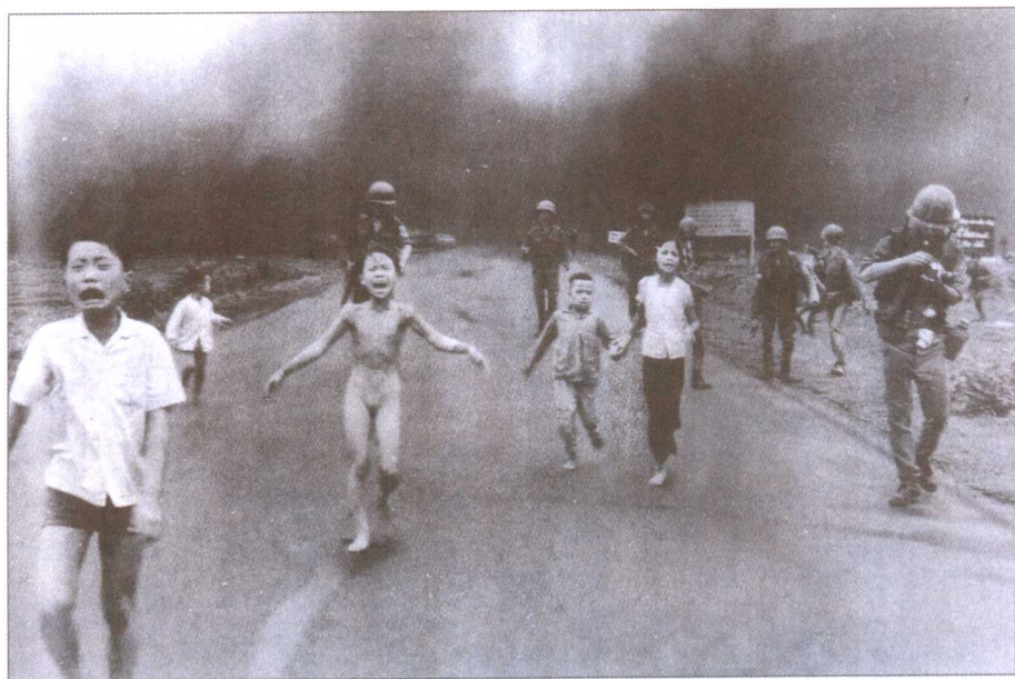
《奔跑中的越南小姑娘》

▲这幅由美联社摄影记者尼克（越南名为阮公益，Kathy Ryan）拍摄的著名的照片摄于越南战争中，画面中的小女孩年仅9岁，在美军飞机的空袭中，她身上的衣服都被凝固汽油弹击中，惊恐之下只得脱掉一切在公路上向前狂奔。