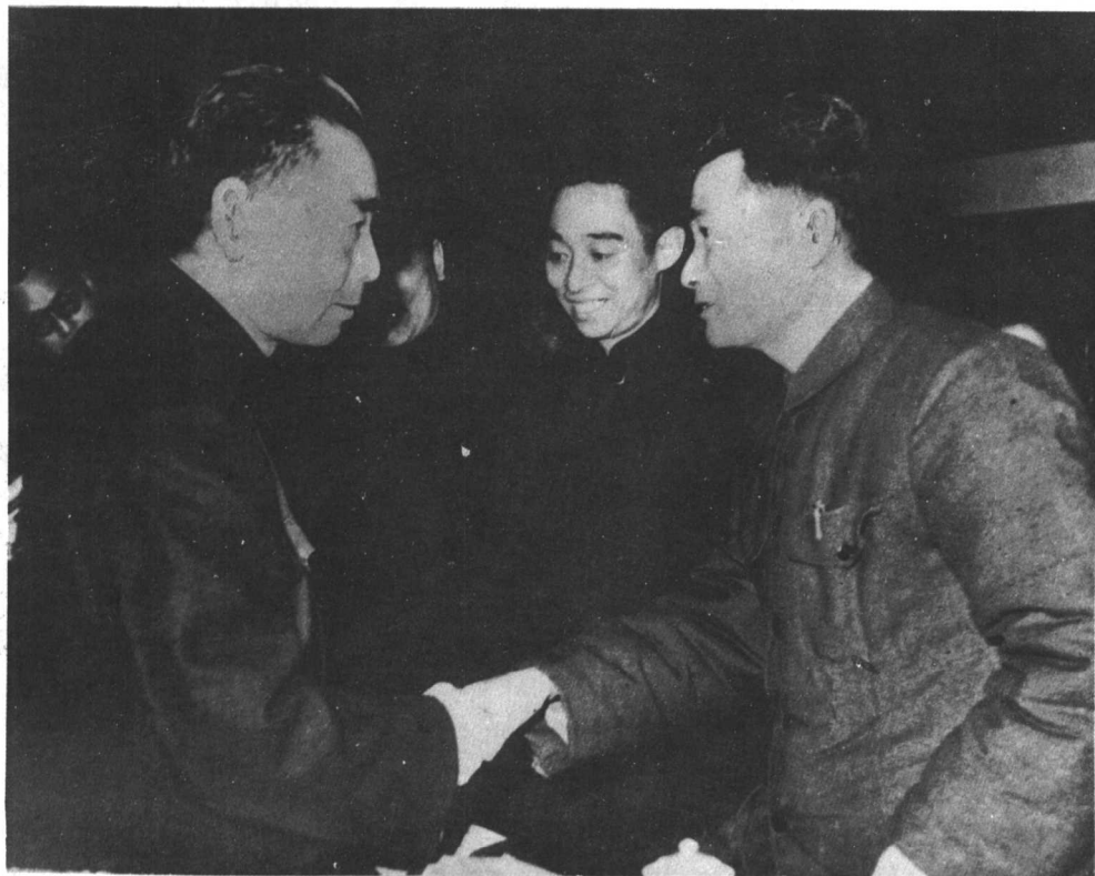
1957 周恩来总理在沪， 接见上海文艺界著名人士， 与张乐平亲切握手。 周恩来总理(左)、 张乐平(右)。