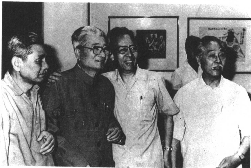
1983“张乐平画展”在北京中国美术馆展出，与漫画界友好欢聚一堂。陆志痒(左一)、张乐平(左二)、叶浅子(右一)、廖冰兄(右二)。