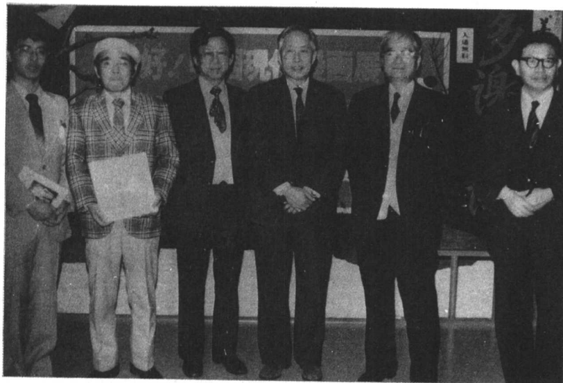
1981英韬(右一)、张乐平(右二)、华君武(右三)中国漫画家访日团，与日本漫画界人士合影于东京“中国现代漫画展”上。