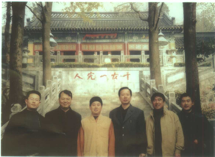
传真法师陪同玄武区区委书记陆冰考察玄奘寺